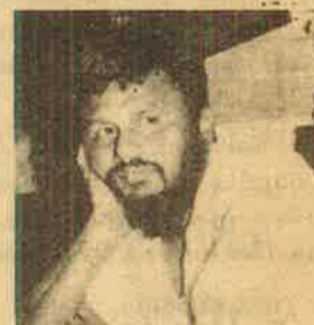
அடுத்த முதலமைச்சர் டக்ளஸ் தேவானந்தே!

B.B.C. தமிழோசைக்குப் போன் செய்து அடுத்த முதலமைச்சர் நான் தான் என்றும் நாட்டு மக்களுக்கு அறிவிப்பு ஒன்று கொடுக்க வேண்டும். ஆகவே தனது பேச்சினை ஒலிபரப்பும்படி வழிந்து கோரினார். டக்ளஸ் தேவானந்தே.