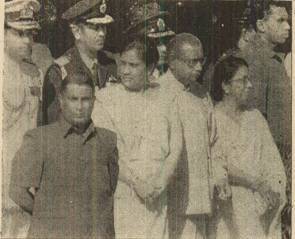
சுதந்திர தின விழாவில் வெடிகுண்டு தேடும் சந்திரிகா!

தனது தீர்வுத் திட்டத்தை எல்லோரும் ஆதரிப்பதாகக் கூறியுள்ளார். ஏற்க வேண்டியது தமிழ் மக்கள் அல்லாமல் சிங்களவரோ பறங்கியரோ அல்ல. தனது திருத்தத்தில் கூட புத்தமதம் அரசு மதம் என்றும் அதனை வளர்ப்பதும் பாதுகாப்பதும் அரசின் கடமை என்றும் இரண்டாவது அத்தியாயத்தை பௌத்தத்துக்கு ஒதுக்கியுள்ளார். சந்திரிகா புதிய திருப்பத்தை கொண்டு வருப