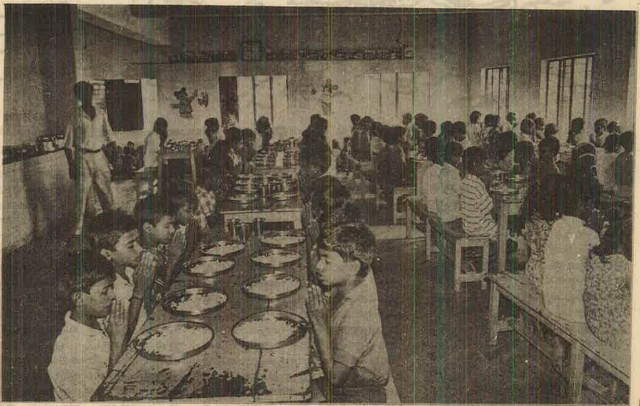
உணவு வேளையின்போது பிரார்த்தனையில் ஈடுபட்டுள்ள மாணவர்களின் ஒரு பகுதியினர்.