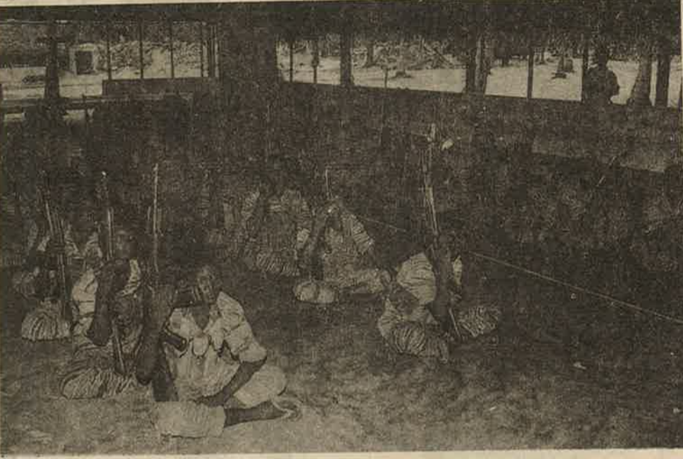
வீறு கொண்ட புலிப்படைப் போராளிகள் என்று பெருமையுடன் வெளியிட்ட சிறுவர்களது புகைப்படங்கள்.

அழிக்கவென பணி செய்யாதீர்கள். பேராசையும் பழி வாங்கிலாபம் தேடுவதையும் நிறுத்துங்கள் அனைவருக்குமாகவே தான் நாடு என்று சொல்லுங்கள், ஒன்றுபட்டு போராடுங்கள் என்று சொல்லுங்கள். இப்படிப் பத்திரிகைகளும் அறிவு ஜீவிகள் என்று இருப்பவர்களும் பிரசாரங்கள் என்று அலைபவர்களும்