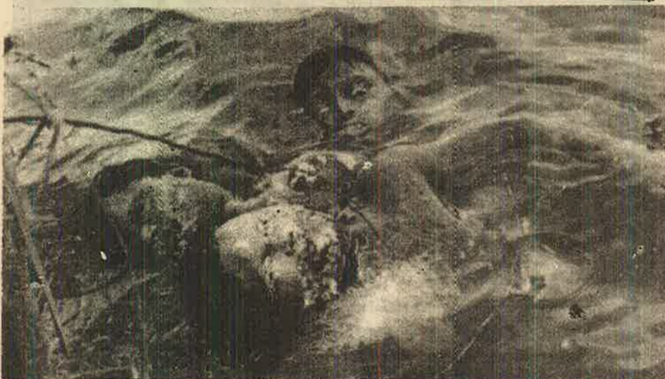
வாசிகளில் சிதையுண்டு மிதக்கும் தமிழர்களின் உடல்கள்

வோவும்தான் என்பது சந்திரிகாவுக்கு தெரிந்திருக்காது. யாழ்ப்பாணத்துக்கு இராணுவத்தை அனுப்பி பண (ஜெபம்) ஓதியா கைப்பற்றினார். வன்முறையைத்தானே சந்திரிகா பயன்படுத்தினார். ஐந்து லட்சம் பேரை அகதிகளாக்கிவிட்டு அடிப்படை அத்தியாவசிய தேவைகளை யும் நிறுத்திவிட்டு, தமிழ் மக்கள் படும் துயரத்தை ரசித்து வரும் சந்திரிகா சுதந்திர தின விழாவில் காரணயம் பேசுகிறார். மக்களை ஏமாற்ற விழாவும், அதற்கு பாதுகாப்பும்.