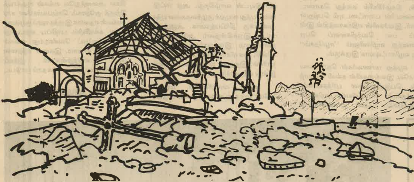
அமெரிக்க விமானப் படையின் குண்டு வீச்சால் நாசமாதிப் போன வியட்நாம் கிராமத்தின் வரை படம்.

ளுக்கெல்லாம் யார் காரணம் என்று கூறி அவர்கள்மீது உன்னை வெறுப்புக்கொள்ளச் செய்து கொஞ்சம் கொஞ்சமாக புரட்சியில் உன்னையும் பங்கு கொள்ளச் செய்யவேண்டும் என்பதற்காகத்தான்; உன்னிடமிருந்து இவ்வளவு செய்திகளைக் கேட்ட பிறகு உன் கணவரீது கொண்டிருந்த மதிப்பும் மரியாதையும் அதிகரித்திருக்கிறது. இருபது வயதே நிரம்பிய இளம் வாலிபனாக, சைகோனைப் போன்ற நகரில் வாழ்ந்தும் சகல ஆசைகளையும் அடக்கிக் கொண்டிருக்கிறார். இரண்டு வருடத்தில் ஒருமுறைதான் சினிமாவுக்குப் போயிருக்கிறார். அதுவும்கூட தன்னுடைய அன்புக்குரிய வளைத் திருப்தி