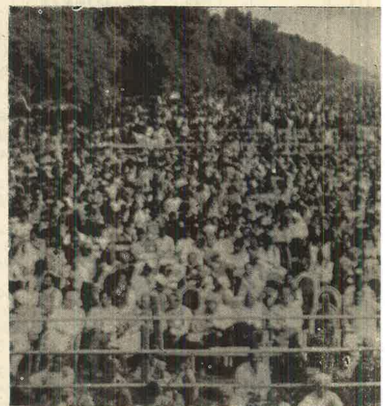
தொழிலாளர் உரிமைகளைத் துண்டாடும் உலக வங்கியிடத்தில் நடைமுறைக்கிடுவதை எதிர்த்து 1992 நவம்பர் நடைபெற்ற கூட்டத்தில் கலந்துகொண்ட இலட்சக்கண