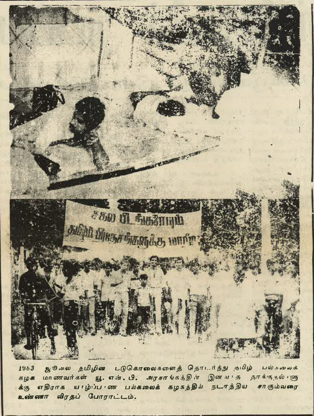
1983 ஜூலை தமிழின படுகொலைகளைத் தொடர்ந்து தமிழ் பலகலைக் கழக மாணவர்கள் யூ. என். பி. அரசாங்கத்தின் இனவாத தாக்குதல்களுக்கு எதிராக யாழ்ப்பாண பல்கலைக் கழகத்தில் நடாத்திய சாகும்வரை உண்ணா விரதப் போராட்டம்.

இது நான்கு புறத்தில் இரு காட்டுமிராண்டித் தனத்தின்தும் மக்களைச் சுற்றிவளை