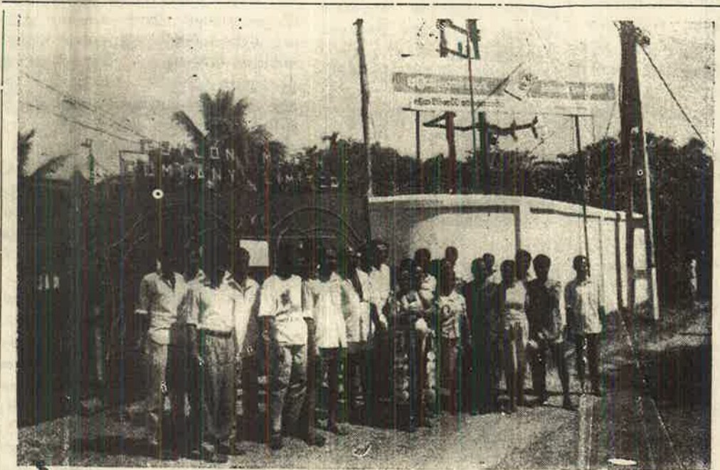
வேலை நீக்கப்பட்டுள்ள யானை தீப்பாட்டி தொழிலாளர் - செய்தி 9ம் பக்கம்

வடக்கு - கிழக்கில் இருந்து இராணுவத்தை வெளியேற்று!