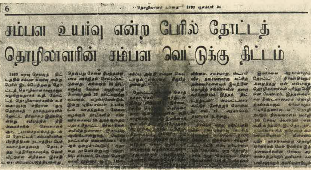
'தொழிலாளர் பாதை' இச்சதி பற்றி தொழிலாள வர்க்கத்தினை எச்சரித்து வெளியிட்ட செய்தி

பிரித்தானிய ஏகாதிபத்திய ஆட்சிக் காலத்தில் இருந்து ஒரு நூற்றாண்டு காலம் தோட்டத் தொழிலாளர்களுக்கு எதுவிதமான நிலையான சம்பளமும் கிடைத்ததில்லை. இந்த 25 நாள் வேலைக்குச் சமானமான சம்பளம் பெறத் தொடங்கியது சமீபத்தில். கடந்த டிசம்பரில் இருந்து ஒரு தொழிலாளியின் சராசரி நாட்சம்பளம் ரூபா 60/30 ஆகியது. கடந்த வரவு-செலவுத் திட்டத்தில் வழங்கிய ரூபா 300/- 'சம்பள உயர்வை' தோட்டத் தொழிலாளர்களுக்கும் வழங்கும் கருணையின் பின்னணியில் இந்த 25 நாட்களுக்கு சம்பளம் பெறும் உரிமை பறிக்கப்பட்டுள்ளது. ஜனவரியில் இருந்து நாட்சம்பளம் ரூபா 74/38 ஆக்கப்பட்டு, தொழிலாளர்கள் நாட்கூலிகள் ஆக்கப்பட்டுள்ளனர். எயக்குக் கிடைத்துள்ள தகவல்களின் படி சகல தோட்டங்களிலும் தொழிலாளர்களுக்கு 20 நாட்