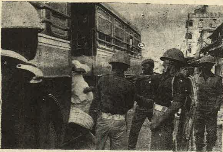
நரசிம்மராவ் அரசாங்கம் வீதியில் இயக்கி உள்ள இராணுவம் - பொலிஸ்