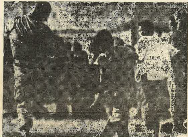
அமெரிக்க ஏகாதிபத்திய கேடி புஷ்ஷின் கட்டளைப்படி இராணுவம் சோமாலிய சிறுவனை எட்டி உதைத்து "சோறு போடும் காட்சி"

அனைத்து ஏகாதிபத்திய சக்திகளும் புதிய இராணுவ சாகசங்களுக்கான தமது சொந்த தயாரிப்புகளுக்கு போர்வையாக சோமாலியா மக்களின் அல்லல்களை பயன்படுத்துகின்றனர். 17க்கும் அதிகமான நாடுகள் சோமாலியாவுக்கு படைகளை அனுப்பின அதில் இத்தாலியும் உள்ளடங்கும். அங்கே அது நூற்றாண்டுக்கு மேல் ஆட்சி செய்தது, மறுபடியும் காலனித்துவ ஆதிக்கத்தை நிலைநாட்ட ஆர்வமாயுள்ளது. அதுபோலவே பிரான்சு, பெல்ஜியம் போன்ற மற்றைய முன்னைய காலனித்துவ சக்திகளும் மாறும். 'கோல்' அரசாங்கம் சோமாலியாவுக்கு 1500 ஜெர்மன் துருப்புகளை அனுப்ப தயார் செய்கிறது, இதுவே முதல் தடவையாக ஜெர்மன் துருப்புகள் இரண்டாம் உலக யுத்தத்துக்குப் பிறகு மேற்கு ஐரோப்பாவுக்கு வெளியே பயன்படுத்தப்படும்.