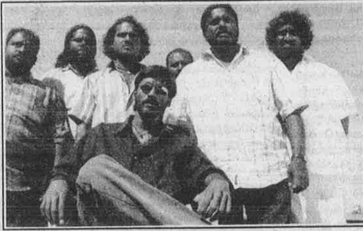
உண்மையான ரவுடியிசம் தொடங்கும் இடத்தில் புதுப்பேட்டை முடிந்து விடுகிறது.

தமிழ் சினிமாவில் தாதா ஃபார்முலா படங்கள் ஓடும் காலமிது. வாழ்க்கையில் நாடோடிகளாக ஓடிக்கொண்டிருக்கும் இளைஞர்கள் மட்டும் திரையரங்கிற்கு வருவதால் அவர்களைக் கவர் விறுவிறுப்பான திரைக்கதை தேவைப்படுகிறதாம். விறுவிறுப்பிற்கு வேறு எந்த ஃபார்முலாவையும் விட தாதாயிசம் பொருத்தமாக இருப்பதால் சித்திரம் பேசுதடி. தொடங்கி, பட்டியல், தலைநகரம், கொக்கி, ஆறு வரை நீரும் பட்டியலில் தற்போது புதுப்பேட்டை.