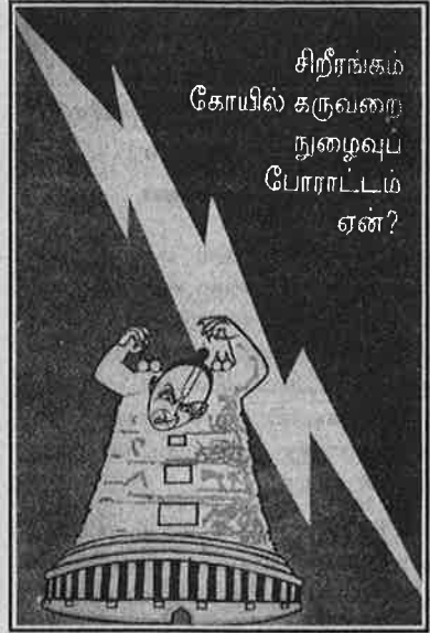
மக்களிடமிருந்து பார்ப்பன இந்து மதவெறியர்களைத் தனிமைப்படுத்திய ம.க.இ.க.வின் போராட்டம்!

"இந்தச் சட்டம் சரியானது, இதற்குத் தகுதி தேவையில்லை. தாழ்த்தப்பட்டவரும் அர்ச்சகராகலாம். தி.மு.க.வுக்குத்தான் ஒட்டுப் போட்