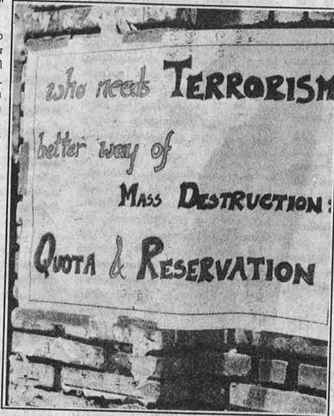
சமூகத்தை அழிக்க பயங்கரவாதம் தேவையில்லையாம். அதை இடஒதுக்கீடே பார்த்துக் கொள்ளுமாம். திமிரி எழும் பார்ப்பனக் கொழுப்பு.

ஆக, ஐ.ஐ.டி., ஐ.ஐ.எம்., எய்ம்ஸ்-இல் இடஒதுக்கீட்டு வந்து, 'தரம்' குறைந்து விட்டால் என்னவாகும்? அமெரிக்க, ஐரோப்பிய எசுமானர்களுக்குச் சேவை செய்வதற்கான வாய்ப்பை இந்தியக் கூலிப் பட்டாளம்