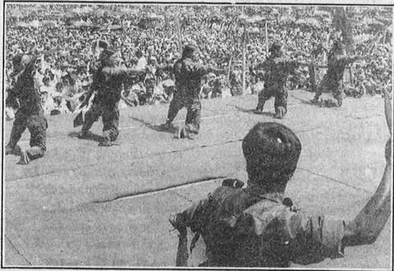
மக்கள் வெள்ளத்தில் மாவோயிஸ்ட்டுகளின் கலை நிகழ்ச்சி.

உண்மை என்னவெனில், இப்போது போர் நிறுத்தத்தைக் கடைப்பிடித்து வரும் மாவோயிஸ்ட்டுகளே நேபாளத்தின் பெரும்பான்மையான