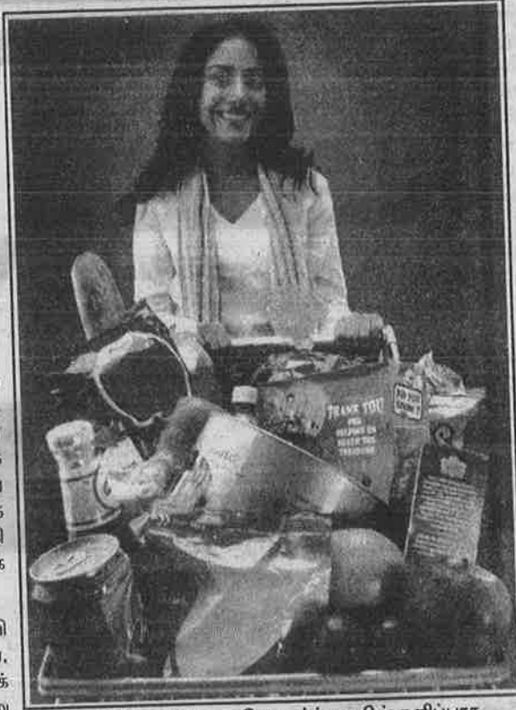
வாங்கிக் குவிப்பதையே வாழ்க்கையின் களிப்பாக நினைக்கும் அமெரிக்க வாழ்க்கை உருவாக்கியிருக்கும் நோய் - அபூர்வம்!

ஷாப்பிங்தான் அமெரிக்கர்களுக்கு பிடித்த பொழுதுபோக்கு. நோய் தீர்க்க ஷாப்பிங், உற்சாகத்திற்காக ஷாப்பிங், ஷாப்பிங்கிற்காக ஷாப்பிங் என வாங்கிக் கொண்டே இருப்பது என்பது அமெரிக்க கலாச்சார கூறுகளில் ஒன்றாகிவிட்டது.