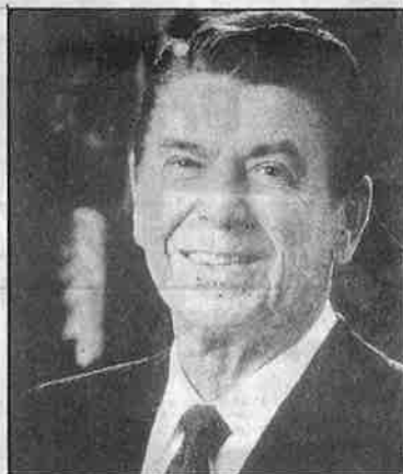
மேலாதிக்க போர் வெறியன் ரீகன்.

தில்லி யூனியன் பிரதேசத்தை ஆளும் காங்கிரசு அரசு, "யூனியன் பிரதேச அமைச்சர்கள் 5,000 ரூபாய் பெறுமான மின்சாரத்தை இலவசமாகப் பெறலாம்" என்ற சலுகையை அறிவித்துள்ளது. "விவசாயிகளுக்கு இலவச மின்சாரம் வழங்கப்படுவதை கொள்கை ரீதியாக ஏற்றுக் கொள்ள முடியாது" என முழுக்கம் போட்ட பிரதமர் மன்மோகன் சிங், இந்தச் சலுகையைப் பற்றி வாயைத் திறந்ததாகத் தெரியவில்லை. மேலும், தில்லி யூனியன் பிரதேச அமைச்சர்கள், "தங்களுக்கு மைய அமைச்சர்கள் போல பயணச் சலுகை கொடுக்க வேண்டும்; அம்பாசிடர் கார்டுக்குப் பதிலாக, ஒரு கோடி ரூபாய் பெருமான லக்ஸர் கார் வேண்டும்" என்றும் கோரிக்கை வைத்திருக்கிறார்கள். அரசு கஜானா இப்படிதான் கொள்ளையடிக்கப்படுகிறது.