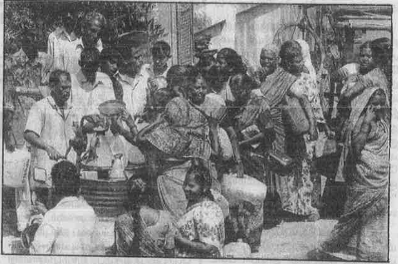
ரேசன் கடைகளில் மண்ணெண்ணெய் வாங்க காத்து நிற்கும் ஏழைகள்: அனைவருக்கும் ரேசனில் உணவுப் பொருள்கள் வழங்குவோம் எனக் குறைந்தபட்ச பொதுத் திட்டத்தில் கொடுக்கப்பட்ட வாக்குறுதிக்கு மாறாக, "வறுமை கோட்டுக்கு கீழே உள்ளவர்களுக்கு மட்டும்தான் உணவுப் பொருட்கள்" என்ற உலக வங்கியின் கட்டளையைத்தான் காங்கிரசு அரசு நடைமுறைப்படுத்துகிறது.