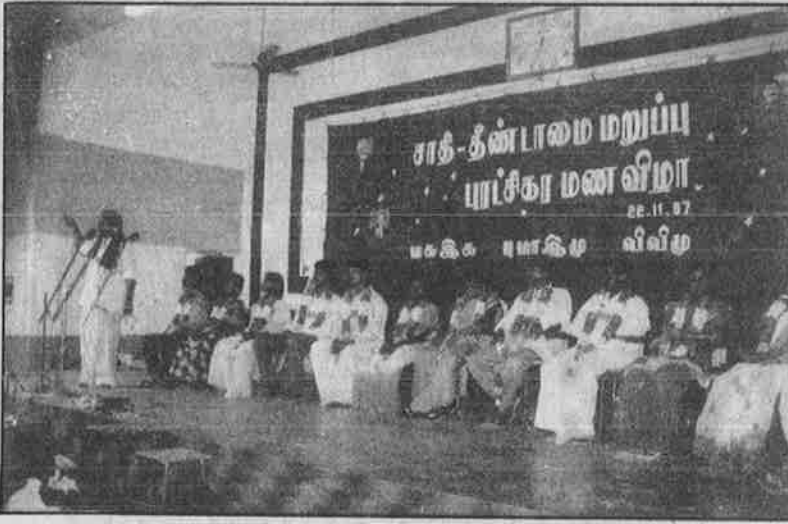
சாதி - தீண்டாமை ஒழிப்பு இயக்கத்தையொட்டி, விழுப்புரத்தில் நடந்த சாதி - தீண்டாமை மறுப்பு புரட்சிகர மணவிழா!

“சூத்திர” மக்கள் இதைத் தமது இயக்கமாகக் கருதி அணிதிரள் வேண்டும் என்பதே அக்கறையாக இருக்க வேண்டும். அதில்தான் புதிய ஜனநாயகப் புரட்சியின் வெற்றிக்கான உயிர்நாயகியே அடங்கியிருக்கிறது.” (புதிய ஜனநாயகம், 1-15 மே, 1993 இதழ் கேள்வி - பதில் பகுதி)