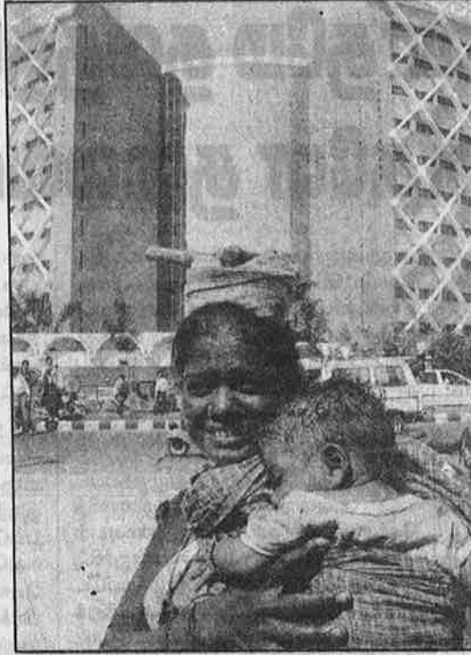
ஹைதராபாத்தில் உள்ள "சைபர்கோபுரத்தின்" முன், கிராமத்தை விட்டு வேலை தேடி வந்துள்ள கூலித் தொழிலாளி; பகட்டும் வறுமையும்.

குறிப்பாக, பருத்தியே பயி ரிட்டிராத தெலுங்கானா விவசாயி கள், 1990-க்குப் பின் பருத்தி விவசாயிகளாக மாற்றப்பட்டனர். 1995-ஆம் ஆண்டு வரை சர்வதேச சந்தையில் உச்சத்தில் இருந்த பருத்தியின் விலை, அதன்பின் அதளபாதாளத்திற்குச் சரிந்து வீழ்ந்தது. 1997-98-ஆம் ஆண்டுகளில் தெலுங்கானா பகு தியில் பருத்தி விவசாயிகள் கொத்து கொத்தாகத் தற்கொலை செய்து கொண்டதற்கு இந்த உலக மயம்தான் காரணமாக அமைந் தது. இந்தச் சமயத்தில் கடனில் மூழ்கிப் போன, பயிர் சாவியா கிப் போன பருத்தி விவசாயிக ளுக்கு; அதனால் தற்கொலை செய்து கொண்ட விவசாயக் குடும்பங்களுக்கு குறைந்தபட்ச நட்புக் கூட வழங்க சந்திரபாபு நாயுடு மறுத்துவிட்டார். இதற்கு மாறாக, விவசாயத்தில் உலகம யத்தை இன்னும் தீவிரமாக அமல்படுத்த வேண்டும் என வெள்ளை அறிக்கை தயார் செய் தது. சந்திரபாபு நாயுடு அரசாங்க ம்.