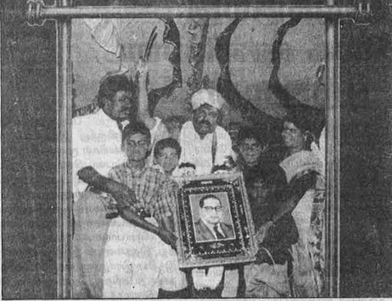
ஓட்டுக் கட்சிகளில் காணப்படும் தனிநபர் வழிபாட்டைப் பின்பற்றி, திருமாவளவன் பிறந்த நாளையொட்டி அவரைத் துதிப்பாடி, தாய்மண் (ஆக. 2003) இதழில் வெளிவந்த விளம்பரம்.

ருந்து இவர்களுக்குச் சொந்த ஆதாயம் கிடைப்பதற்கான வாய்ப்புகளே கிடையாது; அதோடு இவர்களது சந்தர்ப்பவாத அரசியலை அவ்வப்பொழுது அம்பலப்படுத்தி, சமூக ஆதரவிழக்கச் செய்கின்றன. இதனால் இரட்டை ஆத் திரத்துடன் இந்த அமைப்புகள் மீது பாய்கின்றன.