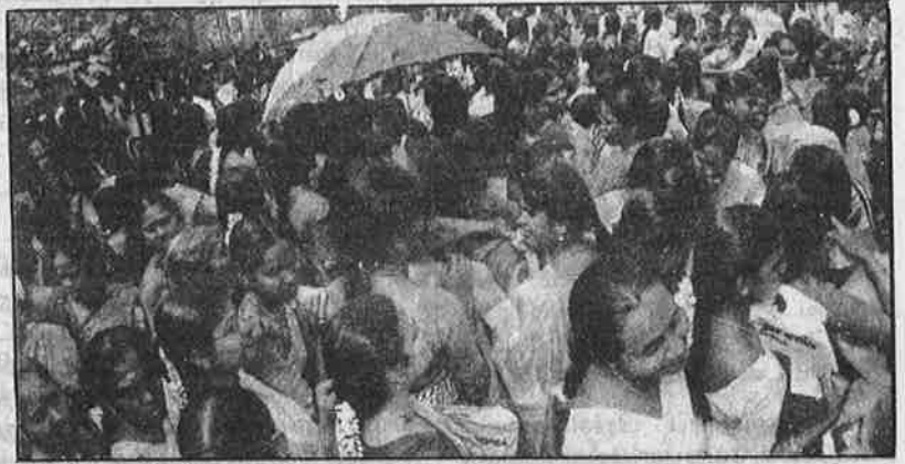
கோயம்புத்தூர் மாவட்ட வேலைவாய்ப்பு அலுவலகத்தில் பதிவு செய்யக் காத்திருக்கும் வேலையில்லாத இளைஞர்கள். "ஒரு குடும்பத்தில் ஒருவருக்கு ஒரு ஆண்டுக்கு 100 நாட்கள் வேலை உத்திரவாதம்" என்பது குறைந்தபட்சப் பொதுத் திட்டத்தின் வாக்குறுதி. ஆனால், அரசுத் தலைவர் உரை, இந்த உத்திரவாதம் கிராமப்புற ஏழைகளுக்கு மட்டும்தான் என வெட்டிக் குறுக்கி, நகரப்புறத்து ஏழைகளை "அம்போ" எனக் கைவிட்டுவிட்டது.

குழந்தைகள் நலச்சேவை, சுகாதாரம் மற்றும் கல்விக்காக அரசின் நேரடிச் செலவு அதிகரிக்கப்படும் என்று பொதுத் திட்டம் வாக்குறுதி கொடுத்தா