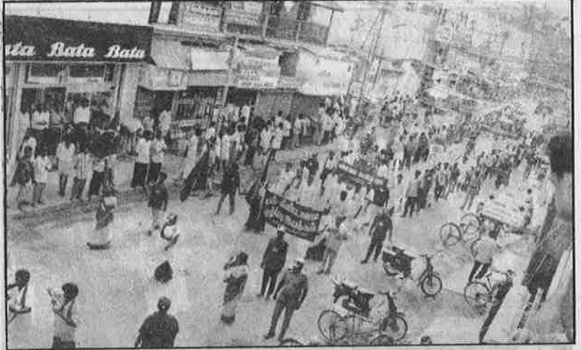
ம.க.இ.க. - வி.வி.மு. - பு.மா.இ.மு. நடத்திய சாதி - தீண்டாமை ஒழிப்பு இயக்கத்தையொட்டி, மதுரை நகரில், மேல்சாதியினர் நிறைந்திருக்கும் தெருக்களினூடாக, சாதி - தீண்டாமையை எதிர்த்து நடத்தப்பட்ட பேரணி.

தாழ்த்தப்பட்ட மக்களுக்கு எதிரான ஒடுக்குமுறையை எதிர்ப்பது - கண்டிப்பதற்கும், சாதி - தீண்டாமை ஒழிப்புக்காக இயக்கம் நடத்துவது ஆகியவற்றுக்கும் சம்பந்தமே இல்லாதது, மாறானது என்பதாகவும் நமது தமிழ் மக்கள் இசை விழாக்களையும், பார்ப்பன பயங்கரவாத எதிர்ப்பு மாநாடு - இயக்கங்களையும் "தலித்" தலைவர்கள் சித்தரிக்கிறார்கள். இப்படிச் சித்தரிப்பதன் மூலம் இவர்களுக்கு சாதி - தீண்டாமை ஒழிப்பில் உண்மையிலேயே அக்கறை கிடையாதோ,