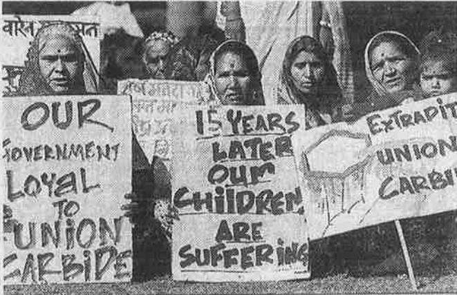
படுகொலை நடந்து 15 ஆண்டுகளாகியும் தொடரும் அவலம்: மக்கள் விசாராத ஆட்சியாளர்களுக்கு எதிராக போபால் மக்களின் ஆர்ப்பாட்டம்

இந்தியத் தொழிலாளர்களின் உழைப்பை ஒட்டச் சுரண்டிக் கொழுக்கும் தரகுப் பெருமுதலாளித்துவ நிறுவனங்களுக்கும் பன்னாட்டு நிறுவனங்களுக்கும் இந்திய ஆட்சியாளர்கள் போட்டி போட்டுக் கொண்டு கணக்கற்ற சலுகைகளை வாரியிறைத்த போதிலும், இத்தொழில் நிறுவனங்கள் அரசுக்குச் சல்லிக்காக கூட வரியாகச் செலுத்தாமல் ஏய்த்து வருகின்றன. தொடர்ந்து இலாபமீட்டி வரும் 1500 முன்னணி தொழில் நிறுவனங்களில் 1000-க்கும் மேலானவை சட்டத்தின் ஒட்டைகளைப் பயன்படுத்திக்