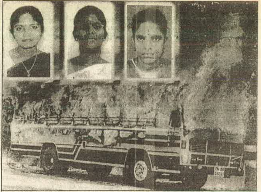
அ.தி.மு.க. குண்டர்களால் கொளுத்தப்பட்ட பேருந்தும், உயிரோடு எரித்துக் கொல்லப்பட்ட விவசாயக் கல்லூரி மாணவிகளும்: தொடரும் ஜெயாவின் கிரிமினல் குற்றங்கள்