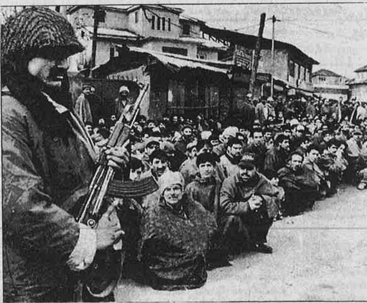
நிரந்தர இராணுவக் கண்காணிப்பு - சோதனையின் கீழ் வைத்திருக்கப்படும் காஷ்மீர் மக்கள்

கண்காணிப்பு அதிகாரியும் சிறப்பு நடவடிக்கைக் குழுவினரும் கொல்லப்பட்டனர்.