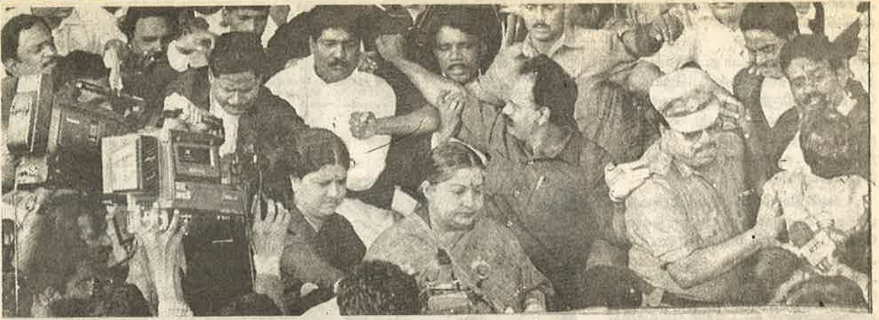
ஏழைக் குற்றவாளிகள் தண்டிக்கப்பட்டவுடன் சிறைக்குள் தள்ளப்படுகிறார்கள். "ப்ளென்ட் ஸ்டே" விடுதி வழக்கில் சட்டப்படி தண்டிக்கப்பட்ட ஜெயாவோ, ராஜமரியாதையோடு நீதிமன்றத்தில் இருந்து போயசு தோட்டத்துக்கு அனுப்பப்படுகிறார்!