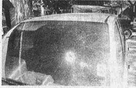
உ.பி. மாநில போலீசால் 'தவறுதலாகச் சுட்டுக் கொல்லப்பட்ட இளம் பெண் பயணம் செய்த கார்'.

போலீசுக்காரர்களும் சாதாரண மனிதர்கள் தான். சம்பளமும், கிம்பளமும், அதிகாரமும் நிறைந்த