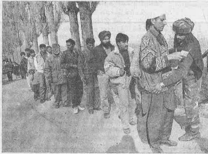
சொந்த நாட்டிலேயே அந்நியர் போல் நடத்தப்படும் அவலம்

ஜெர்மனி, அமெரிக்கா போன்ற நாடுகளின் உதவி கொண்டு, நமது திடீர்த் தாக்குதல் முறைகளை நாம் ஒழுங்காக அமைத்துக் கொள்ள வேண்டும். அதற்கான உபகரணங்களையும், ஆயுதங்களையும், பயிற்சியையும் பெற வேண்டும். விமான நிலையங்களில் பாதுகாப்பு முறைகளை, சோதனை முறைகளை சரி செய்து கொள்ளவும் கூட, இவற்றில் அனுபவப்பட்ட நாடுகளின் உதவியைப் பெற வேண்டும். காஷ்மீரில் சற்றும் தயவு தாட்சண்யம் காட்டாமல் தீவிரவாதத்தை ஒடுக்க முனைய வேண்டும். தீவிரவாதத்தை ஒடுக்குவதில் சட்டத்தை நம்புவதைவிட, நிர்வாக உறுதியையும், போலீஸ் மற்றும் இராணுவ முனைப்பையும் தான் நம்ப வேண்டும். சில நேரங்களில் அடி உதவுகிறார் போல் அண்ணன் தம்பி உதவ மாட்டார்கள்; தீவிரவாதிகள் விஷயத்தில் என்கெண்டர் உதவுகிறார் போல், சட்டம் உதவாது." (துக்ளக் 12.1.2000)