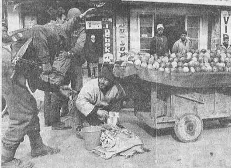
பழ வியாபாரியிடம் வெடிகுண்டைத் தேடி மிரட்டும் இராணுவம்: அரண்டவன் கண்ணுக்கு இருண்டதெல்லாம் பேய்!

“ஆகவே, காஷ்மீர் மக்கள் இந்தியாவை நேசிக்கத் துவங்கும்வரை, அங்கு அரசியல் சுதந்திரத்தை அனுமதிப்பது இந்தியாவின்