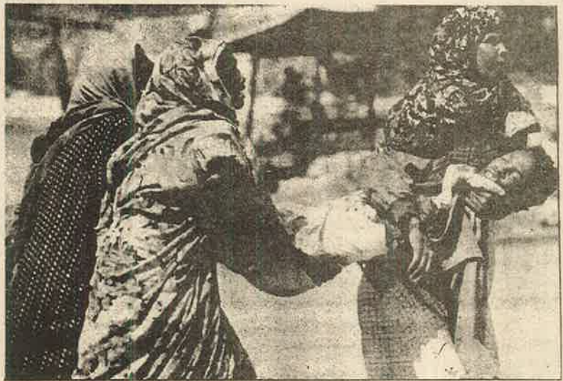
துப்பாக்கிச் சூட்டில் இறந்தவரைத் தூக்கிச் செல்லும் சோமாலியப் பெண்கள்; ஐ.நா. படையின் அக்கிரமம்

மாமியாரும், மாமனாரும், கணவனும் அவளின் தலைமுடியையும், கைகளையும் கெட்டியாகப் பிடித்துக் கொண்டு அடர் கந்தக அமிலத்தைக் குடிக்க வைத்துள்ளனர். குடித்த மறுநிமிடமே அவளது தொண்டைக் குழி முழுவதும் வெந்து போனது. இரண்டே மாதத்தில் அவளது கருப்பையில் வளர்ந்து வந்த சிசு கலைந்துபோனது. உணவுக் குழாயும், வயிறும் வெந்து போனதால் எதையும் உண்ண முடியாது உடல் எடை 20