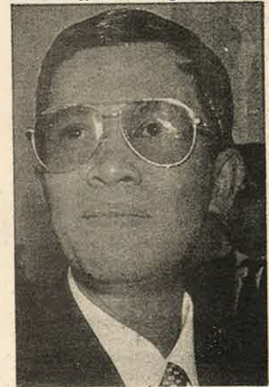
ஏகாதிபத்திய அடிவருடி; துரோகப் பிரதமர் ஹூன்சென்

இதை நன்குணர்ந்த கேமர் ரூஜ் இயக்கம், "தற்போதைய ஹூன்சென் அரசைச் சட்டபூர்வமாக நியாயப்படுத்தும் வகையிலேயே ஐ.நா. அமைதிப் படை செயல்படுகிறது; இத்தகைய சூழ்நிலையில் நடத்தப்படும் தேர்தல் மோசடியானது" என்று குற்றம் சாட்டியதோடு, இம்மோசடித் தேர்தலைப் புறக்கணிப்பதாகவும் அறிவித்தது. ஐ.நா. அமைதிப் படைக்கு விருந்தும் விபச்சார சுகமும் அளித்து ஹூன்சென் அரசு குறுக்கு வழியில் வெற்றி பெற முயல்வதாக இதரப் போராளி இயக்கங்கள் குற்றம் சாட்டிய