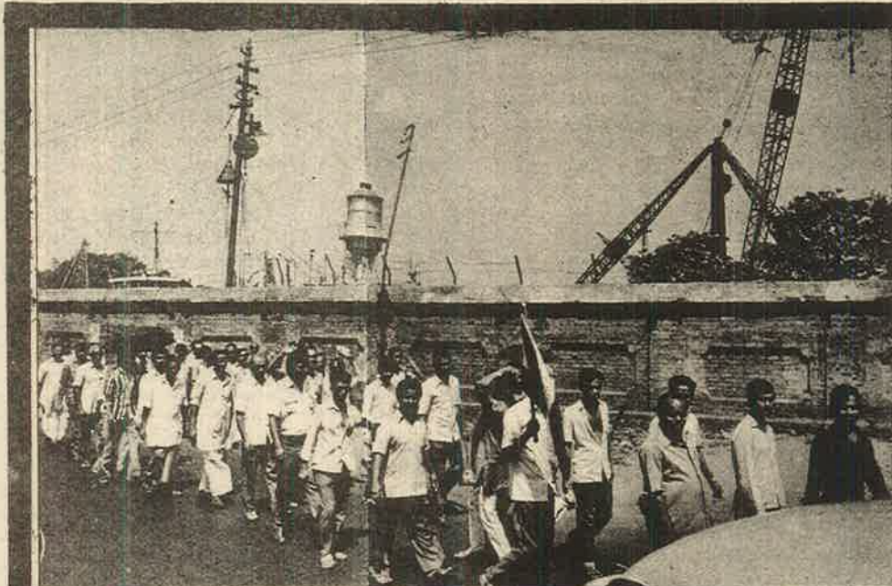
நவீன மயமாக்கல், தாராளமயமாக்கலால் வேலையிழக்கும் தொழிலாளர்களின் நலன்களுக்கு மட்டுமின்றி, நாட்டின் ஒட்டு மொத்த அரசியல் பொருளாதார நலனையே அடகு வைத்துள்ள இந்த அரசுக்கு எதிராக, தொழிலாளர்கள் போராட வேண்டும்.

தொழிற்சங்கங்களோ தொழிலாளர்களுக்கு முன்னேயுள்ள படுபயங்கர நிலையை எதிர்கொள்ள திராணியுள்ளனவாக இல்லை. தொழிலாளர் விரோத போக்குகளை ஒப்புக்கு எதிர்ப்பது, சவால் அடிப்பது, பின் நெருக்கடியை நேருக்கு நேர் சந்திக்கும்போது முணுமுணுப்போடு அடங்கிப்போவது என்றவாறே நடந்து கொள்கின்றன. பொருளாதாரவாதம், குறுகிய தொழிற்சங்கவாதம், சட்டவாதம் என்ற