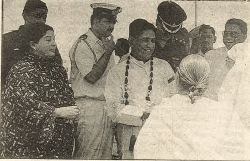
கவர்னர் சென்னாரெட்டியை வரவேற்கும் ஜெயா: அதிகார-ஆணவத்திமிர் பிடித்த 'ஜோடிகள்'

தமது ஆட்சிக் கலைக்கப்பட்டால் 356-வது சட்டப்பிரிவை எதிர்ப்பது, இந்த அமைப்பு முறைகளையே காலில் போட்டு மிதிப்பது; மாற்றான ஆட்சியைக் கலைக்க 356-வது சட்டத்தை பயன்படுத்துவது, இந்த சட்ட - அமைப்பு முறைகளை எல்லாம் உயர்த்திப் பிடித்து உச்சாணிக் கொம்பில் வைத்து புகழ்வது - வக்காலத்து வாங்குவது என்பது காங்கிரசு, ஜெயா மட்டுமல்ல ஜனதாதளம், தி.மு.க., பா.ம.க., போலி கம்யூனிஸ்டுகள் உட்பட அனைவரது நடைமுறையும் இதுவே. 356-வது சட்டப்பிரிவைப் பயன்படுத்தி ஜெயாவின் ஊழல் ஆட்சியைக் கலைப்பதில் தவறில்லை என்று பேசி வருகிறது, தி.மு.க.