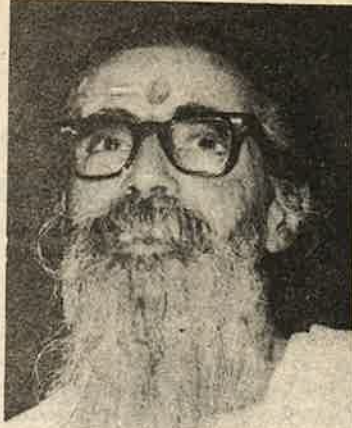
கோல்வால்கர்: ஆர்.எஸ்.எஸ்.-ன் சிந்தாந்த குரு

மாவட்ட நிர்வாகிகள் மாநாட்டில் இந்துத்துவத்துக்குப் புது வியாக்கியானம் கொடுத்து ஒரு நீண்ட சொற்பொழிவாற்றினார். பொருள்முதல்வாதம் மற்றும் தனிமனிதத்துவத்துக்கு முக்கியத்துவம் அளிக்கும் மேற்கத்திய தத்துவத்தில் இருந்து மாறுபட்ட சமூகக் கண்ணோட்டத்தை அடிப்படையாகக் கொண்டதுதான் இந்துத்துவம்; தனிமனிதன் - சமூகம் அல்லது குடும்பம் - இயற்கை - தெய்வீகம் என்கிற நான்கு அடுக்குகளைக் கொண்டதுதான் இந்துத்துவம்; சமூகம் மற்றும் இயற்கையைப் புனிதமாக மதிப்பதன் மூலம் இறைவனை அடைவதுதான் இந்துத்துவம் - என்று கூறி தனது மதவாதக் கண்ணோட்டத்துக்குப் புதிய பூச்சு தந்தார். அறிவு - அதிகாரம், செல்வம், உழைப்பு (புத்தி - ராஜ்யம் - தனம் - சிரமம்) ஆகிய நான்கு சக்திகளின் முரணற்ற ஒருங்கிணைந்த அமைப்புதான் இந்து தர்மம் என்று சொன்னார். உண்மையில் இது பார்ப்பனன் - சக்திரியன் - வைசியன் - சூத்திரன் என்ற நான்கு வருண சனாதன தருமத்தின் மறு விளக்கம்தான். சாதி, பால் மற்றும் வர்க்க அடிப்படையிலான கரண்டலையும், ஒடுக்குமுறையும் அவற்றின் விளைவான போராட்டங்களையும் மூடி மறைத்து இந்து சமூகம் என்பது முரண்பாடுகற்ற சாந்தமும் - ஒற்றுமையும் கொண்டது என்று பித்தலாட்டம் செய்வதுதான் கோல்வால்கரின் சித்தாந்த வியாக்கியானம்.