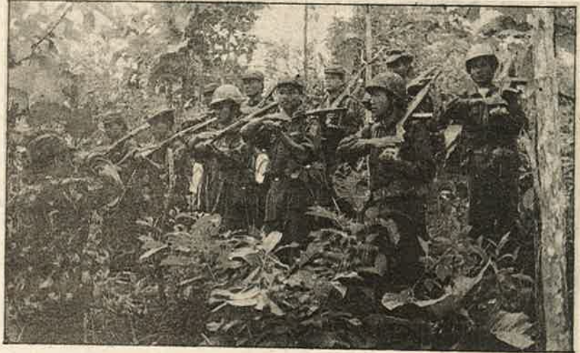
சுயாட்சி உரிமை கோரும் குக்கி போராளிகள்: நாகர்கள் மீது இனவெறி

இந்துவெறி பாசிஸ்டுகள் வாதிடுவது போல, மணிப்பூரிலுள்ள முஸ்லீம்கள், வங்கதேசத்திலிருந்து அகதிகளாக வந்தவர்களல்ல. மைத்தி பங்கல் என்றழைக்கப்படும் அவர்கள் மைத்தி இனத்தின் பூர்வீகக் குடிமக்களாவர். மணிப்பூரின் மனித உரிமைக் கழகமும், கல்லூரிப் பேராசிரியர்களும், போராளி அமைப்புகளும் இந்து வெறியர்களின் பொய்ப் பிரச்சாரத்தை அம்பலப்படுத்தியும் தாக்குதலை எதிர்த்தும் தொடர்ச்சியாக 3 நாட்கள் கடையடைப்புப் போராட்ட