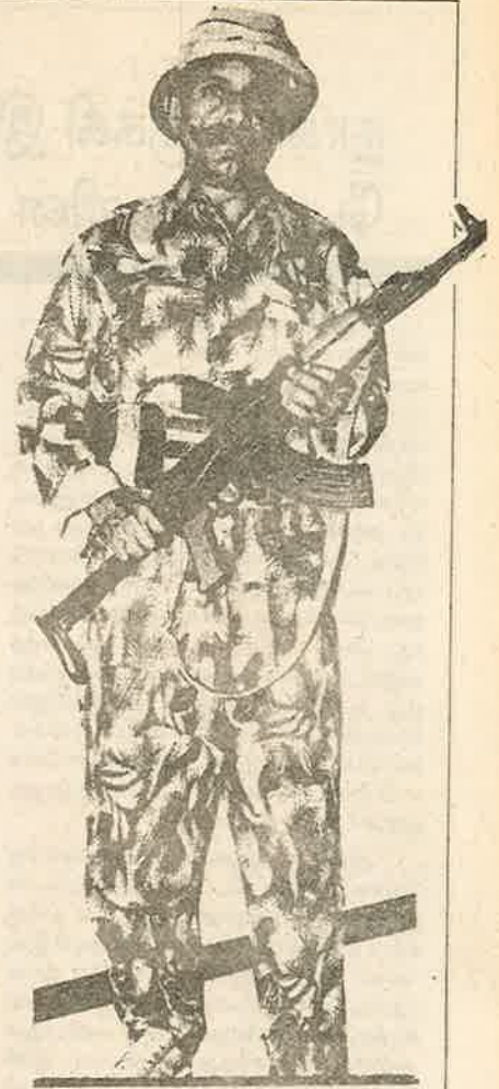
தேவாரம்: காட்டுமிராண்டியின் கோமாளி வேடம்

வீரப்பன் வேட்டை என்ற பெயரில் கர்நாடக எல்லையோ கிராமங்களில் தேவாரம் கும்பல் நடத்துவ வரைமுறையற்ற அட்டுழியங்கள் கேள்வி கேட்பாரின்றி இன்னமும் தொடர்ந்து கொண்டு தான் இருக்கிறது. இது தவிர பஞ்சாபிலும் காஷ்மீரிலும் பாலியல் வன்முறைக்கும், காட்டுமிராண்டித்தனமான சித்திரவதைக்கும் பேர்போன எல்லைப் பாதுகாப்புப் படையின் 5 கம்பெனிகள் வீரப்பன் வேட்டைக்கு கர்நாடக அரசால் இறக்கிவிடப்பட்டுள்ளது. போலீசு, துணை ராணுவப் படைகளால் பாதிக்கப்பட்ட மக்களில் சிலர் முதல்வரின் உதவியாளரிடம் வந்து கதறி அழுத போதிலும், டெல்லியைச் சேர்ந்த மனித உரிமைக்கான அமைப்பு, தொடரும் சித்திரவதைகளைக் கண்டித்து விசாரணை நடத்தக்