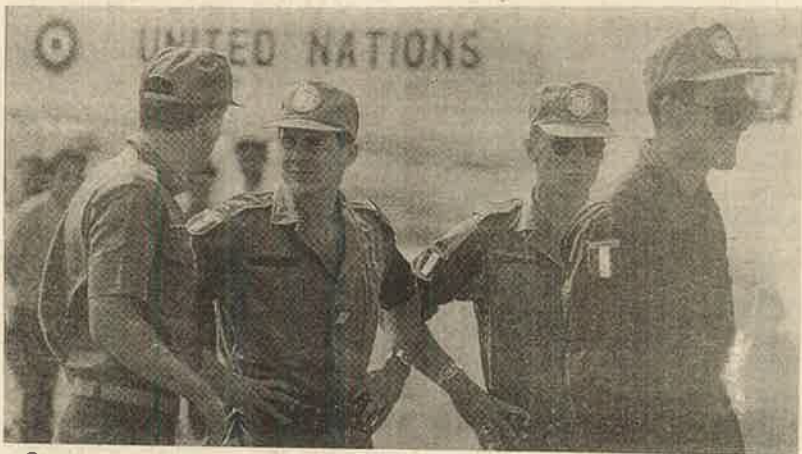
மோசடித் தேர்தல் நடத்தி பொம்மையாட்சியை நிறுவ வந்துள்ள ஐ.நா. 'அமைதிப் படை'

அமைதி ஒப்பந்தப்படி உருவாக்கப்பட்ட கம்பூச்சிய தேசிய கவுன்சிலின் தலைவராக முன்னாள் அரசர் சிகானுக் ஏகமனதாகத் தேர்வு செய்யப்பட்டார். அரசர் சிகானுக் அமெரிக்க ஆக்கிரமிப்பாளர்களால் ஆட்சியிலிருந்து தூக்கியெறியப்பட்ட போது, தமது விகவாசப் படைகளைக் கொண்டு தேச விடுதலைப் போராட்டத்தை மேற்கொண்டார். நாடு விடுதலையடைந்த பின்னர் வியட்நாமிய கூலிப் படைகள் ஆக்கிரமித்த போதும் அதற்கெதிராகப் போராடிவந்தார். கம்பூச்சியாவின் அமைதிக்கும் ஜனநாயகத்துக்கும் பலமுறை பேச்சுவார்த்தைகளில் ஊக்கமாகப் பங்கேற்ற தேசியவாதியான சிகானுக், கம்பூச்சிய மக்களிடம்