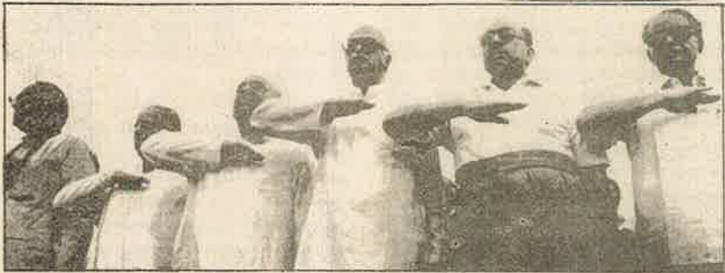
அன்மையில் ஆர். எஸ். எஸ். தடை நீக்கப்பட்டதும் பாசிச வணக்கம் செலுத்தி மிகுகின்றனர்

"கம்யூனிசத்தின்பால் இந்திய இளைஞர்கள் தீவிரமாக ஈர்க்கப்படுகின்றனர். அதைத் தடுப்பதற்கான சக்தியாக இருந்த ஆர். எஸ். எஸ். இப்போது இல்லை என்பதுதான் காரணம். இந்த ஆபத்தை எதிர்க்கும் போராடுவதில் கலாச்சார அடிப்படையில் ஆர். எஸ். எஸ். உதவும். காங்கிரசு அதிகாரத்திலும், ஆர். எஸ். எஸ். அமைப்பு ரீதியிலான கலாச்சார சக்தியாகவும் இருப்பதால் அவை இணைந்து இந்த (கம்யூனிச)