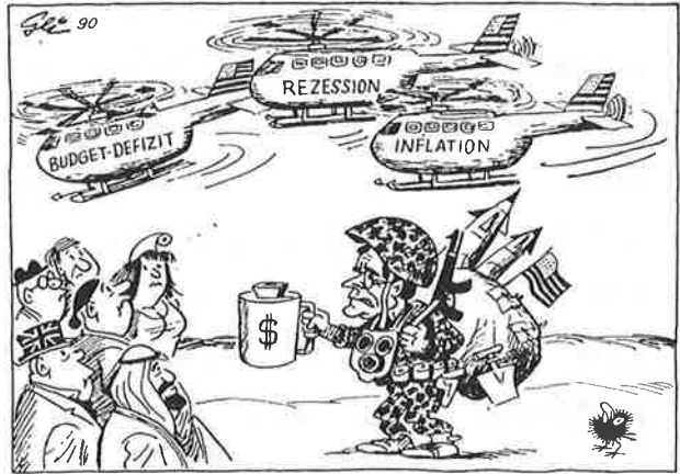
(Karikatur H. Geisen)

விளைகுடாமிற்குள் அதிகமாக படைகளை குவிற்திருக்கும் அமெரிக்கா தனது இராணுவ ஷலவீனங்களை கூட்டு நாடுகளையும் ஸங்கீடு ஷய்யும்பு கேட்டதைத் திதாலாந்து கூட்டு நாடுகள்