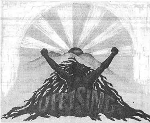
சுமந்துல்: திசுவா (சுணல்)