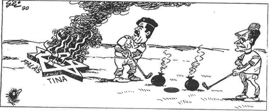
(Karikatur: H. Geisen)

வீணா குடாவின்து அப்படி என்னதான் பீடை பிடித்திருக்கோ ? மீண்டும் யுத்தத்திற்காய் அருட்டப்பட்டுவிட்டது.