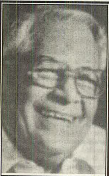
முன்னாள் ஜனாதிபதி ஆர். வெங்கட்ராமன்

திரு. வெங்கட்ராமன் அவர்கள் தனது பேச்சில் மேலும் இரு விடயங்களைக் கட்டிக் காட்டினார். முதலாவதாக, "இந்தியப் பிராந்தியத்தில் உள்ள ஏனைய நாடுகள் தம்மைத்தாமே நிர்வகிப்பதற்கு முடியாதவாறு வறுமைப்பட்டவையாகவும், சிறிய நாடுகளாகவும் இருப்பதால் இப்பிராந்தியத்தில் உள்ள ஏனைய நாடுகள் தம்மைப் பாதுகாத்துக் கொள்ள இந்தியாவின் உதவியை எதிர்பார்த்து நிற்கின்றன" என்பதாகும்.