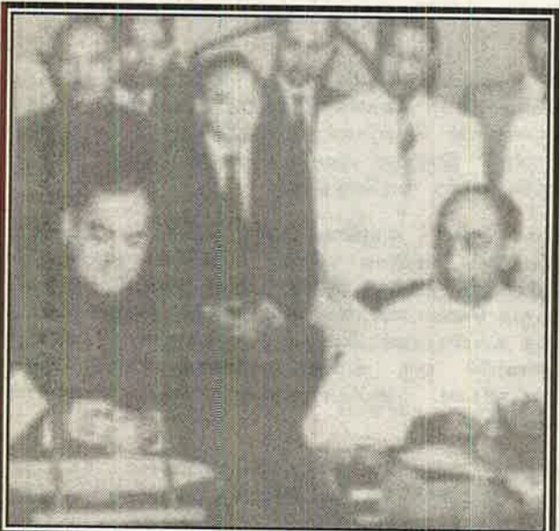
இலங்கை - இந்திய ஒப்பந்தம்

இதேசமயம், திரு. வெங்கட்ராமன் அவர்கள், பொதுப்படையாக இந்து சமுத்திரச் சமாதானப் பிராந்தியச் சிறிய நாடுகள் பற்றிக்