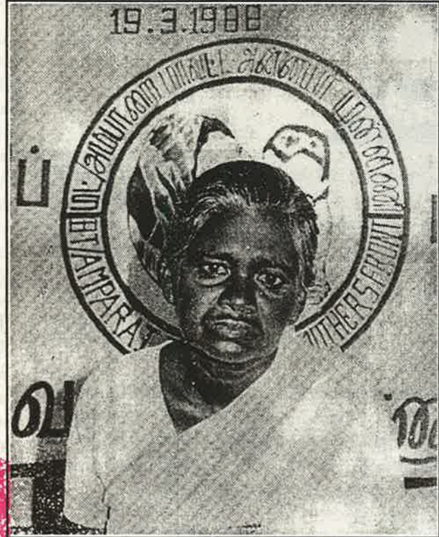
ஈழத்தமிழரின் இதயங்களில் வேரோடி விட்ட ஆல விருட்சம்

திலீபன் கூட்டிய போராட்டப் பாதை. சாகும்வரை உண்ணாவிரதம். ஐந்து அம்சக்கோரிக்கைகளை முன்வைத்து உண்ணாவிரதம் தொடங்கினார்கள்திலீபன். புலிகளுக்கு ஆதரவாக இரண்டு அம்சக்கோரிக்கையை முன்வைத்தனர் அன்னையர்கள். திலீபன் விரும்பிய மக்கள் புரட்சி. தென்தமிழ்மீழ்த்தில் அன்னையர் எழுச்சியாக வெடித்தது. சுழற்சிமுறைத் தொடர் உண்ணாவிரதத்தை, சாகும்வரை உண்ணாவிரதமாகக் கடைப்பிடிப்பதென அன்னையர் முடிவெடுத்தனர்.