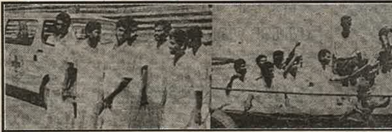
விடுவிக்கப்பட்ட யுத்தக் கைதிகள்