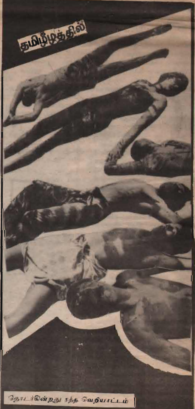
தோழர்கின்றது சந்த வெறியாட்டம்