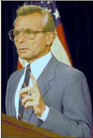
லுமும்பாவை கொல்ல சதி தீட்டிய சி.ஐ.ஏ.வின் ஃபிராங் கார்லூசி.

தே.கா.இ ஒரு அமைதியான ஆட்சி மாற்றத்தையே எதிர்நோக்கியது. காலனியவாதிகளின் படைகளை எதிர் கொள்ளத்தக்க தனக்கான ஆயுதப் படைகளை உருவாக்க தே.கா.இ முயற்சிகள் எடுக்கவில்லை. தே.கா.இ-யின் அதிகரிக்கும் பலத்தைக் கண்டு அஞ்சிய பெல்ஜிய ஏகாதிபத்தியவாதிகள், 'சுதந்திரம்' வழங்குவதற்கான தமது நிகழ்ச்சி நிரலை விரைவுபடுத்தினர். 1960-ஆம் ஆண்டு, ஜூலை 30-ஆம் நாள், புதிய சுதந்திரமான காங்கோ அரசு பொறுப்பேற்றது. தேர்தலில் அதிக வாக்கு எண்ணிக்கைகள் பெற்ற தே.கா.இ ஆட்சியை மைத்தது. லுமும்பா நாட்டின் பிரதமராகி, ஆட்சிப் பொறுப்பில் இரண்டாம் இடத்தை வகித்தார்.