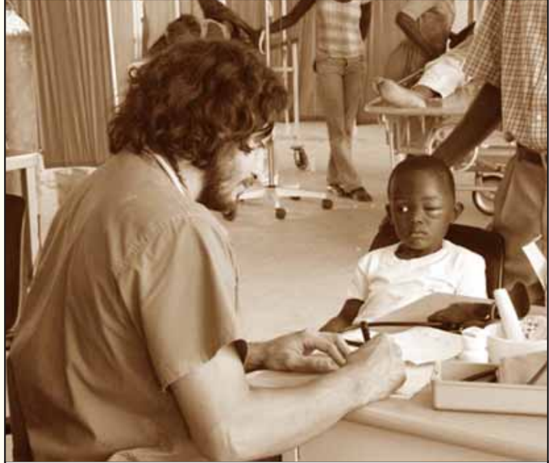
ஹைத்தி தீவு மக்களுக்கு சிகிச்சை அளிக்கும் கியூபாவின் மருத்துவர்.

“கூபாவில் குறைந்த அளவு மட்டுமே ஊதியம் பெறும் இம்மருத்துவர்கள் இந்தக் குழுக்களுடன் பயணிப்பதன் மூலம் அதிகமான ஊதியம் கிட்டுவதுடன், தாங்கள் படித்த நோய்களைப் பற்றி மேலும் தெரிந்து கொண்டு, அதைத் தடுக்கும் வழிமுறைகளில் அவர்கள் ஈடுபடவும் உதவுகின்றது. அதிபர் பிட