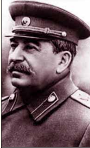
மிக நெருக்கடியான காலகட்டத்தில் ஒரு மாபெரும் தேசத்தை வழிநடத்திய ஸ்டாலினின் சமகாலத்தில் இந்த மன்னன் திக்குவாயை சரி செய்ததற்காக போற்றப்படுகிறான்!

என்ன இருந்தாலும் இது ஆண்டைகள் எழுதிய வரலாறு அல்லவா, அப்படித்தான் இருக்கும். சரி, கொந்தளிப்பான காலகட்டத்தில் ஒரு மன்னன் எப்படி எதிர்வினையாற்றுகிறான் என்பதை விடவா அந்தப் பேச்சுப் பிரச்சினை முக்கியமானது? இதை வைத்தே இவர்கள் ஒரு மாபெரும் வரலாற்றுப் படத்தை