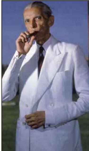
மு லீம் லீக் நிறுவனர் ஜின்னா: பிரிவினையை முதலில் பேசியது இந்து மகாசபைதான், மு லீம் லீக் அல்ல.

ஆர்.எஸ்.எஸ் அமைப்பை ஹெட்கேவார் ஆரம்பிக்க என்ன காரணம்?