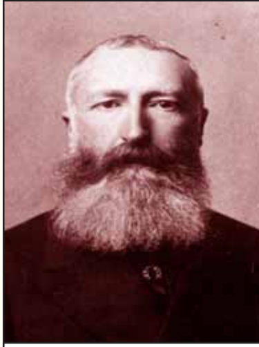
பெல்ஜியத்தை விட 80 மடங்கு பெரிதான காங்கோவை களவாடிய பெல்ஜிய மன்னன் 2-ஆம் லியோபோல்ட்.

உண்மையான அதிகாரத்தையும், பொருளாதார வாழ்வையும் அன்னிய ஏகாதிபத்தியக் கட்டுப்பாட்டில் வைக்கும் ஒரு பெயரளவு போலி சுதந்திரத்தை வழங்கும் நவ காலனியத்தின் மூலம் காலனியத்தின் முகத்தை மாற்றியமைப்பதுவே அவர்களின் திட்டமாக இருந்தது. சின்னஞ்சிறிய பெல்ஜிய ஏகாதிபத்தியம், தனது திட்டங்களை நிறை