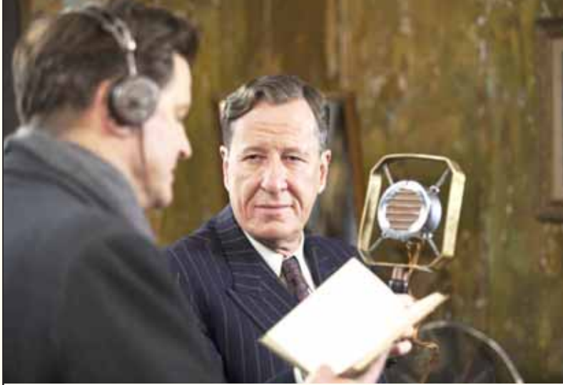
ஆறாம் ஜார்ஜ் மன்னனுக்கு பயிற்சி அளிக்கும் பேச் பயிற்சி நிபுணர். என்ன ஒரு வரலாற்றுக் கண்டுபிடிப்பு!

கணக்காளனார் குழுமியிருக்கும் அந்த மைதானத்தில் இளவரசரால் சரளமாகப் பேச முடியவில்லை. ஆம். அவர் ஒரு திக்கு வாய் மனிதர்.