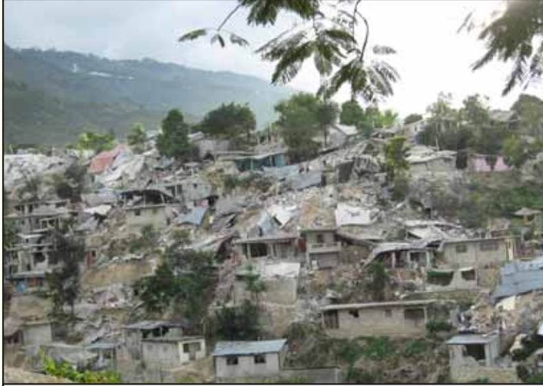
நிலநடுக்கத்தால் சீர்குலைந்து போன ஹைத்தி தீவு.

கான கூட்டமைப்பின் புள்ளிவிவரங்கள் தெரிவிக்கின்றன.