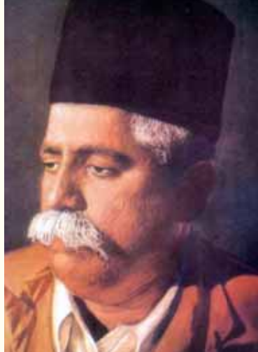
பார்ப்பனிய மீட்சிக்காக 1925-இல் ஆர்.எஸ்.எஸ்.ஐ ஆரம்பித்த ஹெட்கேவார்.

வடஇந்தியாவில் குமாஸ்தாக்களை உருவாக்கும் ஆங்கிலேயக் கல்விமுறையின் பரவலால் ஓடுக்கப்பட்ட மக்கள் ஓரிருவர் முன்னேறியதைப் பார்த்து தமது அஸ்திவாரத்தில் லேசான ஆட்டம் கண்டு போயிருந்த வருணாசிரம இந்து தரும் ஆதிக்கத்தைக் காப்பாற்றவும், சமஸ்கிருதத்தை மீண்டும் உயிர்த்தெழவைக்கும் நோக்கத்திற்காகவும் ஜமீன் தாரர்கள், நிலப்பிரபுக்களிடம் நன்