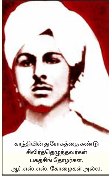
காந்தியின் துரோகத்தை கண்டு சிலிர்த்தெழுந்தவர்கள் பகத்சிங் தோழர்கள். ஆர்.எஸ்.எஸ். கோழைகள் அல்ல.

இப்படி இந்துத்துவ வாதிகளின் கூடாரமாய் காங்கிரசு சீரழிந்து கிடந்த நிலையில் அதற்கான எதிர்வினையாக வேறு வழியின்றி தோன்றியது தான் முசுலிம் லீக். ஆங்கிலேயர்களும் இந்த முரண்பாட்டைத் திறமையாகப் பயன்படுத்தி அதனை முற்ற வைத்தார்கள். முசுலிம் லீக் அதன் துவக்க காலத்தில் தேசப் பிரிவினையை செயல் திட்டமாகக் கொண்டிருக்கவில்லை. முசுலிம்களைக் கல்வியறிவு பெறச் செய்வது, மாகாண அரசுகளில் போதிய பிரதிநிதித்துவத்தைக் கோரிப் பெறுவது போன்றவைகளையே அதன் தலைவர்கள் முன் வைத்தனர். ஆங்கிலேய ஏகாதிபத்தியத் தோடு சமரசமாகச் சென்று சில சில்லறைக் கோரிக்கைகளை நிறைவேற்றிக் கொள்வது எனும் அளவில் காங்கிரசின் இசுலாமியப் பிரதி தான் முசுலிம் லீக்.