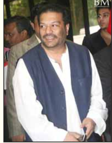
சோ, பர்காதத், வீர் சங்வி: பத்திரிகையாளர்கள் என்ற பெயரில் தரகு வேலை பார்க்கும் மோசடி கண்ணியவான்கள்!