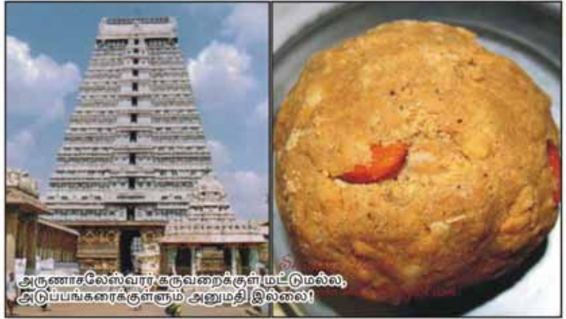
அருணாசலேஸ்வரர் கருவறைக்குள் மட்டுமல்ல, அடுப்பங்கரைக்குள்ளும் அனுமதி இல்லை!

"சூத்திரநாயே! ஒரு வட்டு பிடிக்கக் கூட உனக்கு அனுமதியில்லை. இந்த வட்சணத்தில் உனக்கு அர்ச்சகர் வேலை கேக்குதா?" என்று பகிரங்கமாக இழிவுபடுத்தும் பார்ப்பனக் கொழுப்பை, அநீதியை எதிர்த்துக் கேட்காமல், பார்ப்பான் கையாலேயே தீர்த்தமும், வட்டும் வாங்கித் திண்பவன் தளைப் பிண்டமின்றி வேறென்ன? மான உணர்ச்சியோடு வட்டு தின்ன ஆசைப்படுபவர்கள் போராளும் அந்த மாணவர்களோடு தோள் நிற்பதுதான் ஆண்டவனுக்கே கூட அடுக்கும்.