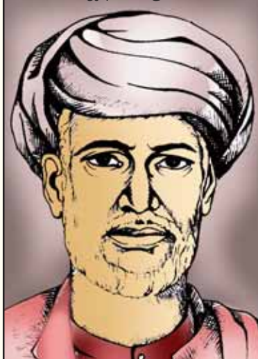
19-ஆம் -நாண்டில் பார்ப்பனிய ஆதிக்கத்தை எதிர்த்துப் போராடிய ஜோதிராவ் பூலே.

அதைத் தொடர்ந்து 19ஆம் -நாண்டில் ஜோதிராவ் பூலே வருகிறார். வேதத்தை மறுத்து, பார்ப்பனர்களின் மேலாண்மையை எதிர்த்து, சூத்திர பஞ்சமர்களின் சம உரிமைக்காக அயராது பாடுபடுகிறார். இதுவும் ஒடுக்கப்பட்ட மக்களிடம் பெரும் எழுச்சியை ஏற்படுத்துகிறது. ஏற்கெனவே ஆட்சியிழந்த பார்ப்பனர்கள் இதனால் மேலும் வயிறெறிந்து போகிறார்கள்.