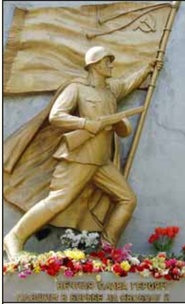
ஜெர்மனியின் பாசிசத்தை வேரறுக்க 2 கோடி மக்களை இழந்து போரிட்டது சோவியத் யூனியன். இந்த வரலாற்றுக் காலத்தில்தான் 6-ஆம் ஜார்ஜ் மன்னன் பேச்சுக்காக போராடுகிறான்!

இணையத்தில் ஆளாளுக்கு போகிற போக்கில் ஸ்டாலின் மக்களைக் கொலை செய்தார், மாவோ கலையைக் கொலை செய்தார் என்று கூசாமல் புளுகுவது இருக்கட்டும். இவையே எத்தனை நாவல்களாக, திரைப்படங்களாக வந்திருக்கின்றன. கம்ப்யூனிஸ்டுகளை இழிவுபடுத்தும் அமெரிக்காவின் இந்தப் பூசைகளுக்கெல்லாம் யாரும் அனுமதி பெறவில்லை. அது குறித்து யாரும் கவலையும் படவில்லை. ஆனால் ஒரு அம்மாஞ்சி அரசன் பேசுவதற்கு சிரமப்பட்டான் என்ற ஒரு அக்கப் போரை மேற்குலகின் ஜனநாயகம் கதையாக எடுப்பதற்கு அனுமதி கிடைக்கவில்லை என்றால் அதனை என்ன வென்று சொல்ல? அதுவும் இந்த மாபெரும் வரலாற்று உண்மையை அந்த அரசி அம்மா இறந்த பிறகுதான் படமாக எடுத்திருக்கிறார்கள் என்றால் இவர்களது பேச்சுச் சுதந்திரத்தின் யோக்