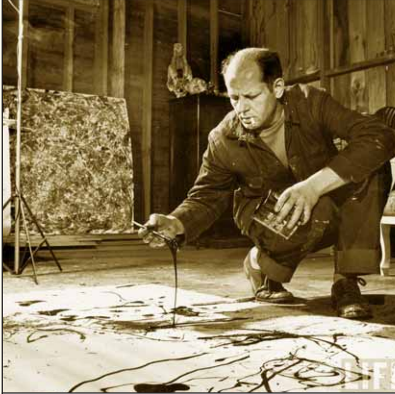
சி.ஐ.ஏ. கா கொடுக்கிறது! போலக் 'படம்' வரைகிறார்!

எிடம் பெற்ற நன்கொடைகளிலிருந்தும் இத்தகைய கண்காட்சிகளை நடத்தியது.