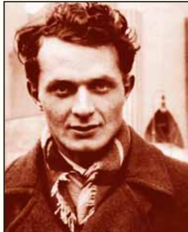
சி.ஐ.ஏ. ஊட்டி வளர்த்த கவிஞர் ஸ்டீபன் ஸ்பென்டர்தான் என்கவுண்டரின் ஆசிரியர்.

காக படைப்பூக்கத்துடன் செயல்பட்ட படைப்பாளிகளை அடிமைகள் என்று முத்திரை குத்தி குற்றம் சாட்டினர்.