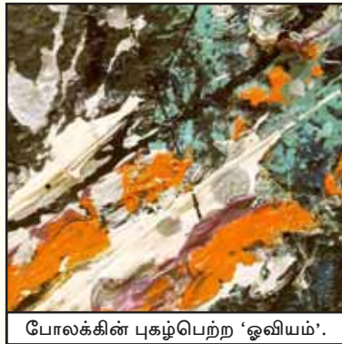
போலக்கின் புகழ்பெற்ற 'ஓவியம்'.

“எது சிறந்த பிரச்சாரமாக அமையும் என்பதை சி.ஐ.ஏ வரையறுத்துள்ள