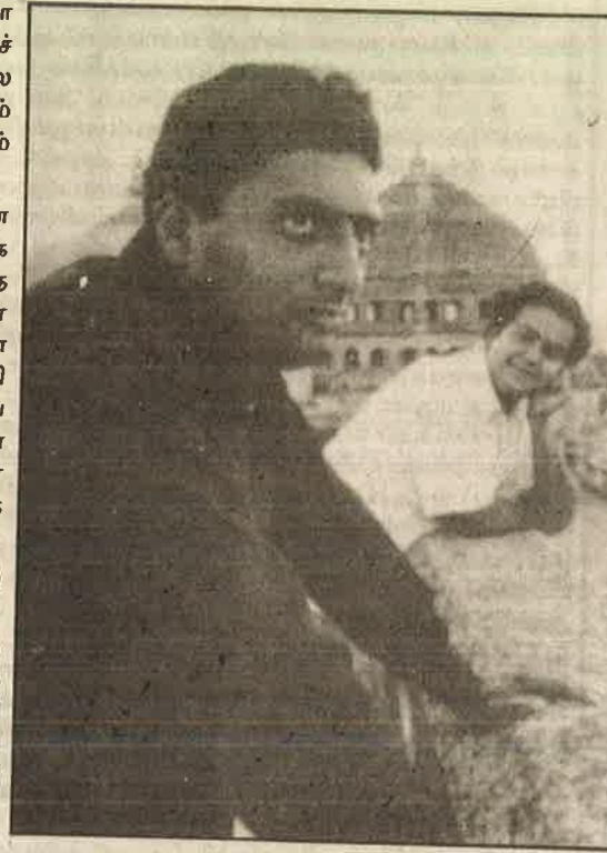
விற்பனையில் திராவிட இயக்கம்:

எம்.ஜி. ராமச்சந்திரனின் ‘அனைத்து’ விவகாரங்களுக்கும் கணக்கப்பிள்ளையாக இருந்த (இதை விட கவுரவமாக இவரை அறிமுகப்படுத்த முடியாது) ஆர்.எம். வீரப்பன் தமிழ்நாட்டினுடைய எதிர்காலத்தின்