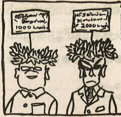
“களப் பணியில்” செயல்பட்டு வரும் தன்னார்வக் குழுக்களுக்கு ‘ஆய்வுப் பணியில்’ தங்களை விற்றுக்கொள்ளும் ஆய்வாளர்கள். ஏகாதிபத்தியத்தின் செல்லக் குழந்தைகள்.

80 நாடுகளின் அரசு சாரா நிறுவனங்களுக்குப் பல ஆயிரம் கோடி நிதியுதவி செய்து, "பசி, உலக வறுமையின்