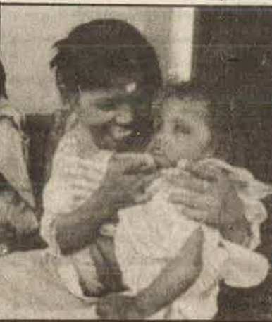
16 வயது நூடன், தனது 14 மாதக் குழந்தையுடன். தாயும், சேயும் எய்ட்ஸ் நோயாளிகளாக - உதவும் கரங்களின் கருணாலயத்தில்.

சிகரெட் பெட்டியில், "புகை உடல்நலத்திற்கு தீங்கு" என்று எழுதி வியாபாரம் செய்வதுபோல, மதுப்புட்டியில் "குடும்பத்தைக் கெடுக்கும்" என்று எழுதி வியாபாரம் செய்வது போல "எய்ட்ஸை தடுக்க நிரோத்