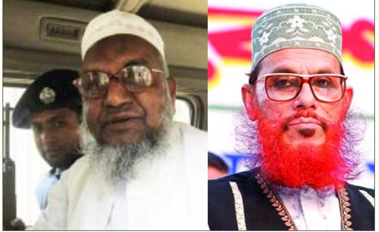
தண்டிக்கப்பட்ட போர்க்குற்றவாளிகள்: “மீர்பூரின் கசாப்புக்கடைக்காரன்” என்று மக்களால் காறி உமிழப்படும் ஜமாத் கட்சியின் முக்கிய தலைவரான அப்துல் காதர் மொல்லா (இடது). மரண தண்டனை விதிக்கப்பட்டுள்ள ஜமாத் கட்சியின் துணைத் தலைவர் தெல்வார் ஹுசைன் சயீதி.

இருப்பினும், இந்த அச்சுறுத்தல்களால் மக்களின் போராட்டத்தைத் தடுக்க முடியவில்லை. ஜமாத் கட்சியின் வர்த்தக அமைப்புகளான இஸ்லாமி வங்கி, ஐ.பி.என். சினா உள்ளிட்ட இதர நிறுவனங்களையும், டிகந்தா தொலைக்காட்சி, நயா டிகந்தா தினசரி, அமர் தேஷ், சங்க் ராம் நாளேடு, சோனார்பங்களா வலைத்தளம் உள்ளிட்ட ஊடகங்களையும், ஜமாத் கட்சியின் கல்வி மற்றும் கலாச் சார நிறுவனங்களையும் தடை செய்யுமாறும், ராசாக்கர்கள் - அல் பதார் குண்டர்களின் சொத்துக்களைப் பறிமுதல் செய்து அவர்களைத் தண்டிக்கக் கோரியும் வங்கதேச மக்கள் போராட்டங்களை முன்னெடுத்துச் சென்றனர். பிப்ரவரி 28 அன்று போர்க்குற்ற விசாரணை நீதிமன்றம் ஜமாத் இ இஸ்லாமியின் துணைத் தலைவரான தெல்வார் ஹுசைன் சயீதிக்கு மரணதண்டனை