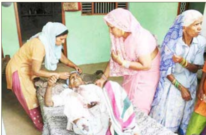
தமது விளைநிலங்கள் அபகரிக்கப்படுவதை எதிர்த்துப் போராடிய உ.பி.நொய்டா பகுதியைச் சேர்ந்த விவசாயிகள் மீது நடத்தப்பட்ட துப்பாக்கிச் சூட்டில் படுகாயமடைந்த விவசாயி. (கோப்புப் படம்)

இம்மசோதாவில் தப்பித்தவறிக்கூட கார்ப்பரேட் நிறுவனங்களுக்குப் பாதகமான அம்சங்கள் இருந்துவிடக் கூடாது என்பதற்காகவே, சுற்றுப்புறச் சூழல் அமைச்சராக இருந்த பொழுது பன்னாட்டு விதைக் கழகங்களின் கைத்தடியாக நடந்துகொண்டு பி.டி. கத்திரிக்காய்க்கு ஆதரவாக வாதாடிய ஜெய்ராம் ரமேஷ்; விவசாயிகளைப் பற்றிக் கிஞ்சித்தும் அக்கறை காட்டாத சரத் பவார் ஆகி