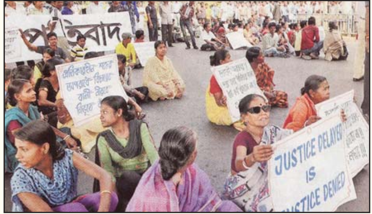
கெல்கத்தாவின் பூங்காதெரு பகுதியில் ஒரு பெண்ணை கும்பல் பாலியல் வல்லுறவுக்கு ஆளாக்கிய குற்றவாளிகள் மீது தாமதமின்றி விசாரணை நடத்தி தண்டிக்கக் கோரி பெண்கள் நடத்தும் ஆர்ப்பாட்டம்.

டெல்லியில் நடந்த வல்லுறவுக் கொலைக்குப் பின்னர் அமைக்கப்பட்ட வர்மாகமிசனின் பரிந்துரைகளை நீர்த்துப் போக வைத்துவிட்டு, ஒரு அவசரச் சட்டத்தை அரசு பிறப்பித்தது. வர்மாகமிசனின் அறிக்கையின் அடிப்படையில் ஒரு மசோதாவைத் தயாரித்து, அதை நாடாளுமன்றத்தில் விவாதித்துச் சட்டமாக்கி, பின்னர் அரசுத் தலைவரின் ஒப்புதலைப் பெற்று இச்சட்டத்தை அமலாக்க வேண்டுமென்பதால், இடைக்காலத்தில் குற்றவாளிகள் தப்பிவிடக்கூடாது என்பதற்காக இந்த அவசரச் சட்டத்தைக் கொண்டு வந்துள்ளதாக அரசு அறிவித்தது.