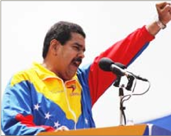
வெனிசுலாவின் புதிய அதிபராகத் தேர்ந்தெடுக்கப்பட்டுள்ள சாவேஸின் உற்ற தோழர் நிக்கோலஸ் மாதுரோ.

வின் எண்ணெய், எரிவாயுவை கியூபாவுக்கும் பிற தென் அமெரிக்க நாடுகளுக்கும் மலிவு விலையில் வழங்கியது — போன்றவையெல்லாம் மிகவும் குறுகிய காலத்தில் சாவேஸ் நிகழ்த்திய சாதனைகள்.