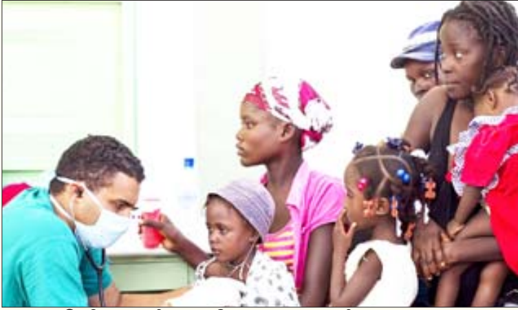
இந்தியா உள்ளிட்ட பல்வேறு ஏழை நாடுகளில் மருத்துவமும், பொது சுகாதாரமும் தனியார் வசம் ஒப்படைக்கப்பட்டு வரும் வேளையில், சாவேஸ் அச்சேவைகளைத் தேசியமயமாக்கினார். கியூபா நாட்டைச் சேர்ந்த மருத்துவர்களால் பரிசோதிக்கப்படும் வெனிசுலாவின் ஏழைக் குழந்தைகள். (கோப்புப் படம்.)

ஏழை, எளிய உழைக்கும் மக்கள் மீது இயல்பிலேயே அவரிடம் ததும்பிய நேசத்தையும், உண்மையான அக்கறையையும் அவரது எதிரிகள்கூட மறுக்க முடிந்த தில்லை. சாவேஸ் மக்களுடன் நேருக்குநேர் உரையாடி, அவர்கள் கேள்விகளுக்குப் பதிலளிக்கும் ‘ஹலோ பிரசிடென்ட்’ என்ற தொலைக்காட்சி நிகழ்ச்சி இதற்கு சான்றாக அமைந்தது.