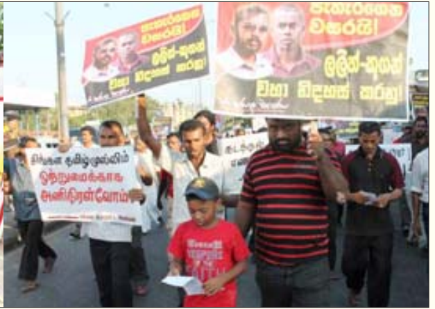
யாழ்ப்பாணம் ஊர்க்கைப் பிழைப்பு மாணவர்கள் சிங்கள இராணுவத்தால் தாக்கப்பட்டதைக் கண்டித்து, கண்டிப் பேராதனைப் பல்கலைக்கழக மாணவர் ஒன்றியத்தால் நடத்தப்பட்ட ஆர்ப்பாட்டம் (இடது); மற்றும் இன ஒற்றுமையை வலியுறுத்தி கிழக்கு இலங்கைப் பகுதியில் நடந்த ஊர்வலம்.

ஈழத்தமிழினத்துக்கெதிராக அது இழைத்த குற்றங்களுக்குக் காக “பாவமன்னிப்பும் பரிசாரமும்” தேடும் நிலைக்குத் தள்ளப்பட வேண்டும்.