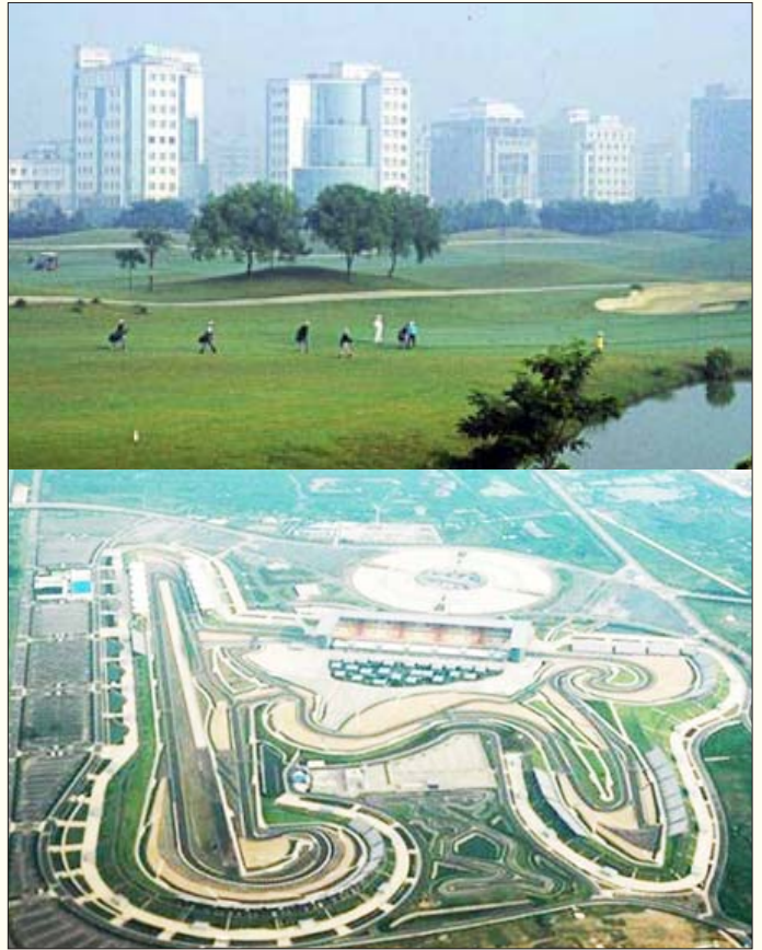
உ.பி.மாநில நொய்டா பகுதியில் விளைநிலங்களை வளைத்து, மேட்டுக்குடிக் கும்பலின் களிவெறியாட்டத்திற்காகக் கட்டப்பட்டுள்ள கோல்ஃப் மைதானம் (மேல்படம்) மற்றும் 875 ஏக்கர் பரப்பளவில் அமைந்துள்ள எஃப்-1 கார் பந்தய மைதானம்.

விவசாயிகளைக் கிராமப்புறங்களிலிருந்து அப்புறப்படுத்துவதன் மூலம், கார்ப்பரேட் கும்பலுக்கு அடிமாட்டு விலைக்கு நிலம் கிடைப்பது மட்டும் உறுதி செய்யப்படவில்லை. இதன் மூலம் வேலை தேடி நகரங்களுக்கும்; தமிழ்நாடு, மகாராஷ்டிரா, டெல்லி போன்ற ‘வளர்ந்து’ வரும் மாநிலங்களுக்கும் ஓடிவரும் விவசாயிகளைக் கொண்டு ஒரு பெரும் ரிசர்வ் தொழிலாளர் பட்டாளமும் உருவாக்கப்படுகிறது. இப்படி ஒரு ரிசர்வ் பட்டாளத்தை உருவாக்குவதன் மூலம், மிகவும் குறைவான கூலிக்குத் தொழிலாளர்களை வேலைக்கு அமர்த்திக் கொள்ளும் வாய்ப்பு முதலாளிகளுக்கு உருவாக்கித் தரப்படுகிறது. இத்தகைய நில அபகரிப்பும் உழைப்புச் சுரண்டலும்தான் இந்தியத் தரகு முதலாளி