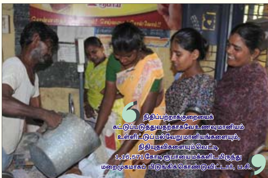
நிதிப் பற்றாக்குறையைக் கட்டுப்படுத்துவதற்காகவே உணவு மானியம் உள்ளிட்ட பல்வேறு மானியங்களையும், நிதியுதவிகளையும் வெட்டி 1,16,571 கோடி ரூபாயை மக்களிடமிருந்து மறைமுகமாகப் பிடுங்கிக்கொண்டு விட்டார், ப.சி.

உலகமயம் இந்தியாவைப் பொருளாதார வல்லரசாக மாற்றிவிடும் என ஆளும் கும்பல் கூறி வந்த சர்டுகளையெல்லாம் இந்தத் தேக்கவீக்கம் வெளுத்துப் போகச் செய்து விட்டதை இன்று யாராலும் மறைக்க முடியவில்லை. “பொருளாதாரத் தேக்கம், விலைவாசி உயர்வு, நடப்புக் கணக்குப் பற்றாக்குறை ஆகியவைதான் நாம் தற்பொழுது எதிர்கொண்டுள்ள பிரச்சினைகள்” எனத் தனது பட்ஜெட் உரையில் குறிப்பிட்டுள்ள ப.சிதம்பரம், இதிலிருந்து நம்மைக் காப்பாற்ற அந்நிய மூலதனத்திடம் சரணடைவதைத் தவிர வேறு