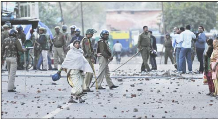
டெல்லி மங்கோல்புரியில் 7 வயது சிறுமி பாலியல் பலாத்காரம் செய்யப்பட்டதை எதிர்த்து பகுதிவாழ் உழைக்கும் மக்கள் நடத்திய ஆர்ப்பாட்டம் - போலீசின் அடக்குமுறை ஓய்ந்த பின்னர் காணப்பட்ட போர்க்களம்

கடந்த மார்ச் 15 அன்று ம.பி.யில் சுற்றுலாப் பயணிகளான சவிட்சர்லாந்து நாட்டைச் சேர்ந்த கணவனும் மனைவியும் சைக்கிளில் பல இடங்களைச் சுற்றிப் பார்த்துவிட்டு, இரவில் காட்டுப்பகுதியில் ஓய்வெடுத்தபோது, அங்கு ஒரு கும்பல்