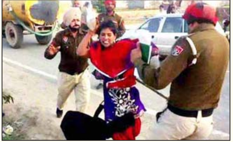
பாலியல் தொல்லை கொடுத்தவனிடம் மாமூல் வாங்கிக் கொண்டு, புகார் கொடுத்த பெண்ணையே தாக்கும் பஞ்சாப் போலீசு.

தனது கைபேசி காமிராவில் பதிவு செய்து, அதனை ஊடகங்களுக்குத் தெரியப்படுத்தினார். இந்த வீடியோ, தொலைக்காட்சிகளிலும் நாளேடுகளிலும் வெளியாகி பரபரப்பானதைத் தொடர்ந்து இத்தாக்குதலை நடத்திய 4 பொறுக்கி போலீசாரும் தற்காலிகப் பணிநீக்கம் செய்யப்பட்டுள்ளனர். ஆனால், மாவட்டப் போலீசு தலைமைக் கண்காணிப்பாளரோ, அப்பெண்ணின் தந்தை குடித்து விட்டுத் தகராறு செய்ததாகவும், அதைத் தடுக்க முயற்சித்த போலீசாரை அப்பெண்தடுத்தால் அடித்ததாகவும் நியாயவாதம் பேசுகிரிமினல் போலீசுக்கு வக்காலத்து வாங்குகிறார். பெண்களுக்கான பாதுகாப்பை மேம்படுத்த சட்டத்தை மேலும் கடுமையாக்கி, தண்டனையை அதிகரிப்பதும்,