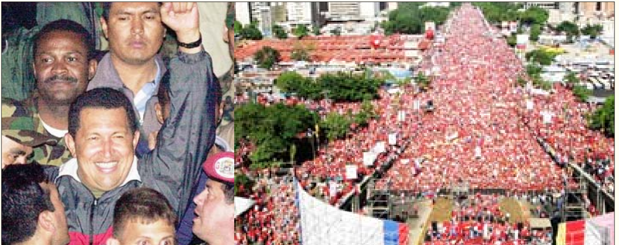
அமெரிக்க ஆதரவுடன் நடந்த ஆட்சிக் கவிழ்ப்பை எதிர்த்து வெனிசுலா மக்கள் கார்கல் நகரில் நடத்திய ஆர்ப்பாட்ட ஊர்வலம் (இடது); வெனிசுலா இராணுவத்தால் கைது செய்யப்பட்டிருந்த சாவேஸ், மக்களின் போராட்டத்தை யடுத்து விடுதலை செய்யப்படுகிறார். (கோப்புப் படம்)

எண்ணெய், மின்சாரம், தொலைபேசி, சிமெண்டு உற்பத்தி உள்ளிட்ட கேந்திரத் தொழில்துறைகளை பொதுச் சொத்தாக்குவது, மற்ற தென் அமெரிக்க நாடுகள் மற்றும் ஆசிய ஆப்பிரிக்க நாடுகளுடனான வணிகத்துக்கு முதன்மை முக்கியத்துவம் கொடுப்பதன் மூலம் வணிகத்துக்கு அமெரிக்க-ஐரோப்பிய ஏகாதிபத்தியங்களைச் சார்ந்திருப்பதிலிருந்து விடுவிப்பது, தென் அமெரிக்காவைத் தனது சுதந்திர வர்த்தக வலையத்துக்குள் கொண்டு வர முயன்ற அமெரிக்காவின் சதியை முறியடித்து, தென் அமெரிக்கக் கண்டத்தின் நாடுகளுக்கான தனி வர்த்தக வலையத்தை உருவாக்கியது, உலக வங்கிக்குப் போட்டியாக தென் அமெரிக்க நாடுகளுக்கான ஒரு பொது வங்கியை உருவாக்கியது, தேசிய எல்லைகளைக் கடந்து தென் அமெரிக்கக் கண்டம் என்ற முறையில் ஏகாதிபத்தியச் சுரண்டலுக்கு எதிராக நாடுகளை ஒன்றுபடுத்தியது, வணிகம்-இலாபம் என்ற முதலாளித்துவ அளவுகோல்களை நிராகரித்து வெனிசுலா