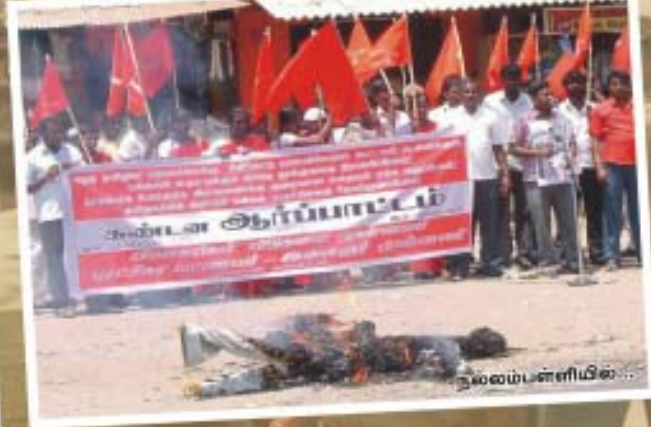
நூரம்பர்க் போன்ற போர்க்குற்ற விசாரணை