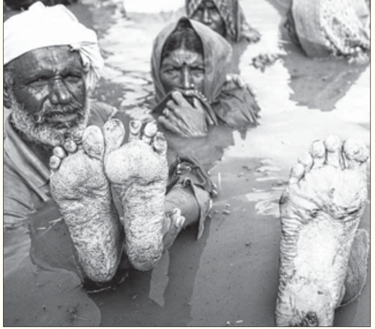
மத்தியப் பிரதேச மாநிலத்தில் நர்மதா ஆற்றின் குறுக்கே கட்டப்பட்டுவரும் இந்திரா சாகர் அணைக்கட்டின் உயரத்தைக் குறைக்கக் கோரி, ஹர்தா மாவட்டத்தைச் சேர்ந்த விவசாயிகள் நடத்திய “ஜல் சத்யாகிரக”ப் போராட்டம். (கோப்பு படம்)

நிலம் கையகப்படுத்துவதற்கு எதிராக நடந்துவரும் இத்தகைய போராட்டங்களால் 5 இலட்சம் கோடி ரூபாய் மதிப்பு கொண்ட திட்டங்கள் நடைமுறைப்படுத்த முடியாமல் கிடப்பில் இருப்பதாக ஆளும் கும்பலும் அவர்களது எடுபிடிகளும் புலம்பி வருகின்றனர். இந்த தேக்க நிலையை உடைக்க விவசாயிகளின் நலனைப் பாதுகாக்கும் விதத்தில் நிலம் கையகப்படுத்தும் சட்டத்தை திருத்தப் போவதாக அறிவித்தது, காங்கிரசு கூட்டணி அரசு.