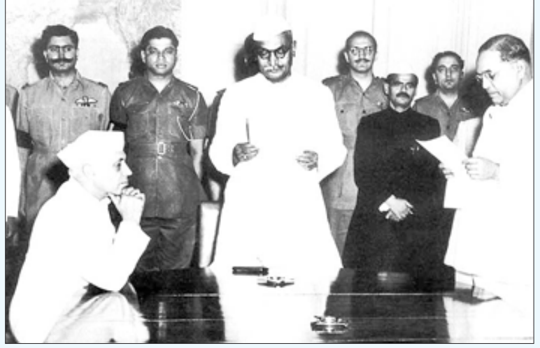
அம்பேத்கர், நேரு அரசில் சட்டத்துறை அமைச்சராகப் பதவிப் பிரமாணம் எடுத்துக் கொள்கிறார். (கோப்புப் படம்)

ஆனால், தீண்டத்தகாதவர்களாக ஒதுக்கி வைக்கப்பட்டு, அதிகரித்த அளவில் வன்கொடுமைத் தாக்குதல்களுக்கு இலக்காகி வரும் தாழ்த்தப்பட்ட மக்கள் ஒரு சமூகம் என்ற முறையில் சமத்துவம், விடுதலை என்பதை நோக்கி ஒரு சிறு அளவுகூட முன்னேறி விடவில்லை. அம்பேத்கரால் முன்வைக்கப்பட்ட தலித்-சூத்திரக்கூட்டு என்ற பகுஜன் சமாஜ் வழியில் நாட்டிலேயே பெரிய