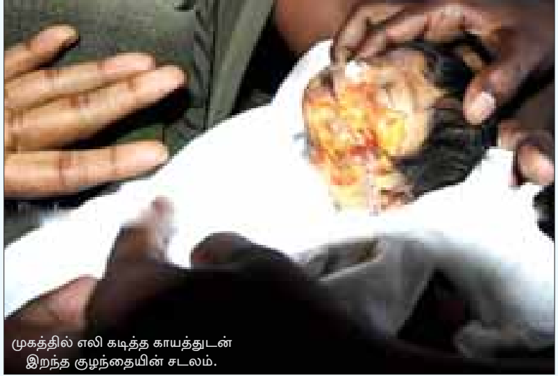
முகத்தில் எலி கடித்த காயத்துடன் இறந்த குழந்தையின் சடலம்.

எலிகள் ஒழிகின்றன! பெருச்சாளிகள் நுழைகின்றன!!