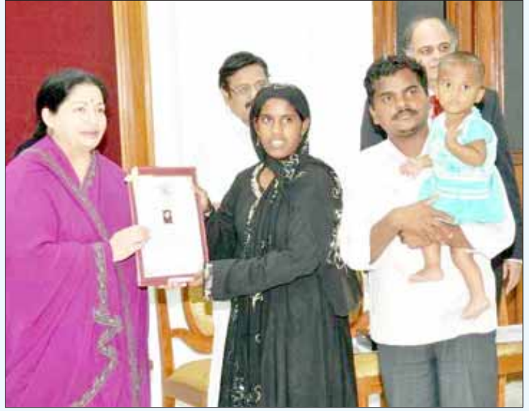
விரிவாக்கப்பட்ட மருத்துவக் காப்பீடு திட்டத்தைத் தலைமைச் செயலகத்தில் தொடங்கி வைக்கும் முதல்வர் ஜெயா. (கோப்புப் படம்)

அம்மாவின் திட்டப்படி, அரசு மருத்துவமனைகளில் செயல்படும் கட்டண சிகிச்சை முறை தற்போது தனியார்