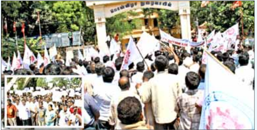
கோவையைச் சேர்ந்த சிறுதொழில் அதிபர்கள்-தொழிலாளர்கள் மின்வெட்டைக் கண்டித்து மின்வாரிய அலுவலகத்தை முற்றுகையிட்டு நடத்திய போராட்டம்.

அன்று கருணாநிதி ஆட்சியின் போது, மின்வெட்டுத் துறை அமைச்சர் என்று ஆற்காடு வீராசாமிக்குப் பெயர் சூட்டி, ஆட்சியின் நிர்வாகத் திறமையின்மையும் ஊழ