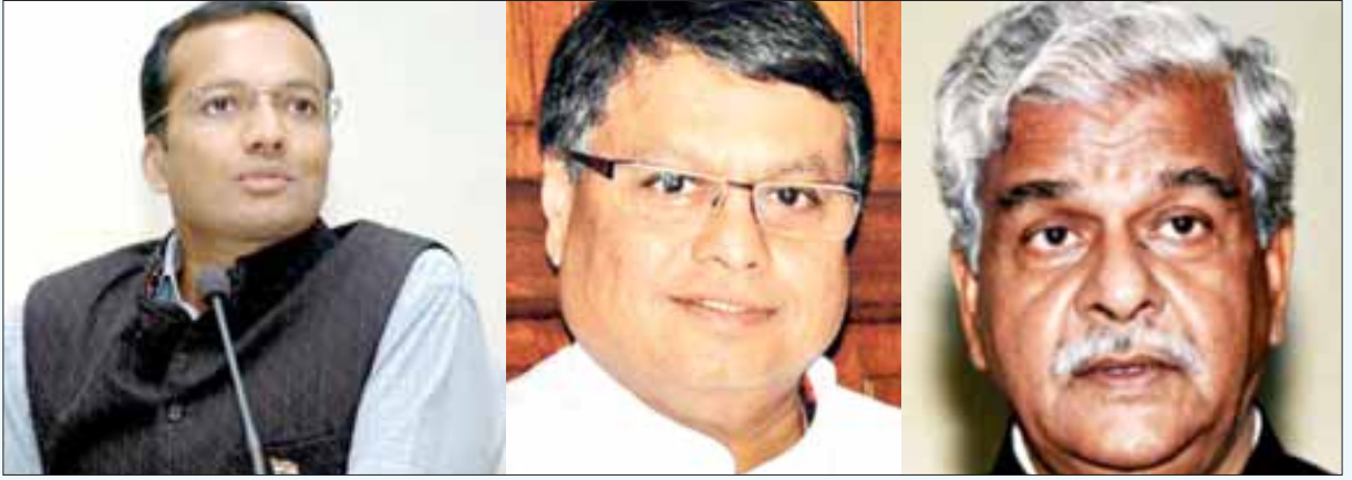
நிலக்கரி ஊழலில், தமது நிறுவனங்களுக்கு வயல்களைப் பெற்றதன் மூலம் நேரடியாக ஆதாயமடைந்துள்ள காங்கிர எம்.பி.க்கள் நவீன் ஜிண்டால் (இடது ஓரம்) மற்றும் விஜய் தர்தா; தரகு வேலை பார்த்த நிலக்கரித் துறை அமைச்சர் சிறீ பிரகாஷ் ஜெய்ஸ்லால் (வலது ஓரம்).