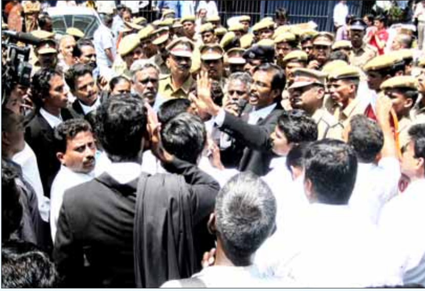
இடிந்தகரை மக்கள் மீது போலீஸ் நடத்திய தாக்குதலைக் கண்டித்து, உயர் நீதிமன்ற வழக்குரைஞர்களைத் திரட்டி, மனித உரிமைப் பாதுகாப்பு மையம் சென்னையில் நடத்திய கோட்டை நோக்கிச் செல்லும் பேரணி.