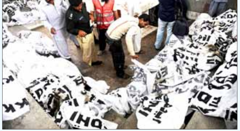
289 பேரைப் பலி கொண்ட முதலாளித்துவ பயங்கரவாதத்தின் கோரம்: பிணக்குவியலில் தமது உற்றார் உறவினரைத் தேடும் அவலம்.

அண்டை நாடான பாகிஸ்தானின் கராச்சி நகரில் கடந்த செப்டம்பர் 12 அன்று அலி எண்டர்பிரைசஸ் என்ற ஆயத்த ஆடை தயாரிப்புத் தொழிற்கூடத்தில் ஏற்பட்ட தீ விபத்தில் 289 தொழிலாளர்கள் கோரமாகக் கொல்லப்பட்டுள்ளனர். இது, பாகிஸ்தான் இதுவரை கண்டிராத மிகக் கொடிய கோரமான ஆலை விபத்து. கராச்சியின் வடமேற்கேயுள்ள பால்தியா நகரத் தொழிற்பேட்டையிலுள்ள இத்தொழிற்கூடத்தின் மூன்று மாடிகளிலும் தீப்பற்றியதால், தப்பிக்க வழியில்லாமல் கூண்டில் சிக்கிய பறவைகள் போலத் தொழிலாளர்கள் தீயில் வெந்து கரிக்கட்டைகளாகியுள்ளனர்.