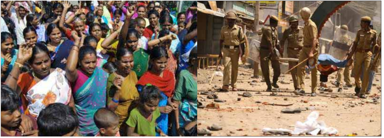
வன்கொடுமைச் சட்டத்தைத் தீவிரமாக நடைமுறைப்படுத்தக்கோரி அருந்ததியர் சாதியைச் சேர்ந்த பெண்கள் நடத்தும் ஆர்ப்பாட்டம் (இடது); அரசின் வன்கொடுமை: பரமக்குடியில் தாழ்த்தப்பட்டோர் மீது நடத்தப்பட்ட துப்பாக்கிச் சூடு. (கோப்புப் படங்கள்)

வெறுங்கனவாகி வருகிறது. மேற்படி கல்வியிலும் பணிகளிலும் தனிநபர் என்கிற முறையில் ஒரு சிலரின் “சாதனைகள்” முன்னேற்றங்கள் மட்டும் எடுத்துக்காட்டுகளாக செய்தி ஊடகங்களில் பிரபலப்படுத்தப்படுகின்றன. மற்றபடி ஒரு சமூகம் என்கிற முறையில் பெரும் எண்ணிக்கையில் தாழ்த்தப்பட்ட மக்கள் பலனடைந்து வருவதாகக் கூற முடியாது. ஆக, தாழ்த்தப்பட்ட மக்களுக்குக் கல்வியிலும் வேலை வாய்ப்பிலும் இடஒதுக்கீடு மூலம் சமூக நீதி என்பது கானல் நீராக உள்ளதென்பதே உண்மையாகும்.