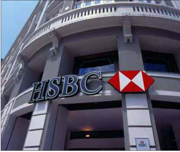
மெக்சிகோவைச் சேர்ந்த போதை மருந்து மாஃபியா கும்பலின் கறுப்புப் பணத்தை அமெரிக்காவிற்குக் கடத்தி வந்த ஹெச்.எஸ்.பி.சி. வங்கிக்கு அமெரிக்கா விதித்துள்ள தண்டனை-அபராதம்!

“சிக்கலான நிதிக்கருவிகள், ஒன்றிலிருந்து ஒன்று கைமாறிச் செல்லும் சிலந்தி வலை போன்ற நிதிப் பரிவர்த்தனைகள் ஆகியவற்றைப் பின் தொடர்ந்து சென்று கறுப்புப் பணத்தின் உடைமையாளரை ஒருக்காலும் அடையாளம் காணமுடியாது. வங்கிக் கணக்குகளைச் சோதனை போடுவதையும் எந்த வங்கியும் அனுமதிக்காது. ஒரு வேளை கறுப்புப் பணத்துக்கு உரியவரைக்