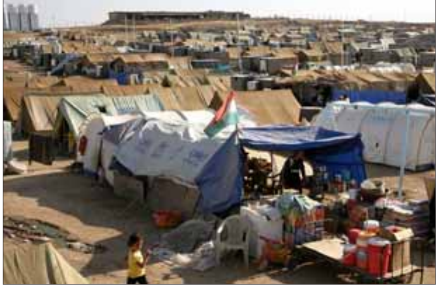
சிரியாவிலிருந்து இராக்கிற்குத் தப்பியோடும் சிறுபான்மை குர்து இனத்தவருக்காக, இராக்கின் தோஷூக் நகருக்கு அருகே அமைக்கப்பட்டுள்ள அகதி முகாம்.

சுதந்திர சிரிய இராணுவத் துக்கும் அரசுப் படைகளுக்கும் இடையே கடந்த ஒன்றரை ஆண்டுகளாக நடந்து வரும் மோதல்கள் மற்றும் சன்னி பிரிவைச் சேர்ந்த ஜிஹாதிகள் நடத்திவரும் பயங்கரவாதத்தாக் குதல்கள் காரணமாக, இதுவரை ஏறத்தாழ 20,000 பேர் கொல்லப் பட்டுள்ளனர் என்றும், இறந்தவர்களுள் கணிசமான பேர் சிறுபான்மையினரான அலாவி முசுலீம்களும் கிறிஸ்தவர்களும் தானென்றும் கூறப்படுகிறது. சுதந்திர சிரிய இராணுவக் கும் பல் நடத்திய தாக்குதல் காரணமாக ஹோம்ஸ் நகரிலிருந்து மட்டும் 50,000 கிறித்தவர்கள் அகதிகளாக வெளியேறியுள்ளனர். கிறித்தவர்களைக் குறிவைத்துத் தாக்குவது இப்பொழுது சிரியா