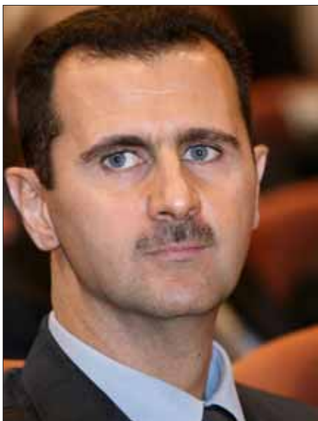
சிரிய அதிபர் பஷார் அல் அஸாத்

சிரிய அதிபரை எதிர்த்து இன்று ஆயுதத் தாக்குதல்களை நடத்தி வரும் கூட்டணியில் உள்ள குழுக்களிலேயே முசுலீம் சகோதரத்து வக்கட்சிதான் ஓரளவு பெரியதும் அமைப்புரீதியாக ஒழுங்கமைக்கப்பட்ட கட்