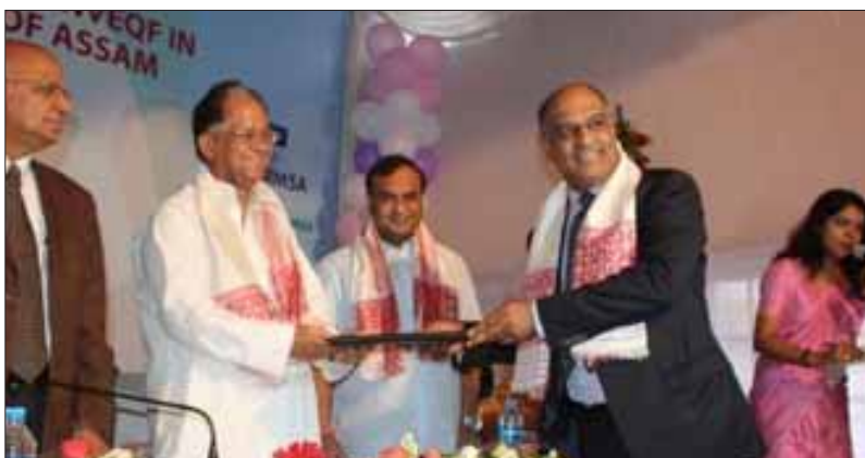
அசாம் மாநிலத்திலுள்ள அரசுப்பள்ளிகளில் தொழிற்படிப்புகளை பியர்சன் என்ற தனியார் கார்ப்பரேட் நிறுவனத்துடன் இணைந்து நடத்த போடப்பட்ட ஒப்பந்தத்தை, அந்நிறுவனத்தின் தலைவரிடம் அளிக்கிறார், அசாம் முதல்வர் கோகாய். (இடமிருந்து இரண்டாவது)

செலுத்தும் வசதிகொண்ட எந்த நிறுவனமும் இதற்குத் தகுதிபடைத்ததாகும். நாடெங்கும் 3000 பள்ளிகள் இவ்வாறு உருவாக்கப்பட்டு, ஒவ்வொரு பள்ளியும் சுயமாகவே கட்டணங்களை நிர்ணயித்துக் கொள்ளும். ஆசிரியர்களுக்கான ஊதியத்தையும் அப்பள்ளிகளே தீர்மானிக்கும். பாடத்திட்டம் ஒன்று இருந்தாலும், பள்ளி நேரம் முடிந்த பின், தனியார் முதலாளிகள் தமக்குத் தேவையானதுறைகளில் தேவையான மாணவர்களைப் பயிற்றுவித்துக் கொள்ள அனுமதிக்கப்படுவர். காலப்போக்கில் பாடத்திட்டத்தையும் தனியார் முதலாளிகளே முடிவு செய்வதை நோக்கிச் செல்வதற்கான முதல் படியாகும் இது.