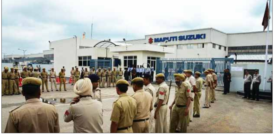
தொழிலாளர்களை அச்சுறுத்துவதற்காக மாருதி ஆலையில் குவிக்கப்பட்டுள்ள போலீசு பட்டாளம்.