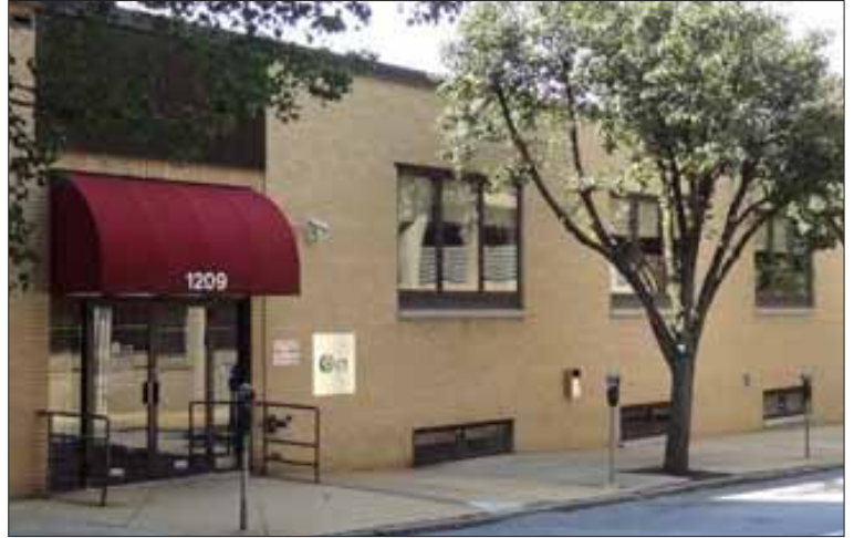
கோக், ஃபோர்டு உள்ளிட்ட 2,17,000 நிறுவனங்களின் பதிவு அலுவலகங்கள் செயல்பட்டு வரும், அமெரிக்காவின் டெலாவர் மாநிலத்தின் வில்மிங்டன் நகரில், வடக்கு ஆரஞ்சு தெருவினுள்ள கட்டிடம்: கறுப்புப் பணத்தின் மூலவர் சன்னதி.

'டாக்ஸ் ஜஸ்டிஸ் நெட்வொர்க்' என்ற சர்வதேச தன்னார்வ அமைப்பு 2009 - நவம்பரில் ஒரு பட்டியலை வெளியிட்டுள்ளது. கார்ப்பரேட் முதலாளிகளும், நிதி நிறுவனங்களும் கோருகின்ற நிதித்துறை கள்ளத்தனத்தை (Financial secrecy) பேணுவதில் உலகத்திலேயே இலண்டன் 5 - வது இடத்தில் இருக்கிறது. நான்காவது இடம் கேமேன் தீவு, மூன்றாவது இடம் சுவீஸ், இரண்டாவது இடம் லக்சம்பர்க், முதல் இடம் அமெரிக்கா. அதாவது, அம்பாணி முதல் ஆ.ராசா வரையிலான யாரும் தங்களது