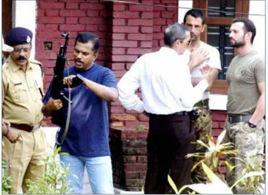
இந்தியாவின் ஏகாதிபத்திய விசுவாசம்: கொலைகார இத்தாலியர்களை மத்தியத் தொழிற்பாதுகாப்புப்படை விருந்தினர் மாளிகையில் வைத்து ராஜமரியாதையுடன் நடத்தப்படும் விசாரணை.

அராபிக்கடல் பகுதியில் இதுவரை சோமாலியக் கடற் கொள்ளையர்களின் தாக்குதலே நடந்திருந்தாத நிலையில், சோமாலியக் கொள்ளையர்கள் என்று தவறாகக் கணித்து இத்தாலிய வணிகக் கப்பலின் பாதுகாப்புப் படையினர்துப்பாக்கிச் சூடு நடத்தியதாகவும், ஒருவிதப் பதற்றத்தில் தான் இத்துப்பாக்கிச் சூடு நடந்திருக்குமே யொழிய, சிங்கள ராணுவத்தைப் போல வெறிகொண்டு நிகழ்த்தியிருக்க வாய்ப்பில்லை என்றும் இந்திய ஆட்சியாளர்களின் நோக்கத்துக்கு ஏற்ப தினமணி தலையங்கம் எழுதுகிறது. துனாமீன்களுக்கு மிகப்பெரிய வலை விரித்திருக்கும் மீனவர்கள், வர்த்தகக் கப்பல்கள் அந்த வழியில் வரும்போது அவற்றால் தங்கள் வலைகள் சேதமடை