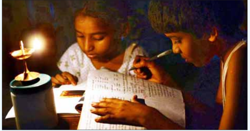
தேர்வு நேரத்தில் கடுமையான மின்வெட்டு அமல்படுத்தப்படுவதால், கைவிளக்கு வெளிச்சத்தில் படிக்க முயலும் மாணவர்கள்.

மின்சாரம் என்பது தமிழக மக்களின் பொதுச்சொத்து என்பதை உணர்ந்து, தாங்கள் அனுபவித்து வரும் இச்சலுகையை கார்ப்பரேட் நிறுவனங்கள் தானாக முன்வந்து விட்டுக் கொடுக்க வேண்டும்” என்று தமிழகத்தின்