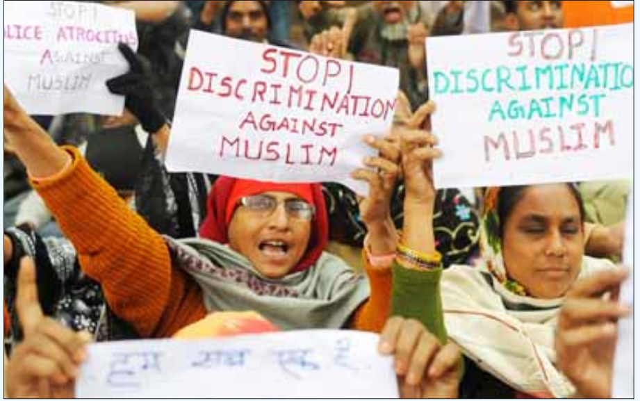
முஸ்லிம்கள் மீது பொய்க்குற்றம் சாட்டி வதைக்கும் குஜராத் அரசின் பயங்கரவாதத்தை எதிர்த்து கடந்த டிசம்பர் 28, 2010 அன்று டெல்லியில் முஸ்லிம் பெண்கள் நடத்திய ஆர்ப்பாட்டம்.

அமீர் முதல் குற்றவாளியாகச் சேர்க்கப்பட்டார். இந்த குண்டு வெடிப்புகள் அனைத்தையும் அமீர், அவரது கூட்டாளி சகீலுடன் இணைந்து நடத்தியதாகக் குற்றம் சாட்டப்பட்டது. ஆனால் 10 வழக்குகளில், விசாரணை துவங்கும் முன்னரே சகீல் விடுவிக்கப்பட்டார். அதுமட்டுமன்றி, 2009-ஆம் ஆண்டு தாஸ்னா சிறைச்சாலையில் சகீல் பிணமாகத் தொங்கினார். அந்தச் சிறைச்சாலையின் கண் காணிப்பாளர் வி.கே.சிங் மீது சகீலைக் கொலை செய்ததாக வழக்கு பதிவு செய்யப்பட்டுள்ளது.