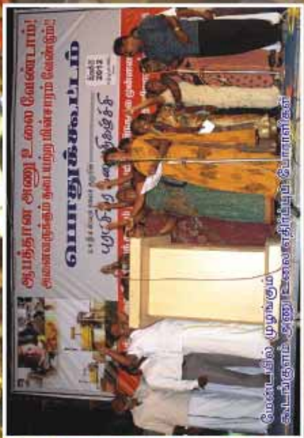
மேற்பட்டில் முழங்கும் கூடங்குளம் அணு உலை எதிர்ப்பும் சிபாரிசும்