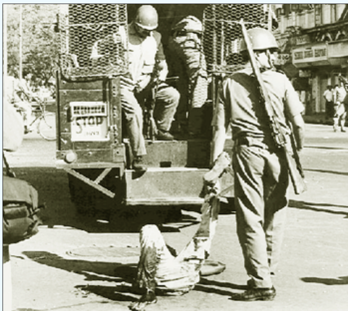
அயோத்தி பாபர் மசூதியை இடித்ததோடு ஆர்.எஸ்.எஸ். - சிவசேனா இந்துவெறி பயங்கரவாத கும்பல் மும்பை நகரில் நடத்திய கலவரத்தில் அப்பாவி முசுலீம்கள் கொல்லப்பட்ட கொடூரம்.