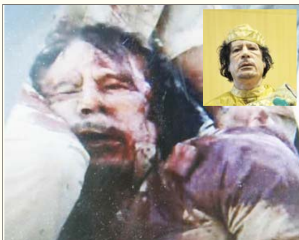
அமெரிக்க ஆக்கிரமிப்பை எதிர்த்தால் இந்தக் கதிதான் ஏற்படும் என உலகுக்கு விடப்பட்டுள்ள எச்சரிக்கை: இறைச்சிக் கூடத்தில் கிடத்தி இழிவுபடுத்தப்பட்ட லிபியாவின் அதிபர் மும்மர் கடாபியின் உடல்.

ஆப்பிரிக்காவிலுள்ள கென்யா நாட்டின் கருப்பினத் தந்தைக்குப் பிறந்த மகனாகத் தன்னை அறிவித்துக் கொண்ட அமெரிக்காவின் முதல் கருப்பின அதிபரான ஓபாமா, அக்கருப்பின அகதிகளைப் பாதுகாக்க எந்த நடவடிக்கையும் எடுக்கவில்லை. மனித நேயம், மனித உரிமை பற்றி வாய்கிழியப் பேசும் ஏகாதிபத்திய நேடோ படைகளோ, ஐ.நா. பாதுகாப்புக் கவுன்சிலோ அவர்களை ஏறெடுத்தும் பார்க்கவில்லை. நடுக்கடலில் தத்தளித்த