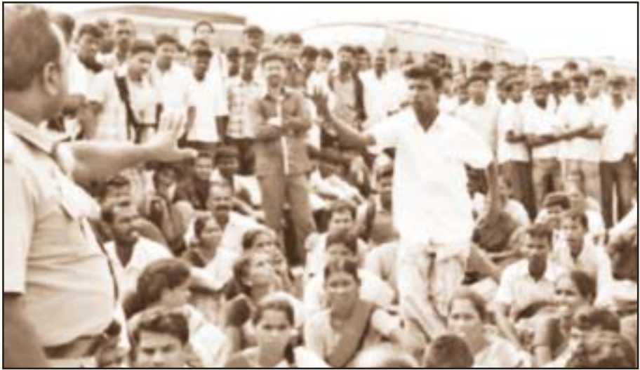
பேருந்துக் கட்டணக் கொள்ளைக்கு எதிரான மக்களின் குமுறல்: தமிழகத்தின் பல பகுதிகளில் நடந்துள்ள தன்னெழுச்சியான போராட்டங்களுக்கு ஒரு சான்று.

சமச்சீர்கல்வித் திட்டத்தை நடைமுறைப்படுத்துவது பற்றிய வழக்கு நடந்து கொண்டிருந்த போதே, பழைய பாடத் திட்டத்தின் கீழ் அவசரமாக ரூ. 200 கோடி செலவில் பாடப்புத்தகங்களை அச்சிட்டு மக்கள் வரிப்பணத்தைப் பாழடித்தும், ஆயிரம் கோடி ரூபாய் செலவில் கட்டப்பட்ட புதிய தலைமைச் செயலகத்தை இழுத்து மூடிவிட்டு அங்கு சிறப்பு மருத்துவமனையை நிறுவப் போவதாக அறிவித்தும், ஐநூறு கோடி ரூபாய் செலவிட்டுக் கட்டப்பட்ட அண்ணா நூற்றாண்டு நினைவுநூல்