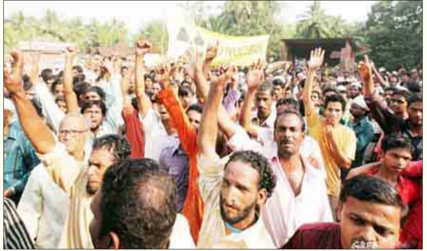
மகாராஷ்டிரா மாநிலத்தில் ஜெய்தாபூர் பகுதியில் பிரான்சு நாட்டிலிருந்து இறக்குமதி செய்து அமையவுள்ள அணுஉலைத் திட்டத்தை எதிர்த்து நடந்த ஆர்ப்பாட்டம். (கோப்புப் படம்)

இதுவொரு புறமிருக்க, நாடாளுமன்றத்தில் ஏற்கெனவே நிறைவேற்றப்பட்டுள்ள அணு விபத்து காப்பீடு சட்டத்தில், “அணு உலையின் வடிவமைப்பில் தவறு இருந்து, அதனால் விபத்து நேரும் பட்சத்தில் அந்த உலையை விற்பனை செய்த நிறுவனத்திடமிருந்து அந்த அணு உலையை இயக்கும் நிறுவனம் குறைந்தபட்ச இழப்பீடு கேட்பதற்கு” ஏற்ப விதிகள் உருவாக்கப்பட்டிருந்தன. இந்த விதிகளை அச்சட்டத்தில் மன்மோகன்சிங் தானே முன்வந்து சேர்க்கவில்லை. போபால் படுகொலை தீர்ப்பு மக்கள் மத்தியில் ஏற்படுத்தியிருந்த