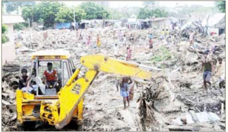
'வளர்ச்சி'க்காக ஏழைகளை விரட்டியடிக்கும் அரசின் அக்கிரமம்: மெட்ரோ ரயில் திட்டத்துக்காக சைதாப்பேட்டை-அமுதா நகரில் குடிசைகள் இடித்துத் தள்ளப்பட்ட கொடூரம்.

பிற துறைகளில் எவ்வாறு தனியார்மயம் ஊழலை ஊதிப் பெருக்கியதோ, அதேபோல மாநகராட்சி அதிகார வர்க்கமும் இப்புதுப்பணக்கார வர்க்கத்துடன் கைகோர்த்து ஊழலை இன்னொரு பரிமாணத்துக்கு எடுத்துச் சென்றன. தனியார்மயம் தீவிரமான பின்னரோ, நடப்பிலுள்ள