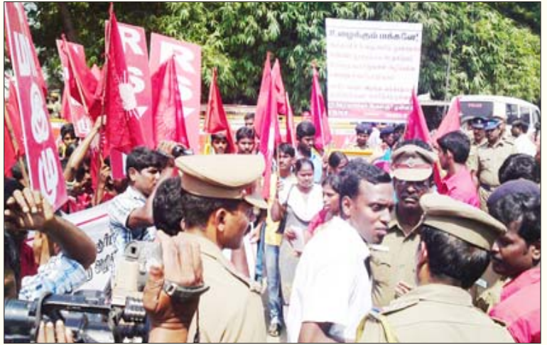
அண்ணா நூற்றாண்டு நூலகத்தை முடமாக்கும் அறிவிப்பை எதிர்த்து சென்னையில் புரட்சிகர மாணவர்-இளைஞர் முன்னணி நடத்திய ஆர்ப்பாட்டம்.

அண்ணா நூற்றாண்டு நூலகத்தை இட மாற்றம் செய்யத் தேவையில்லை எனத் தனது தலையங்கத்தில் ஒரு புறம் முதலைக்கண்ணீர்வடிக்கும் தினமணி நாளிதழ் (நவம்பர் 4) இன்னொரு புறம், “அண்ணா நூற்றாண்டு நூலகம் ஊழலின் மிகப்பெரிய அடையாளச் சின்னம் என்பதை முதல்வருக்கு ஏன் அவரது ஆலோசகர்கள் சுட்டிக்காட்டாமல் விட்டுவிட்டார்கள் என்று தெரியவில்லை” எனப் போட்டுக் கொடுக்கும் வேலையைச் செய்கிறது. அதாவது, நூலகத்தைக் கட்டுவதில் நடந்துள்ள ஊழலை விசாரிக்க உத்தரவிட்டுவிட்டு, அதன்பின் நூலகத்தை இட மாற்றம் செய்யும் அறிவிப்பைச் செய்து