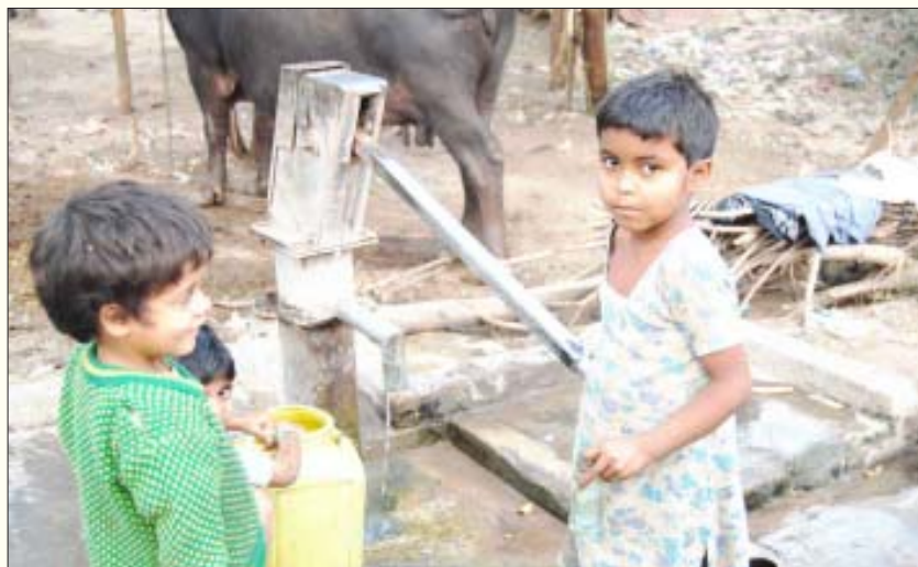
கிழக்கு உ.பி.யின் கிராமப்புறங்களில் கையடி பம்புகளிலிருந்து கிடைக்கும் மாசுபட்ட நீர்தான் ஏழைகளின் குடிநீருக்கான ஒரே ஆதாரம்.

கால்களை அசைக்க முடியாத அளவிற்கு மூட்டுகள் இறுக்கம் அடைதல், கண் பார்வை பறிபோதல் உள்ளிட்டும் பல்வேறுவிதமான நரம்புமற்றும் மூளைதொடர் பான பாதிப்புகளை இத்தொற்று நோய் உயிர் பிழைக்கும் குழந்தைகளிடம் ஏற்படுத்தும் என்கிறார்கள் மருத்துவர்கள். இத்தொற்றுநோய் தாக்கிய நிலையில் கிடைக்கும் அற்பமான மருத்துவ வசதிகூட, இத்தொற்று நோயால் ஏற்படும் பிந்தைய பாதிப்புகளுக்குக் கிடைப்பதில்லை. இப்படிப் பாதிக்கப்படும் குழந்தைகள் பெற்றோர்களுக்குப் பெரும் சமையாக மாறி விடுகிறார்கள்.