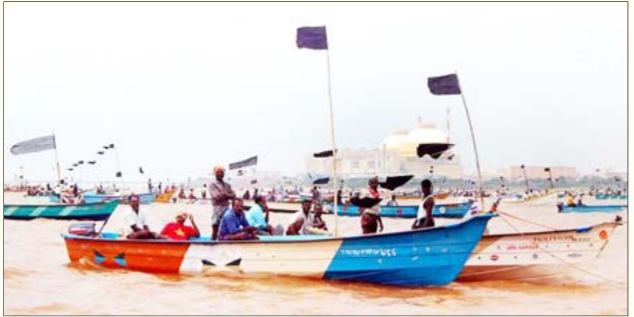
கூடங்குளம் அணுமின் நிலையத் திட்டத்துக்கு எதிராக மீனவர்கள் நடத்திய கருப்புக் கொடி ஆர்ப்பாட்டம்.

ஆபத்தான இரசாயன ஆலைகளுக்கு அனுமதி வழங்குவது முதல் காடுகளை அழித்துச் சுரங்கம் தோண்டிச் சுற்றுச்சூழல் அனுமதி தருவது வரை எல்லாப் பித்தலாட்டங்களையும் முதலாளிகளுக்கு செய்து கொடுப்பவர்களும், விவசாயிகளுக்கே தெரியாமல் மரபீனி மாற்றம் செய்யப்பட்ட விதைகளைப் புகுத்தி, விவசாயப் பல்கலைக்கழகங்களைப் பன்னாட்டு நிறுவனங்களின் அடியாள் கழகங்களாக மாற்றி விவசாயிகளின் குடியைக் கெடுப்பதும் விஞ்ஞானிகளும் வல்லுநர்களும் தான்.