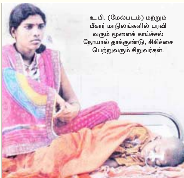
உ.பி. (மேல்படம்) மற்றும் பீகார் மாநிலங்களில் பரவி வரும் மூளைக் காய்ச்சல் நோயால் தாக்குண்டு, சிகிச்சை பெற்றுவரும் சிறுவர்கள்.

இந்தத் தொற்றுநோயால் பாதிக்கப்பட்டு, கிழக்கு உ.பி.யில் கோராக்குப் நகரில் அமைந்துள்ள பாபா ராகவ்தால் மருத்துவக் கல்லூரி மருத்துவமனையில் சேர்க்கப்பட்டுள்ள குழந்தைகளுள் பெரும்பாலானவை, நோயின் தீவிரத்தால் அடையாளம் தெரியாத அளவிற்கு உடல் மெலிந்து உருக்குலைந்து போய் மரணத்தின் வாயிலில் உள்ளன. பல குழந்தைகள் செயற்கை சுவாசம் பொருத்தப்பட்ட நிலையில், 15 நாட்களுக்கும் மேலாக நினைவு திரும்பாத நிலையில் மரணத்துடன் போராடி வருகின்றன. “இந்த மருத்துவமனைக்குள் நுழைவது ஏதோ பிணவறைக்குள் நுழைவது போல இருக்கிறது; நோயின் தீவிரத்தாலும், மருத்துவமனையில் போதிய வசதிகள் இல்லாததாலும், பெற்றோர்கள் தம் கண் முன்னே தங்களுது குழந்தைகள் சிறுகச்சிறுக சாவாதைப் பார்த்துக்கதறியபடியே உள்ளனர்” என இந்த அவலத்தை அம்பலப்படுத்தியிருக்கிறது, ஃபிரண்ட்லைன் இதழ்.