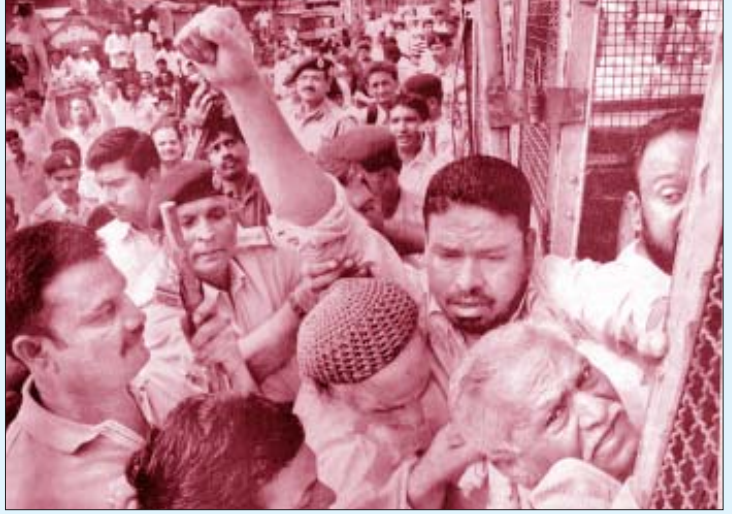
நரேந்திர மோடியின் உண்ணாவிரத மோசடியை அம்பலப்படுத்தியும் குஜராத் இனப்படுகொலைக்கு நீதி கேட்டும் அகமதாபாத் நகரின் நரோடா பாட்டியா பகுதியில் ஆர்ப்பாட்டம் நடத்திய முசுலீம்கள் கைது செய்யப்படுகிறார்கள்.