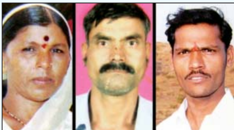
தொடர்ச்சி 35-ஆம் பக்கம்

போலீசின் திட்டமிட்டத் தாக்குதலில் சுட்டுக்கொல்லப்பட்டவர்கள்