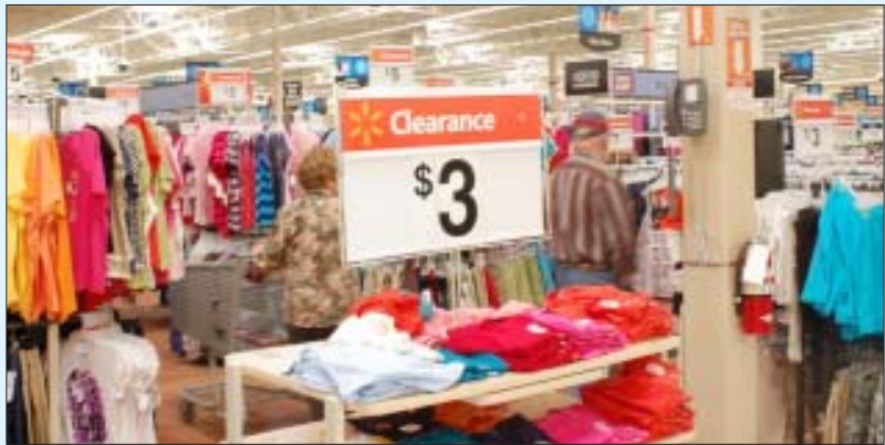
ஐரோப்பிய நாடுகளில் நவீன வடிவமைப்புகளுடன் விற்பனைக்கு வைக்கப்பட்டுள்ள ஆயத்த ஆடைகள். ஒட்டப்பட்டுள்ள லேபிள் பன்னாட்டு நிறுவனங்களுடையது. உழைப்போ வங்கதேசத் தொழிலாளியினுடையது.

யித்தனர். போராடிய தொழிலாளர்கள் முன்வைத்த கோரிக்கையில் வெறும் 60 சதவீத அளவிலான தொகைதான் இது. 2010-இல் அறிவிக்கப்பட்ட குறைந்தபட்சக் கூலியானது, உலகிலேயே மிக அற்பமான கூலியாகும். 1993-ஆம் ஆண்டின் ஊதியத்தை ஒப்பிடும் போது தொழிலாளர்களின் உண்மை ஊதியமானது, 2010-இல் மேலும் குறைந்துள்ளது என்பதைப் பல்வேறு புள்ளிவிவரங்கள் நிரூபித்துக் காட்டுகின்றன. அற்பக் கூலியுடன் விலைவாசி உயர்வை எதிர்கொள்ள இயலாமல் தொழிலாளர்கள் அரைப் பட்டினி நிலையில் இருத்தப்பட்டுள்ளனர். மிக அற்பமான இந்த ஊதிய