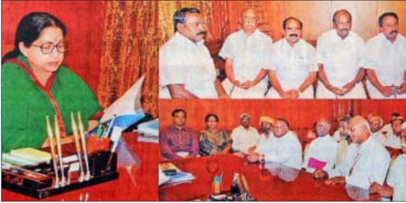
கூடங்குளம் அணு மின் நிலைய எதிர்ப்பு போராட்டக் குழு 'அம்மா' வின் வேண்டுகோளைப் புறக்கணித்ததையடுத்து, போராட்டக்குழுவினரோடு பேச்சுவார்த்தை நடத்த வேண்டிய கட்டாயத்திற்குத் தள்ளப்பட்டது, ஜெயா அரசு.

நேரிட்டால், இந்திய-ரசிய கூட்டுத் தொழில் முயற்சிகள் பலவும் பாதிக்கும் என்று ரசியா எச்சரித்திருக்கிறது. கூடங்குளத்தில் அரசு தோற்றுவிட்டால், ஜெய்தாபூர் உள்ளிட்ட எல்லா இடங்களிலும் அணுமின் நிலையங்களுக்கு எதிரான மக்கள் போராட்டம் கிளர்ந்தெழும். மேலும், சிங்கூர், நந்திகிராமம் பிரச்சினைகளைப் போலன்றி, இதன் பரிமாணம் மிகவும் பெரிது. இந்தியாவின் அணுசக்தி கனவினால் அமெரிக்க, பிரெஞ்சு பன்னாட்டு முதலாளிகள் அடையவிருக்கும் கொள்ளை இலாபம், அணு மின் உற்பத்தியில் குதிக்க காத்திருக்கும் டாடா, அம்பானி போன்ற தரகு முதலாளிகளின் இலாப வெறி, அணு மின்நிலையங்களை பிற நாடுகளுக்கு ஏற்றுமதி செய்யத் துடித்துக் கொண்டிருக்கும் இந்திய அணுசக்தி அதிகாரவர்க்கம், அணுசக்தி கனவுடன் இணைந்த இந்தியாவின் வல்லரசுக் கனவு, அதற்குத் தேவைப்படும் அமெரிக்காவின் தயவு... போன்ற பல விசயங்கள் அணுவுக்குள் புதைந்திருக்கின்றன.