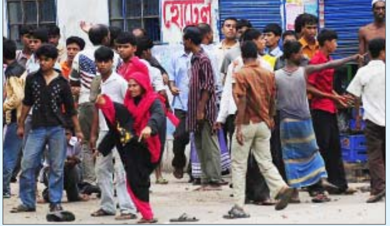
பன்னாட்டு மூலதனக் கொள்ளைக்கும் கொத்தடிமைத்தனத்துக்கும் எதிரான போராட்டத்தில் வங்கதேச ஆயத்த ஆடைத் தொழிலாளர்கள்.

அனைவரும் 19 வயதுக்கும் குறைவான வர்கள். எதிர்பாராமல் தீப்பற்றிக் கொண்டால் தப்பிப்பதற்காக அமைக்கப்படும் அவசர வழிக் கதவுகள் எந்தத் தொழிற்சாலையிலும் திறக்கும் நிலையில் இருந்ததில்லை. இதனால் கூண்டில் அடைபட்ட பறவைகளைப் போல அத்தொழிலாளர்கள் தீயில் வெந்து கரிக்கட்டைகளாகிப் போயினர். வங்கதேசத் தலைநகர் டாக்காவைச் சுற்றியிருக்கும் 4500-க்கும் மேற்பட்ட ஆயத்த ஆடை நிறுவனங்கள் அனைத்துமே இப்படிப்பட்ட மரணக் கொட்டடிகளாகத்தான் உள்ளன.