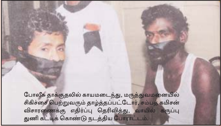
போலீசு தாக்குதலில் காயமடைந்து, மருத்துவமனையில் சிகிச்சை பெற்றுவரும் தாழ்த்தப்பட்டோர், சம்பந்தம் கமிசன் விசாரணைக்கு எதிர்ப்பு தெரிவித்து, வாயில் கருப்பு துணி கட்டிக் கொண்டு நடத்திய போராட்டம்.

பரமக்குடியில் தாழ்த்தப்பட்டோர் மீது கொலைவெறியாட்டம் போட்ட போலீசை எதிர்த்தும், பாசிச ஜெயா அரசின் அதிகார பூர்வ ஆதிக்க சாதிவெறியாட்டத்தை எதிர்த்தும், இப்போலீசு ராஜ்ஜியத்தை முளையிலேயே கிள்ளி எறிய தமிழக மக்களைப் போராட அறைகூவியும் தமிழகமெங்கும் ம.க.இ.க; வி.வி.மு; பு.மா.இ.மு; பு.ஜ.தொ.மு; பெ.வி.மு. ஆகிய புரட்சிகர அமைப்புகள் தாங்கள் செயல்படும் பகுதிகளில் சுவரொட்டிப் பிரச்சாரத்தை மேற்கொண்டன. மதுரை, தஞ்சை, கடலூர், திருவாரூர் ஆகிய இடங்களில் இப்புரட்சிகர அமைப்புகள் இணைந்து கண்டன ஆர்ப்பாட்டங்களை நடத்தியுள்ளன.