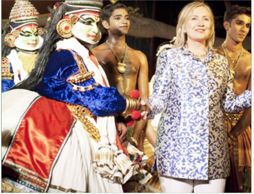
“அமெரிக்க ஆண்டையை” நடனமாடி மகிழ்வித்த சென்னை-கலாசேத்ரா மாணவர்களுக்குக் கிடைக்கும் பாராட்டு.

இவ்வாறு, அமெரிக்காவின் உலக மேலாதிக்கப் போர்த்தந்திரத்திட்டம் நிறைவேற்றப்படுவதை உறுதிப்படுத்தவும், தனது விசுவாச அடிமை நாடான இந்தியாவில் அதற்கான பணிகளை மேற்பார்வையிடவும் தான் அமெரிக்க வெளியுறவுச் செயலரான ஹிலாரி கிளிண்டன் இந்தியாவுக்கு வந்தார். இப்போர்த்தந்திர முக்கியத்துவமிக்க பேச்சுவார்த்தைகளின் ஓர் அங்கமாக சென்னையில் தெற்கு மற்றும் தென்கிழக்காசிய நிதிச் சந்தைக்கான மைய