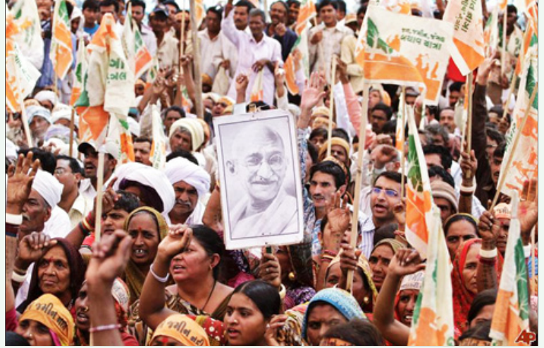
குஜராத்தின் மாஹுவாவில் நீராதாரங்களையும் விளைநிலங்களையும் பறிக்கும் நிர்மா நிறுவனத்தின் சிமெண்ட் ஆலைத் திட்டத்தை எதிர்த்து விவசாயிகள் நடத்தும் போராட்டம்.

குஜராத்தின் ஒட்டுமொத்த பருத்தி விவசாயத்தில் 54 சதம் பி.டி. பருத்தி விதை (மரபணு மாற்றம் செய்யப்பட்ட பருத்தி) கொண்டு பயிரிடப்படுகிறது. 30-க்கும் மேற்பட்ட தரகு முதலாளித்துவ நிறுவனங்கள் பி.டி. பருத்தி விதையை விற்பனை செய்கின்றன. இருப்பினும், இந்நிறுவனங்கள் அனைத்தும் பி.டி. பருத்தி விதைக்குக் காப்புரிமை கொண்டிருக்கும் பன்னாட்டு நிறுவனமான மான்சான்டோவின் கட்டுப்பாட்டில் இயங்கும் நிறுவனங்களாகும். மான்சான்டோதான் விலையைத் தீர்மானிக்கிறது. இதனால் பருத்தி விவசாயிகளுக்குச் சொல்லிக் கொள்ளும் அளவிற்கு இலாபமில்லை; காய் புழு நோயையோ கட்டுப்படுத்தவும் முடியவில்லை.