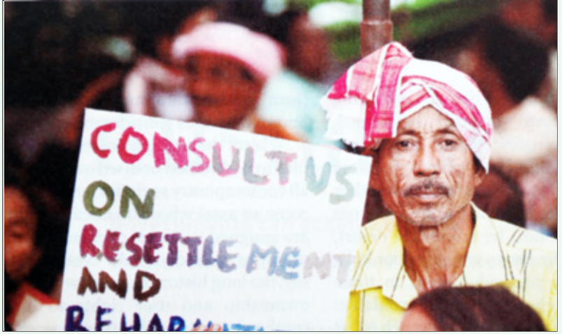
விவசாயிகளிடமிருந்து வலுக்கட்டாயமாக நிலங்களைக் கையகப்படுத்துவதற்கு எதிராக தலைநகர் டெல்லியில் நடந்த ஆர்ப்பாட்டம் (கோப்பு படம்).

வனங்களாலும் செயற்படுத்த முடியவில்லை. அடுத்த பத்தாண்டுகளில் அடிக்கட்டுமான துறையில் ஏறத்தாழ 1,70,000 கோடி அமெரிக்க டாலர்களை மூலதனமாக ஈர்க்க வேண்டும் என்றும் அரசு திட்டமிட்டுள்ளது. இந்நிலையில் வம்பு, வழக்கு, வாய்தா எனச் சிக்கிக் கொள்ளாமல், கார்ப்பரேட் நிறுவனங்கள் விவசாயிகளிடமிருந்து எளிதாக நிலங்களைக் கைப்பற்றிக் கொள்ளும் நோக்கத்திற்காகத் தான் நிலம் கையகப்படுத்தும் சட்டத்தில் திருத்தங்களும், மறுவாழ்வுக்கான புதிய சட்டமும் கொண்டு வரப்படுகிறதே யொழிய, விவசாயிகளின் நலன்களைப் பாதுகாக்கும் நோக்கம் எதுவும் காங்கிரசு கும்பலுக்குக் கிடையாது.