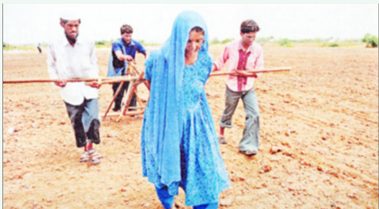
குஜராத்தின் கார்ப்பரேட் விவசாயத்தால் கால்நடைகள் அழிந்து பற்றாக்குறை ஏற்பட்டுள்ளதால், பெற்ற தாயை ஏர் மாடாகக் கொண்டு தந்தையும் மகன்களும் ஏரோட்டும் ஏழை விவசாயக் குடும்பத்தின் அவலம்.

பதப்படுத்தல் துறையில் முதலீடு செய்ய அழைத்துவரும் குஜராத் அரசு, கடந்த 2009-ஆம் ஆண்டில் மட்டும் 204 புரிந்துணர்வு ஒப்பந்தங்களைப் போட்டுள்ளது. இதன் மூலமாக, சுமார் 32,450 கோடி ரூபாய் அளவுக்கு இம்மாநிலத்தில் தனியார் முதலீடுகள் குவிந்துள்ளன. குறிப்பாக, ரிலையன்ஸ் நிறுவனம் உற்பத்தி-நுகர்வு சங்கிலியை ஒருங்கிணைக்க சுமார் 3000 கோடி ரூபாயை முதலீடு செய்துள்ளது. இத்தகைய புதிய சட்டங்களாலும் பெருமுதலாளிகளின் முதலீடுகளாலும் குஜராத்தின் விவசாயம் புதிய பரிமாணத்தை எட்டி வருகிறது.