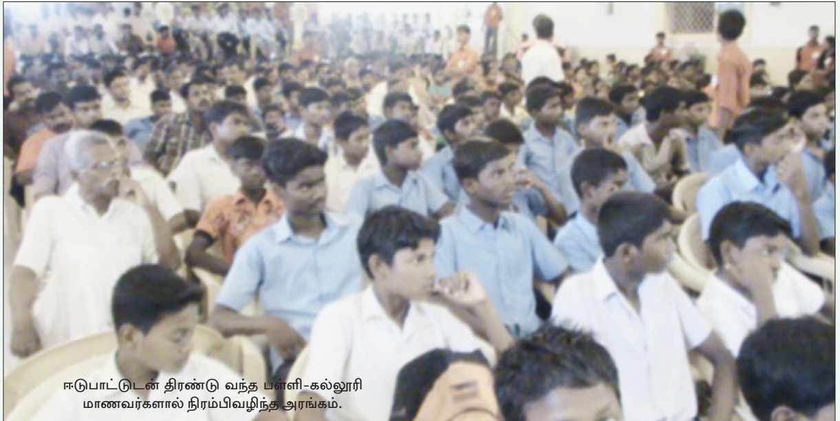
ஈடுபாட்டுடன் திரண்டு வந்த பள்ளி-கல்லூரி மாணவர்களால் நிரம்பிவழிந்த அரங்கம்.

கருத்தரங்கின் நோக்கத்தை சுருக்கமாக விளக்கித் தோடு மட்டுமின்றி, சமச்சீர் கல்வி எதிர்ப்பில் முன்னணியில் இருக்கின்ற பத்மாசாரங்கி, லயோலா, டி.ஏ.வி., முதலான பள்ளிகள் வழங்கும் விண்ணப்ப படிவத்தின் பின்புறத்தில், எவ்வளவு நன்கொடை தரமுடியும் என்பதை எழுதித் தருமாறு பெற்றோரிடம் அப்பள்ளி நிர்வாகங்கள் கோருவதாகவும், டெண்டர்களைத் தீர்மானிப்பதைப் போலவே, அதிகபட்ச நன்கொடை தருபவர்களுக்குப் பள்ளியில் இடமளிக்கப்படுவதாகவும் கூறி, மெட்ரிக் பள்ளிகளின் யோக்கியத்தை அம்பலப்படுத்தினார். சமச்சீர் கல்வி என்று பெயரிட்டு கருணாநிதி அரசு கொண்டுவந்திருக்கும் பொதுப் பாடத்திட்டம், மிகவும் வரம்புக்கு உட்பட்ட ஒரு சீர்திருத்தம்தான் என்ற போதிலும், அதை முடக்குகின்ற ஜெயா அரசுக்கு எதி