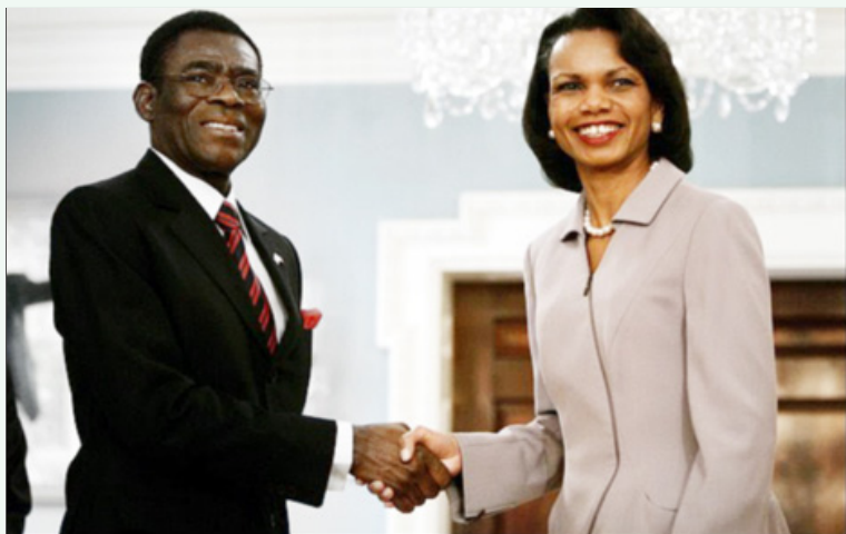
அமெரிக்கா-மத்திய கினியா இடையே நடந்த பேச்சுவார்த்தையில் கலந்துகொள்ள வந்த அமெரிக்காவின் (முன்னாள்) வெளியுறவுத் துறை செயலர் காண்டலீசா ரைஸை வரவேற்கும் கினியாவின் சர்வாதிகாரி ஓபியாங்(வலது) (கோப்புப்படம்).

அரசியல் கைதிகளைச் சித்திரவதை செய்வதை அரசின் கொள்கையாகவே கொண்டுள்ளது, கினியா. எனினும், கினியாவிலுள்ள அமெரிக்கத் தூதரகம், “கினியாவிற்கு நீதி குறித்துப் போதிப்பதைக் கைவிட வேண்டும்; மற்றவர்கள் குறிப்பிடும் அளவிற்கு அந்நாட்டில் இலஞ்சமோ, வறுமையோ தாண்டவம் ஆடவில்லை” என அமெரிக்க அரசிற்கு கழுக்கச் செய்தி அனுப்பியதாக, விக்கி லீக்ஸ் இணைய தளம் அம்பலப்படுத்தியிருக்கிறது.