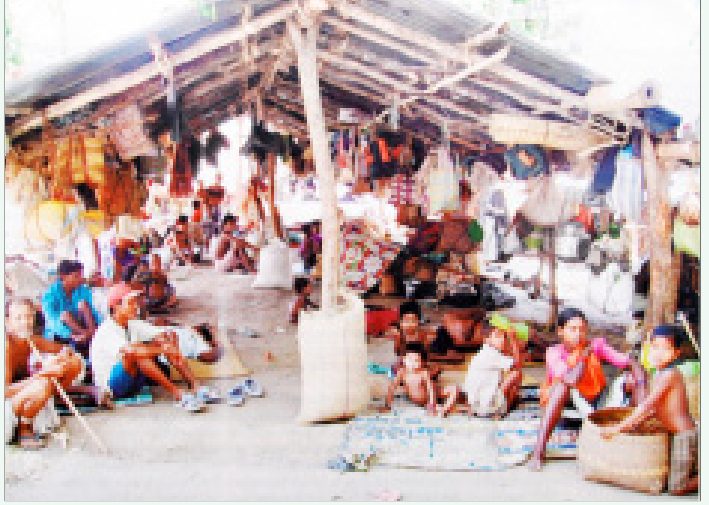
தமது சொந்த கிராமங்களில் இருந்து வலுக்கட்டாயமாக விரட்டியடிக்கப்பட்டு, நிவாரண முகாம் என்ற பெயரில் சல்வா ஜூடுமால் நடத்தப்படும் வதைமுகாம்களில் சட்டவிரோதமாக அடைத்துவைக்கப்பட்டுள்ள பழங்குடியின மக்கள்.

2007 ஜூனில், ஆந்திராவின் கம்மம் மாவட்டம் சேர்லாவில் நடந்த பழங்குடி மாநாட்டில் திறந்தவெளியில் அளிக்கப்பட்ட 110 பழங்குடி கிராமங்களின் பிரதிநிதிகளுடைய வாக்குமூலங்கள் சமர்ப்பிக்கப்பட்டன. அவை பெருமளவில் அடிப்படை உரிமைகள் மீறப்பட்டதையும் அரசு பயங்கரவாதத்தின் ஒரு பகுதியாக சல்வாஜூடும் அட்டுழியங்களையும் பற்றி தெளிவாகப் படம் பிடித்துக் காட்டின. அந்த வாக்குமூலங்கள் எல்லாம் பழங்குடி மக்களின் கோண்டி மொழியிலும், இந்தியிலும் ஆதாரங்களாக நீதிபதிகள் முன்பு சமர்ப்பிக்கப்பட்டிருந்தன.