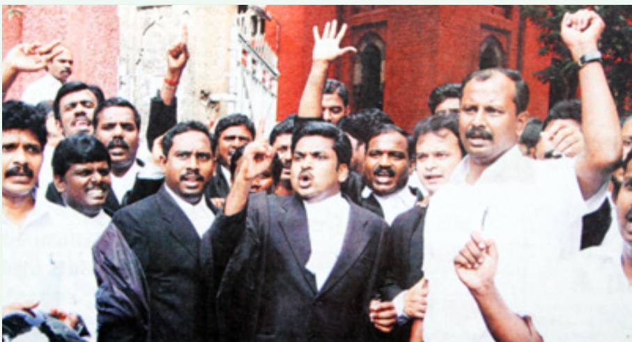
கிரிமினல் வழக்கு - விசாரணைகளை எதிர்கொண்டுள்ள ஜெயா, சென்னை உயர் நீதிமன்றத்தில் நடந்த விழாவில் கலந்துகொள்ளக் கூடாது எனக் கோரி சென்னை உயர் நீதிமன்ற வழக்குரைஞர்கள் நடத்திய ஆர்ப்பாட்டம்.