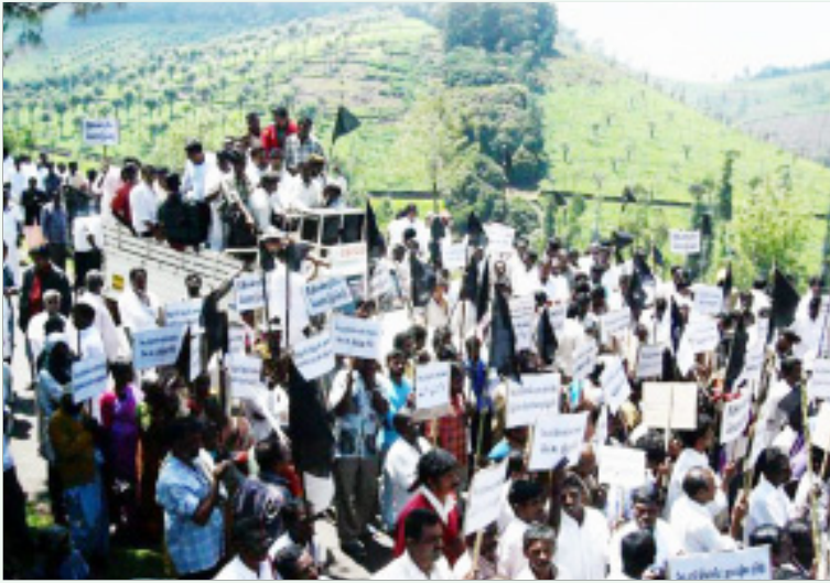
ஜெயா-சசி கும்பலால் ஆக்கிரமித்துக் கொள்ளப்பட்ட பொதுப்பாதையைத் திறந்துவிடக் கோரி, கொடநாடு பகுதியைச் சேர்ந்த பொதுமக்கள் நடத்திய ஆர்ப்பாட்டம் (கோப்புப் படம்).

இலவச கலர் டி.வி. வழங்கும் திட்டத்தைச் செயற்படுத்திய தி.மு.க. அரசு, அதற்காக டெண்டர்களைக் கோரியபொழுது, வெளிப்படைத்தன்மையோடு நடந்து கொண்டதாகவும், அ.தி.மு.க. அரசு இலவச மிக்ஸி, கிரைண்டர், ஃபேன் வழங்கும் திட்டங்களுக்காக டெண்டர் கோரும் விஷயத்தில் முந்தைய ஆட்சியைப் போல வெளிப்படைத் தன்மையோடு நடக்கவில்லை என்றும் அ.தி.மு.க.வின் தோழமைக் கட்சிகள்கூட குற்றஞ்சுமத்தி வருகின்றன. இதன் பொருள் இந்த இலவசத் திட்டங்களில் கமிசன் என்ற பெயரில் கொள்ளையடிப்பதற்கான வாய்ப்புகளை அ.தி.மு.க. திறந்துவிட்டுள்ளது என்பது தான்.