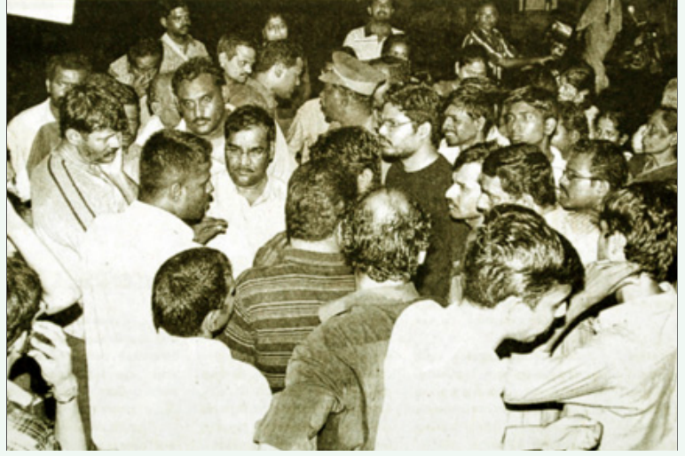
சென்னை-கே.கே.நகர் 9-ஆவது செக்டார் பகுதியில் தினமும் 5 மணி நேரத்துக்கும் மேலாக மின்தடை ஏற்படுவதைக் கண்டித்து, அப்பகுதி மக்கள் நடத்திய சாலைமறியல்.

ராத் பாணி மேம்பாடு என்பது சிறு மற்றும் நடுத்தர விவசாயிகளை நிலங்களிலிருந்து சிறுகச்சிறுக அப்புறப்படுத்திவிட்டு அல்லது அவர்களை ஐ.டி.சி., ரிலையன்ஸ் போன்ற நிறுவனங்களின் குத்தகை விவசாயிகளாக மாற்றிவிட்டு விவசாயத்தை கார்ப்பரேட் மயமாக்குவதுதான். விவசாயத்திலும் தனியார்மயம் - தாராளமயத்தைப் புகுத்த வேண்டும் என்ற உலக வங்கியின் கட்டளையை நடைமுறைப்படுத்துவதுதான். எனவே, அமைச்சரவை ஆலோசனை கூட்டத்தில் விவசாய மேம்பாடு குறித்து ஜெயா கும்பல் நடத்திய ஆலோசனைகளை, தமிழக விவசாயிகளுக்கு எதிராக நடத்தப்பட்ட சதி என்றுதான் கூற முடியும்.