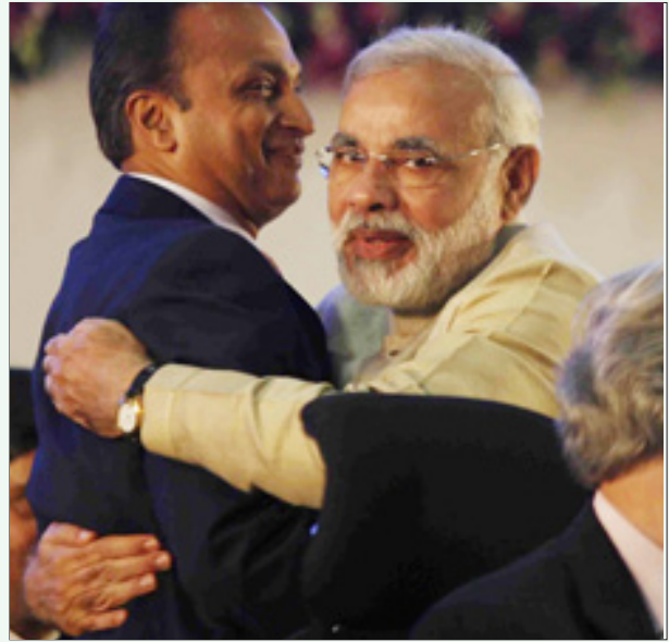
கார்ப்பரேட் 'விவசாயி' அம்பானியுடன் பயங்கரவாத முதல்வர் மோடி: பாரம்பரிய விவசாயத்தின் அழிவை விரைவுபடுத்திய புதிய கூட்டணி.

இத்தகைய தனியார்மய-தாராளமய தீவிரமாக்கலால், குஜராத் மாநிலத்தில் நகரமயமாக்கம் 43 சதவீத அளவுக்கு நடந்தேறியுள்ளதாகப் புள்ளிவிவரங்கள் தெரிவிக்கின்றன. நகரமயமாக்கமும் விவசாயத்தின் அழிவும் தனியார்மயம் - தாராளமயம் எனும் மறுகாலனியாக்கக் கொள்கையினால் திட்டமிட்டே முன்தள்ளப்படுபவையாகும். ஒப்பந்த விவசாயத்தின் மூலம் விவசாயிகளைப் போண்டியாக்கி, பின்னர் அவர்களே நிலத்தை விற்று ஓடுமாறு நிர்ப்பந்தித்து, இன்று எதிர்ப்பே இல்லாமல் கார்ப்பரேட் விவசாயத்தை குஜராத்தில் மோடி அரசு நிலைநாட்டியுள்ளது. மறுபுறம், மோடி அரசின் நிலப்பறிப்பையும் கொத்தடிமைத்தனத்தையும் எதிர்த்து மக்களைத் திரட்டிப் போராடிவரும் தொழிற்சங்க முன்னணியாளர்களும் மனித உரிமை அமைப்புகளின் செயல்வீரர்களும் 'மாவோ