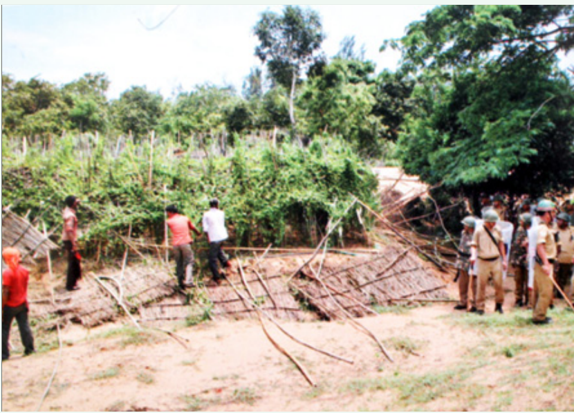
போஸ்கோ இரும்புச் சுரங்கத்தை அமைப்பதற்காக, ஓரிசாவின-குஜங்கா வட்டாரத்தில் அழிக்கப்படும் வெற்றிலைத் தோட்டங்கள்.

சந்தை விலைக்கு வாங்க வேண்டும்; நிலத்தை இழக்கும் குடும்பத்தைச் சேர்ந்த ஒருவருக்கு கார்ப்பரேட் நிறுவனங்கள் தமது திட்டத்தில் வேலைவாய்ப்பு அளிக்க முன்னுரிமை தர வேண்டும்; தமக்கு நிலத்தை விற்கும் விவசாயிகளைத் தமது திட்டத்தில் பங்குதாரராகச் சேர்த்துக் கொள்ள வேண்டும்; கார்ப்பரேட் நிறுவனங்களுக்கு நிலம் விற்கப்படுவதால், வேலையிழக்கும் விவசாயக் கூலிகள், கைவினைஞர்கள் ஆகியோருக்கும் நட்ட ஈடு வழங்க வேண்டும்'' என்றெல்லாம் பலவிதமான பொறிகள் இச்சட்டத்திருத்தத்தில் முன்வைக்கப்பட்டுள்ளன.