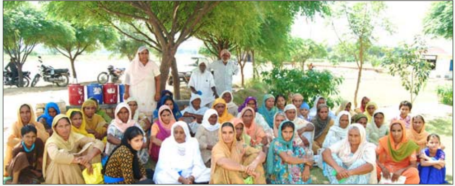
ஐக்கிய சீக்கியர்கள் எனும் தன்னார்வ அறக்கட்டளை நிறுவனம், தற்கொலை செய்து கொண்ட விவசாயிகளின் குடும்பத்துக்கு மனிதாபிமான அடிப்படையில் மாதந்தோறும் வழங்கும் கருணைத்தொகை ரூ.250 -ஐ வாங்கக் காத்திருக்கும் வறுமையில் வாடும் விதவைகள்.

பஞ்சாபின் 2009-10 பட்ஜெட்டின்படி, கிராமப்புற கடன் 35,000 கோடி ரூபாய் என்று மதிப்பிடப்பட்டுள்ளது. அதாவது, கிராமத்தில் வாழும் ஒவ்வொரு விவசாயிக்கும் ஏறத்தாழ ரூ.20,000 கடன் உள்ளது. கடன்சுமை, வட்டிச் சுமை தாளாமல் கூலி விவசாயி தற்கொலை செய்து கொண்ட அவலத்துக்குப் பின்னர், அக்கடனை அடைக்க வழிதெரியாமல் அவரது விதவை மனைவியும் குழந்தைகளும் படாதபாடு படுகின்றனர். அக்குழந்தைகள் பள்ளிக்குச் செல்ல முடியா