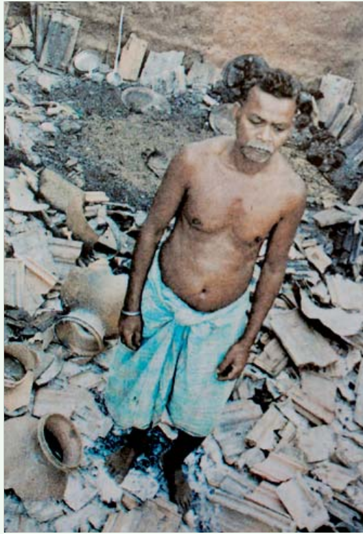
அரசு பயங்கரவாதப் படைகள் நடத்திய தாக்குதலில் அடித்து நொறுக்கப்பட்ட தனது வீட்டைக் கண்டு திகைத்துப் போய் நிற்கும் பாதிக்கப்பட்ட பழங்குடியின விவசாயி.