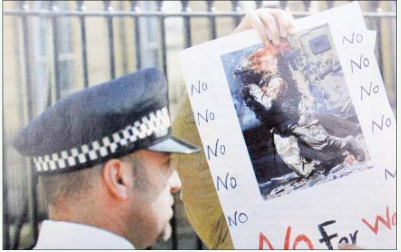
லிபியாவில் கடாஃபியின் ஆட்சியை அகற்றுவதற்காக நேடோ கூட்டணி நாடுகள் தொடுத்துள்ள போரைக் கண்டித்து, இலண்டன் மாநகரில் நடக்கும் போர் எதிர்ப்பு ஆர்ப்பாட்டம்.

இந்த ஏற்றத்தாழ்வான சமூக அமைப்பின் “அமைதி”யைப் பாதுகாப்பதற்காகவும், மக்கள் மத்தியில் வீசும் பாலஸ்தீன ஆதரவு, இசுரேல் எதிர்ப்பு உணர்வுகளை அடக்கி ஒடுக்கவும் கடந்த முப்பது ஆண்டுகளாக எகிப்து அவசர நிலைக் கொடுங்கோன்மையின் கீழ் இருத்தி வைக்கப்பட்டது. போலீசுக்கும் உளவு அமைப்புகளுக்கும் வரம்பற்ற அதிகாரம் தரப்பட்டு, மக்கள் நிரந்தரக் கண்காணிப்பின் கீழ் வைக்கப்பட்டனர். சாலையோரத் தடையரண்களும், தேடுதல் நடவடிக்கைகளும் எகிப்திய மக்களின் அன்றாட வாழ்வில் வாடிக்கையான நிகழ்ச்சிகளாக இருந்தன.