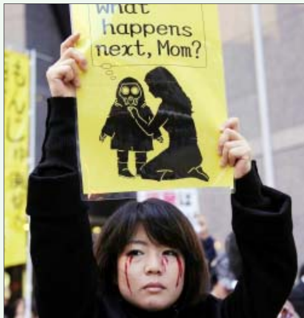
அணு மின்நிலையங்களை மூடக் கோரி ஜப்பான் தலைநகர் டோக்கியோவில் நடந்த ஆர்ப்பாட்டத்தில் கலந்து கொண்ட சிறுமி.

● கதிர்வீச்சு நிறைந்த பகுதியில் உள்ள வால்வுகளைக் கையாளுவதுகூட அபாயம் நிறைந்ததாகும். இப்