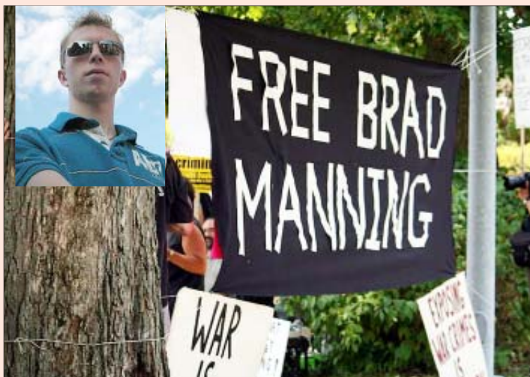
பிராட்லே மேனிங்கை விடுதலை செய்யக் கோரி அமெரிக்காவில் நடந்து வரும் பிரச்சார இயக்கம். (உள்படம்) பிராட்லே மேனிங்.

விக்கிலீக்ஸ் வெளியிட்ட அமெரிக்க இராணுவச் செய்திக் குறிப்புகள், அமெரிக்க இராணுவம் செய்து வரும் அட்டீழியங்களையும், மனித உரிமை மீறல்களையும் அம்பலப்படுத்திக் காட்டியுள்ளது. இவற்றை விக்கிலீக்ஸுக்குச் சேகரித்துக் கொடுத்த பிராட்லே மேனிங் என்ற அமெரிக்கர், அமெரிக்க அரசால் சிறை வைக்கப்பட்டுள்ளார். இவர் மீது ஏற்கனவே சுமத்தப்பட்டுள்ள பல்வேறு குற்றச்சாட்டுகளுடன், கடந்த மார்ச் மாதம் புதிதாக 22 குற்றச்சாட்டுகளைச் சுமத்தியுள்ளது, அமெரிக்க இராணுவம். அவற்றில் ஒன்று, எதிரிக்கு உதவி செய்வது என்ற பிரிவின் கீழ் வரும் குற்றச்சாட்டு. இதன்படி, அமெரிக்க இராணுவ இரகசியங்களை - தகவல்களை அமெரிக்காவின் எதிரிக்குக் கொடுத்துள்ளதாகக் குற்றம் சாட்டப்பட்டுள்ளார் மேனிங். எதிரி யாரென்று குற்றச்சாட்டில் குறிப்பிடப்படவில்லை.