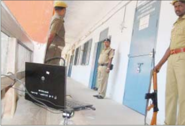
தேர்தலுக்குப் பின் வாக்குப்பதிவு இயந்திரங்கள் வைக்கப்பட்டுள்ள இடங்களில் துணை இராணுவப் படையின் பாதுகாப்பு உள்ளிட்டு நான்கு அடுக்கு பாதுகாப்பு: ஓட்டுச்சீட்டு ஜனநாயகத்தின் மீது மக்களுக்கு நம்பிக்கை ஏற்படுத்தும் முயற்சி.

ஆகியோருடன் கலந்தாலோசிக்க வைப்பது போன்ற நடவடிக்கைகள் வாயிலாக, தங்கள் மூலம்தான் அரசாங்கம் நடத்தப்படுகின்றது என்ற எண்ணத்தை வேர்மட்ட அளவில் ஏற்படுத்தி, மக்களை அரசியல் பக்கம் போகாமல் தடுக்கும் உலகவங்கி திட்டமும் நடைமுறைப்படுத்தப்படுகின்றது.