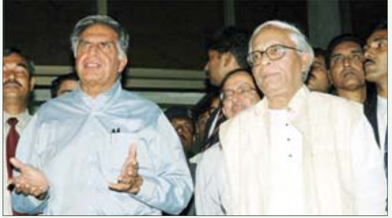
மேற்கு வங்க முதல்வர் புத்ததேவுடன் தரகு அதிகார வர்க்க முதலாளி ரத்தன் டாடா:

முந்தைய நரசிம்மராவ் ஆட்சியின் வழியில், மாடர்ன் பிரட், பால்கோ, வீ.எஸ்.என்.எல்., உள்ளிட்ட பல பொதுத்துறை நிறுவனங்கள் அடிமாட்டு விலைக்கு பா.ஜ.க. ஆட்சியில் தனியாருக்கு விற்கப்பட்டன. தொலைதொடர்புத் துறையில் நுழைந்திருக்கும் பன்னாட்டு நிறுவனங்களும், இந்தியத் தரகு முதலாளித்துவ நிறுவனங்களும் அரசுக்குச் செலுத்த வேண்டிய உரிமக் கட்டணத்தைக் குறைக்கும் வண்ணம் புதிய தொலைதொடர்புக் கொள்கை பா.ஜ.க. ஆட்சியில்தான் அறிவிக்கப்பட்டது. இந்தக் கொள்கையின்படிதான் 2ஜி அலைக்கற்றைகளை ஒதுக்கீடு செய்ததாக, அவ்வழல் தொடர்பாகக் கைது செய்யப்பட்டிருக்கும் ராஜா கூறிவருகிறார். எல்லாவற்றுக்கும் மேலாக, தனியார்மயம் என்பதுதான் தனது