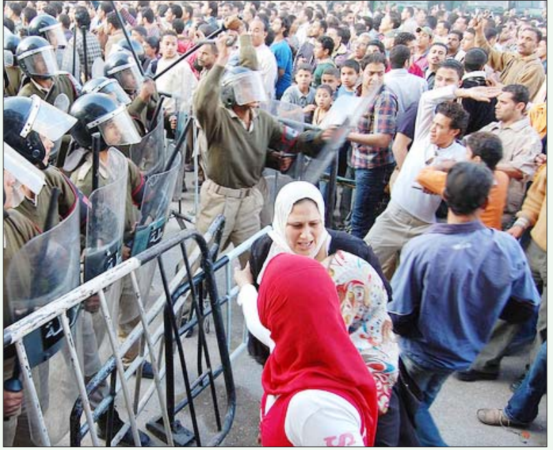
எகிப்தின் அல்-மஹல்லா நகரில் ஏப்ரல்-2008-இல் நடந்த தொழிலாளர் போராட்டத்தின்பொழுது கைது செய்யப்பட்ட முன்னணியாளர்களை விடுதலை செய்யக் கோரி, அந்நகர போலீசு நிலையத்தை முற்றுகையிட்டு ஆர்ப்பாட்டம் நடத்தும் தொழிலாளர்கள். (கோப்பு படம்)

நோக்கமும் அமெரிக்க நிதியுதவியின் பின் மறைந்திருந்தது. குறிப்பாக, சோவியத் சமூக ஏகாதிபத்தியம் உடைந்து சிதறி, பனிப்போர் காலக் கட்டம் முடிவுக்கு வந்த பின், எகிப்தில் தனியார்மயம் - தாராளமயத்தைத் தீவிரமாக அமல்படுத்த வேண்டும் என நிர்ப்பந்தித்தது, அமெரிக்கா. எகிப்திற்கும் சர்வதேச நாணய நிதியத்திற்கும் 1991 - ஆம் ஆண்டு கையெழுத்தான ஒப்பந்தப்படி, ரொட்டியைத் தவிர, பிற அத்தியாவசிய உணவுப் பொருட்களுக்கும் நுகர் பொருட்களுக்கும் வழங்கப்பட்டு வந்த மானியங்கள் வெட்டப்பட்டன; கார்ப்பரேட் நிறுவனங்கள் மீது விதிக்கப்பட்டு வந்த வரிகள் குறைக்கப்பட்டன; இறக்குமதிக்கும் அந்நிய முதலீட்டிற்கும் இருந்து வந்த வரம்புகளும் கட்டுப்பாடுகளும் தளர்த்தப்பட்டன; பொதுத்துறை நிறுவனங்களைத் தனியார்மயமாக்குவது, விவசாயத்தில் தனியார் முதலீட்டிற்கு இருந்து வந்த கட்டுப்பாடுகளை நீக்குவது, விவசாய விளைபொருட்களின்