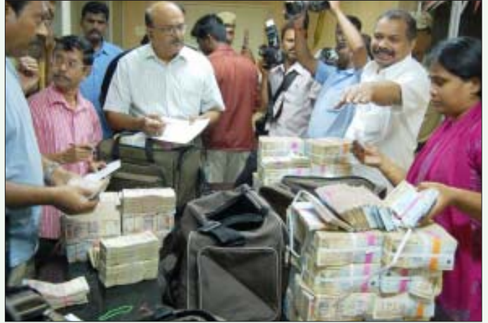
வாகனச் சோதனையில் கைப்பற்றப்பட்ட பணக்கட்டுகளுடன் தேர்தல் ஆணைய அதிகாரிகள்: பணப்பட்டுவாடாக்களைத் தடுக்க கடும் நடவடிக்கை எடுத்துக் கடமையாற்றுவதாகக் காட்டி ஏய்க்கும் நாடகம்.

தேர்தல் ஆணையம் தனது கடமையை பாரபட்சமின்றி செய்வதைப் பாராட்டாமல், அதிகப்படியான கெடுபிடிகள் காட்டுவதாக கருணாநிதி கூறுவது ஆச்சரியமளிக்கிறது, என்றது தினமணி. அனைத்து முதலாளித்துவ ஓட்டுக் கட்சிகளும் வாக்காளர்களுக்குப் பணம் கொடுத்தாலும் தி.மு.க. மீது மட்டும் குறிவைத்து பார்ப்பன ஊடகங்கள் குற்றம் சாட்டின. தேர்தல் முடிந்த பின்னர் ஜெயலலிதா விடுக்கும் அற்பத்தனமான ஆதாரமற்ற அவதூறு அறிக்கைகளைக்கூட ஊதிப் பெருக்கி, இடைப்பட்ட ஒரு மாத காலத்தில் தி.மு.க. எதிர்ப்புப் பிரச்சாரத்தை இந்த ஊடகங்கள் நடத்துகின்றன.