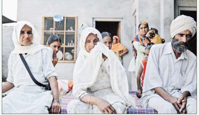
சங்ரூர் மாவட்டத்திலுள்ள லேக்லாகாகா கிராமத்தில் 2008-இல் தங்களது மகன்கள் கடன் சுமை தாளாமல் தற்கொலை செய்து கொண்ட கோரத்தை துக்கம் தாளாமல் விவரிக்கும் தாய்மார்கள்.

மருந்துகளின் விலை உயர்வு முதலான வற்றாலும் நிலம் மலடாகிவிட்டதாலும் விவசாயம் கட்டுபடியாகாமல் கடன் சுமை அதிகரித்து பஞ்சாபில் இன்று சிறு - நடுத்தர விவசாயிகள் தங்களது டிராக்டர் களை விற்று வருகின்றனர். கார்ப்பரேட் விவசாயத்தை அரசே ஊக்குவித்து ஆதரிப்பதால், சிறு - நடுத்தர விவசாயிகள் தமது துண்டு நிலங்களைத் தக்கவைத்துக் கொள்ள முடியாமல் தத்தளிக்கின்றனர். பெரும் பண்ணையாளர்களாக உள்ள நில மாபியாக்களும் மணல் மாபியாக்களும் தான் அரசியல் தலைவர்களாக உள்ளனர்.