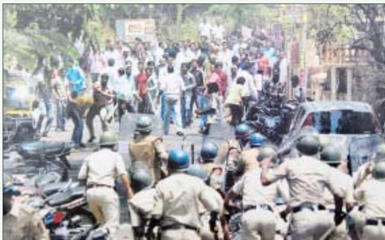
ஜெய்தாபூர் அணு மின்நிலையத் திட்டத்தை எதிர்த்து நடந்த போராட்டத்தில் போலீசு நடத்திய துப்பாக்கிச் சூட்டைக் கண்டித்து ரத்னகிரியில் நடந்த ஆர்ப்பாட்டத்தைத் தடியடி நடத்திக் கலைக்க முயலும் போலீசார்.

● ஏப்ரல் 7-ஆம் தேதி நிலவரத்தின்படி, ஃபுகுஷிமா மின்நிலையத்தில் இருந்த 21 ஊழியர்களுள் ஒவ்வொருவருமே 100 மில்லி சீவெர்ட்ஸ் அளவுக்கும் மேலான கதிர்வீச்சுக்கு ஆளாகியிருப்பது தெரியவந்துள்ளது. 100 மில்லி சீவெர்ட்ஸ் என்பது நெருக்கடி காலகட்டத்தின் கதிர்வீச்சளவாகும். இதற்கு இரண்டு வாரங்கள் முன்னதாக கதிர்வீச்சு நிறைந்த தண்ணீரில் இறங்கி வேலை செய்யுமாறு நிர்பந்திக்கப்பட்ட இரண்டு ஒப்பந்தத் தொழிலாளர்கள் கதிர்வீச்சினால் காயமடைந்தனர். கதிர்வீச்சின் பாதிப்பைக் குறைத்துக் காட்டுவதற்காகவே, தற்