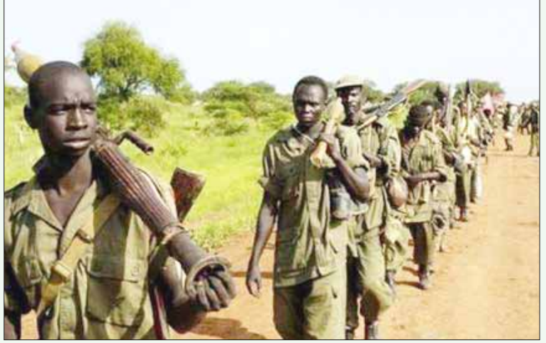
அமெரிக்க ஆதரவில், வடக்கு சூடானின் இஸ்லாமியப் பேரினவாதத்தை எதிர்த்துப் போரிட்ட தெற்கு சூடானின் மக்கள் விடுதலை இராணுவப் படை.

சூடான் அரசே அமெரிக்காவுக்கு விசுவாசமாக இறங்கி வந்த பிறகு, அதற்கெதிராக தெற்கு சூடானின் கலகப் படைகளுக்கு அமெரிக்கா ஆயுத உதவி செய்து சூடான் அரசை நிர்பந்திக்க வேண்டிய அவசியம் எழவில்லை. எனவே, சமரசத்துக்கு வருமாறு இரு தரப்பையும் அழைத்து தெற்கு சூடானைத் தனிநாடாக்கத் தீர்மானித்தது. மேலும், தெற்கு சூடானைவிட அதற்கு வடக்கேயுள்ள அபெய் மாகாணத்தில் தான் அதிக