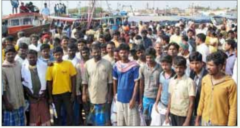
தமிழக சட்டமன்றத் தேர்தல் நெருங்குவதால், இந்திய - இலங்கை அரசுகளின் புதிய உத்தி: எல்லை தாண்டியதாகக் குற்றம் சாட்டிக்கைது செய்யப்பட்டு, பின்னர் விடுவிக்கப்பட்ட தமிழக மீனவர்கள்.

விசைப்படகுகளில் சென்று கடலில் வீசுகிற வலைகளைக் கடல் தன் நீரோட்டத்துக்கு ஏற்ப பல மைல் தூரம் இழுத்துச் சென்றுவிடுவதாகவும், இழுத்துச் செல்லப்படும் வலைகளை நீரோட்டத்தின் போக்கில் சென்றுதான் வெளியே எடுக்க முடியும் என்றும், பருவ நிலைக்கு ஏற்ப மாறும் இத்தகைய கடல் நீரோட்டங்கள், பாக். நீரிணையில் மட்டுமின்றி உலகெங்கும் உள்ள பிரச்சினைதான் என்றும் கூறுகின்றனர் தமிழக மீனவர்கள். இந்தியா - இலங்கைக்கு இடையிலான கடல் எல்லைகள் வரையறுக்கப்பட்டு அவை மீனவர்களுக்குப் புரியும் விதத்தில் தெளிவுபடுத்தப்படவில்லை என்றும், எல்லையை உடனே வரையறுக்க வேண்டும் என்றும் இந்திய நீதிமன்றங்களில் மனுக்கள் தாக்கல் செய்யப்பட்டிருக்கின்றன.