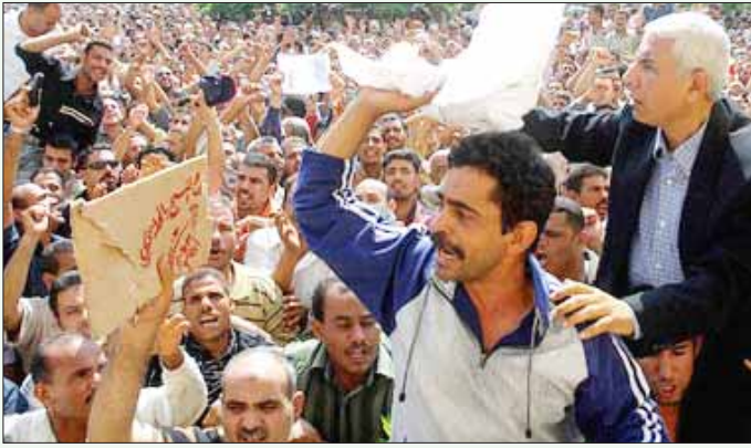
எகிப்தின் கஸ்ல் அல்-மஹல்லா என்ற நகரில் நடந்த, 10,000-க்கும் மேற்பட்ட தொழிலாளர்கள் பங்கு கொண்ட வேலைநிறுத்தப் போராட்டம். (கோப்புப் படம்)

டம் இரத்த வெள்ளத்தில் முழுகடிக்கப்பட்டாலும், மஹல்லாவைத் தொடர்ந்து எகிப்தின் பல பகுதிகளில் தனியார்மயக் கொள்கைக்கு எதிரான தொழிலாளர்களின் போராட்டங்கள் அலைஅலையாக எழுத தொடங்கின. இந்தப் போராட்டங்கள் அரசுக்கு எதிரான கலகமாக உருவெடுத்தால், எகிப்தின் இசுரேல் ஆதரவுக் கொள்கை, தனியார்மய ஆதரவுக் கொள்கைகளைப் பாதிக்காத வகையில் ஆட்சி மாற்றம் சுமுகமான முறையில் நடைபெற வேண்டும் என்பதில் அமெரிக்கா குறியாக இருந்தது.