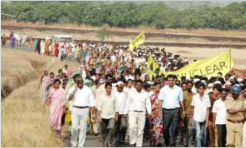
ஜெய்தாபூர் அணுமின் திட்டத்துக்கு எதிராக அறிவுத்துறையினரும் விவசாயிகளும் மீனவர்களும் இணைந்து நடத்திவரும் பிரச்சார இயக்கம்.

பட்ட கடற்வாழ் உயிரிகளும் ஒருசெல் உயிரி வகைகளும் நிறைந்துள்ள, உலகின் பல்லுயிரிப் பெருக்கக் கடற்பகுதிகளில் ஒன்றாக அறிவிக்கப்பட்டுள்ள கொங்கன் கடற்கரைப் பகுதியானது இத்திட்டத்தால் நாசமாகும். மேலும், நிலநடுக்க அபாயமுள்ள பகுதியில் இந்த அணுமின் திட்டம் நிறுவப்படுவதால் பெருந்த அபாயம் ஏற்படும் என்று சுற்றுச்சூழலாளர்களும் புவியியலாளர்களும் எச்சரிக்கின்றனர். இதுமட்டுமின்றி, மரபு ரீதியான அனல் மின் திட்டங்களை ஒப்பிடும்போது அணுமின் திட்டங்கள் மிக ஆபத்தானவை. அணுமின் திட்டத்தின் மூலம் பெறப்படும் மின்சாரம், நிலக்கரி மூலமாக அனல்மின் திட்டத்தின் மூலம் பெறப்படும் மின்சாரத்தின் அடக்கச் செலவைவிட 2 முதல் 3 மடங்கு அதிகமாகும் என அணு ஆயுதத்துக்குத் தடை மற்றும் அமைதிக்கான கூட்டமைப்பு விரிவாகப் பட்டியலிட்டுக் காட்டியுள்ளது.