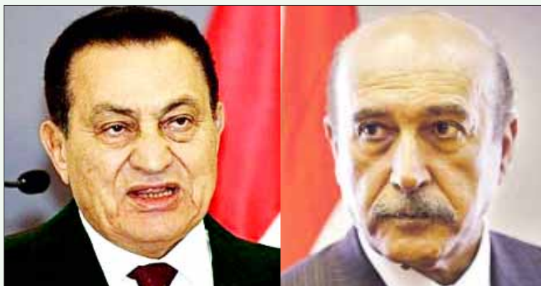
மக்களின் எழுச்சிக்குப் பிறகு அதிபர் பதவியில் இருந்து விலகிவிட்ட ஹோஸ்னி முபாரக் (இடது); முபாரக்கால் துணை அதிபராகப்பட்ட உளவுத்துறையின் தலைவர் ஓமர் லைமான்.

எகிப்தில் தேசியவாதியான நாசருக்குப் பின் பதவிக்கு வந்த அன்வர் சதாத், பாலஸ்தீனப் போராட்டத்துக்கு அளித்து வந்த ஆதரவைக் கைவிட்டு, அமெரிக்காவோடும், இசுரேலோடும் நெருக்கமான உறவுகளை வளர்த்துக் கொண்டார். இதன் பின், மேற்காசியாவில் இசுரேலுக்கு அடுத்து எகிப்துதான் அமெரிக்காவின் நம்பகமான கூட்டாளியாக மாறியது.