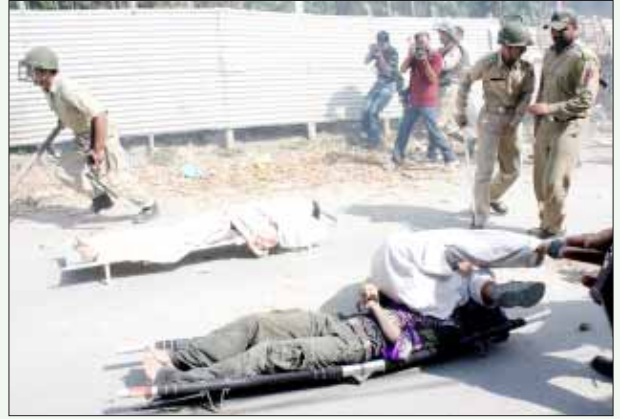
காஷ்மீரில் இராணுவம்-போலீ நடத்தும் படுகொலைகள் அனைத்தும் தேசிய ஒருமைப்பாட்டைப் பாதுகாப்பது என்ற பெயரில் நியாயப்படுத்தப்படுகின்றன.

நரசிம்ம ராவ், வாஜ்பாய், மன்மோகன் போன்ற இந்திய, இந்துத்துவ தேசியவாதிகள் தலைமையிலான அரசாங்கமும் அரசும் அமெரிக்க ஏகாதிபத்தியத்துக்கு நாட்டை அடிமையாக்கவும் அடகு வைக்கவும், தொடர்ந்து பல இராணுவ, அரசியல், பொருளாதார ஒப்பந்தங்கள் போட்டுள்ளன. அமெரிக்க எஜமானர்களால் எவ்வளவுமுறை அவமானப்படுத்தப்பட்டாலும் விசுவாச நாய்களைப் போல அவர்களின் கால்களை நக்குகின்றன. இந்திய அமைச்சர்களும் அதிகாரிகளும் அங்கே நிர்வாணமாக்கிச் சோதனையிடப்படுகிறார்கள். பெண்