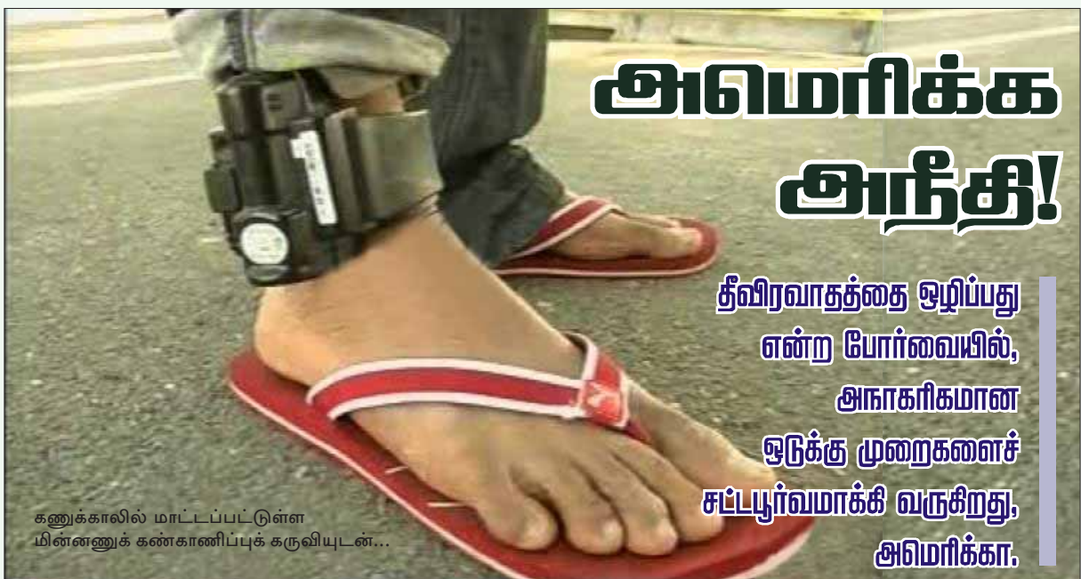
கணுக்காலில் மாட்டப்பட்டுள்ள மின்னணுக் கண்காணிப்புக் கருவியுடன்...