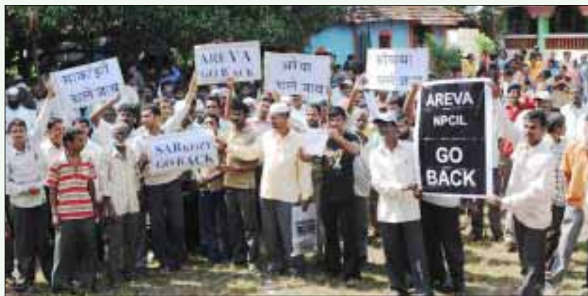
“அரிவா நிறுவனமே, இந்தியாவிலிருந்து வெளியேறு!” - அணுமின் திட்ட ஒப்பந்தம் போட பிரான்ஸ் அதிபர் இந்தியாவுக்கு வந்து போது, அதை எதிர்த்து நடந்த விவசாயிகளின் ஆர்ப்பாட்டம்.

நெருக்கடியிலிருந்து மீள போக்கு வரத்து, தொலைத்தொடர்பு, மேம்பாலங்கள், அணுமின் திட்டங்கள் முதலானவற்றை ஏகாதிபத்திய நிறுவனங்கள் ஏழை நாடுகளில் திணித்து வருகின்றன. சென்னையில் கூவம் ஆற்றின் மேலாக கட்டப்படும் அதிவிரைவு சரக்குப் போக்குவரத்துக்கான மேம்பாலத் திட்டமானது, உற்பத்திப் பொருட்களை ஏகாதிபத்திய நிறுவனங்கள் விரைவாக துறைமுகத்துக்குக் கொண்டு செல்வதற்காகவே அமைக்கப்படுகிறது. இது, தமிழகத்தின் தொழில் வளர்ச்சிக்கு அவசியமான திட்டமாகச் சித்தரிக்கப்பட்டு, -ற்றுக்கணக்கான கூவம் ஆற்றோரக் குடிசைவாழ் மக்கள் கட்டாயமாக விரட்டியடிக்கப்பட்டனர்.