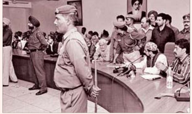
காஷ்மீர் பிரச்சினை குறித்து சண்டிகர் நகரில் நடந்த கருத்தரங்கில் நுழைந்த இந்துத்துவா கும்பல் வன்முறையில் இறங்கியதையடுத்து, போலீசு பாதுகாப்போடு அக்கருத்தரங்கில் உரையாற்றும் மீர்வாயில் உமர் பாருக் (வலமிருந்து இரண்டாவதாக அமர்ந்திருப்பவர்).

டெல்லிக்கு அடுத்து, ஓரிசா மாநிலத்திலுள்ள புலனேஷ்வர் நகரில் நடந்த காட்டு வேட்டைக்கு எதிரான கருத்தரங்கில் கலந்துகொள்ள வந்த அருந்ததி ராய்க்கு எதிராகக் கருப்புக் கொடி காட்டிய இந்துத்துவா கும்பல், அக்கருத்தரங்கை நடத்தவிடாமல் ரகனையிலும் இறங்கியது. இவ்வன்முறையில் ஐந்து பேர் காயமுற்றனர்.