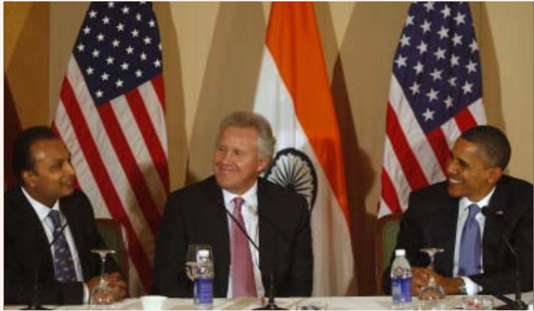
அமெரிக்காவின் ஜெனரல் எலக்ட்ரிக் நிறுவனத் தலைவர் ஜெப்ரி இம்மெல்ட், அமெரிக்க அதிபர் ஒபாமாவின் ரிலையன்சின் அனில் அம்பானி: அமெரிக்காவின் உலக மேலாதிக்கத் திட்டத்துக்குச் சேவை செய்து ஆதாயமடையத் துடிக்கும் முயற்சி.

முற்றாக அமெரிக்காவின் இரும்புப் பிடியில் சிக்கிக் கொள்ளும். அமெரிக்காவின் வால்மார்ட்டும், மான்சாண்டோவும், தீவட்டிக் கொள்ளை நிதி நிறுவனங்களும், டப்பா பல்கலைக் கழகங்களும் வரை முறையின்றி நாட்டைச் சூறையாடும். அமெரிக்காவின் அயல்பணி (அவுட்சோர் சிங்) களைச் செய்து வந்த இந்தியாவுக்கு இனி வரம்புகள் நீடிக்கும். இவை தவிர, இந்தியாவின் உள்கட்டமைப்பு வசதிகளை மேம்படுத்த இரு நாடுகளும் இணைந்து தனியார் பங்கேற்புடன் 1000 கோடி டாலர் தொகையுடன் நிதித் தொகுப்பு உருவாக்குவது, இந்தியாவின் உணவுப் பாதுகாப்பை உறுதி செய்ய நீடித்த பசுமைப் புரட்சிக்கு ஒத்துழைப்பு - என ஒபாமா வருகையையொட்டி ஒப்பந்தங்கள் கையெழுத்தாகியுள்ளன.