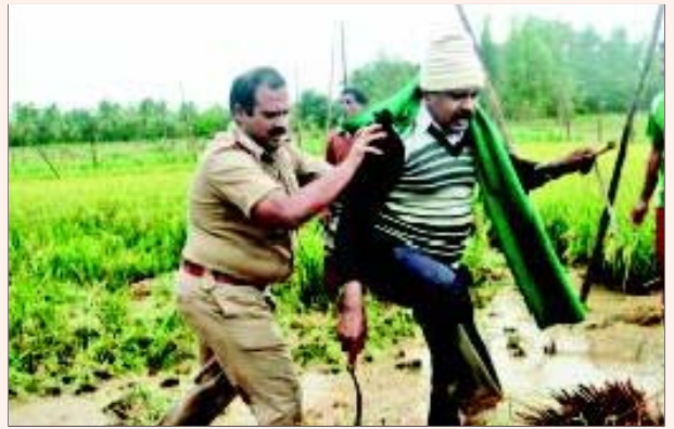
கர்நாடகாவில் மரபீணி மாற்றம் செய்யப்பட்ட நெல் ரகம் இரகசியமாகப் பயிரிட்டுப் பரிசோதித்துப் பார்க்கப்படுவதை எதிர்த்து நடந்த ஆர்ப்பாட்டம்.

போஸ்கோ திட்டம் நமது நாட்டின் இரும்புக் கனிம வளத்தைக் கொள்ளையடிப்பதற்கான திட்டம்தான் என்பது மேலும்மேலும் அம்பலமாகி வருகிறது. இப்படிப்பட்ட நிலையில் இத்திட்டத்திற்குக் கொடுக்கப்பட்ட அனைத்து அனுமதிகளையும் ரத்து செய்து, போஸ்கோவை நாட்டைவிட்டுத் துரத்துவதுதான் நாணயமிக்க செயலாக இருக்க முடியும். ஆனால், சுற்றுப்புறச் சூழல் அமைச்சகமோ இப்பிரச்சினையில் பாம்பும் சாகக் கூடாது, தடியும் நோக்கக்கூடாது என்ற நிலையில் உள்ளது. இதற்கு, போஸ்கோ திட்டம் பற்றி ஆராய நியமிக்கப்பட்ட கமிட்டியின் நான்காவது உறுப்பினர் அளித்த அறிக்கையைப் பயன்படுத்திக் கொள்ள முயலுகிறார், சுற்றுப்புறச் சூழல் அமைச்சர் ஜெய்ராம் ரமேஷ்.