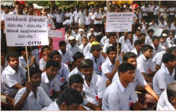
ஃபாக்ஸ்கான் நிர்வாகத்தின் அடக்குமுறை, தொழிலாளர் விரோதப் போக்குகளைக் கண்டித்து, அவ்வாலைத் தொழிலாளர்கள் காஞ்சிபுரத்தில் நடத்திய ஆர்ப்பாட்டம்.

இடத்தைக் கழுவி சுத்தம் செய்த பிறகு, தமிழக அரசு தொழிலாளர் நலத்துறை அதிகாரிகளை வைத்து ஒரு விசாரணையை நடத்தி முடித்து விட்டார்கள்.