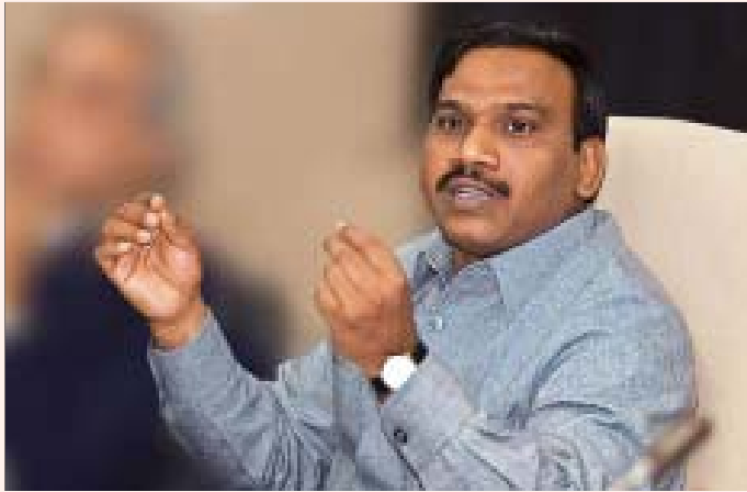
தனியார்மயக் கொள்ளையின் புதிய சாதனை: அரசுக்கு ரூ. 1,76,000 கோடி இழப்பை ஏற்படுத்திய 2 ஜி அலைக்கற்றை ஊழலில் சிக்கிப் பதவி பறிக்கப்பட்டுள்ள முன்னாள் மைய அமைச்சர் ராசா.

வேறு நிறுவனங்களுக்கு விற்றுக் கொள்ள தாராள அனுமதியும் அளித்தார். இந்தக் குற்றச்சாட்டுகளுக்கு ராசா இதுவரை பதிலளிக்கவில்லை. இதில் ராசாவும் ராசாவுக்குப் பின்னால் உள்ளவர்களும் ஆதாயமடைந்தது எத்தனை கோடிகள் என்பதும் இதுவரை தெரியவில்லை.