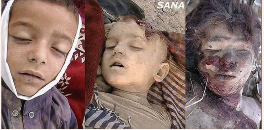
அமெரிக்கா, வடக்கு வலரிஸ்தான் பகுதியில் நடத்திய ஆளில்லா விமானத் தாக்குதலில் கொல்லப்பட்ட குழந்தைகள்.

இவ்வாறு வெளிப்படையாக அப்பாவிக்களைக் கொன்று குவித்தது மட்டுமல்லாமல், மக்களிடையே பிரிவினையைத் தூண்டி நிரந்தரமாக அவர்களை மோதவிடும் சதியையும் அமெரிக்கா செய்து வருகிறது. ஈராக்கில் சியா, சன்னி பிரிவினரிடையே பகைமையைத் தூண்டும் வகையில் சன்னி பிரிவினரின் மீது தாக்குதல்களைக் கட்டியமைத்துள்ளது. பாக்தாத் நகரின் சேரிகளிலிருந்து பொறுக்கியெடுக்கப்பட்ட சியா பிரிவு குண்டர்களைக் கொண்டு “ஓநாய் படை” என்ற கொலைகாரப் படையை உருவாக்கி, சன்னி பிரிவினரின் மீது தாக்குதல் தொடுத்து, கலவரங்களைத் தூண்டி வருகிறது. இலத்தின் அமெரிக்க நாடுகளில் செய்ததைப் போன்று இப்படையினருக்கும் சித்தரவதை செய்வதற்குத் தனியாகப் பயிற்சி கொடுத்து வளர்க்கிறது.