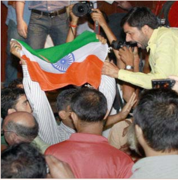
டெல்லியில் நடந்த காஷ்மீர் பிரச்சினை குறித்த கருத்தரங்கில் புகுந்து வன்முறையில் ஈடுபடும் இந்துத்துவா குண்டர்கள்.

கள் என்ற பெயரில் பன்னாட்டு நிறுவனங்களுக்கு இந்தியாவைப் பகுதிபகுதியாக ஆட்சியாளர்கள் பட்டா போட்டுக் கொடுப்பதைக் காட்டிலும், காஷ்மீர் மக்களுக்கு சுயநிர்ணய உரிமை அளிக்க வேண்டும் எனக் கோருவது எந்த விதத்தில் தேசத் துரோகமாகிவிடும்?