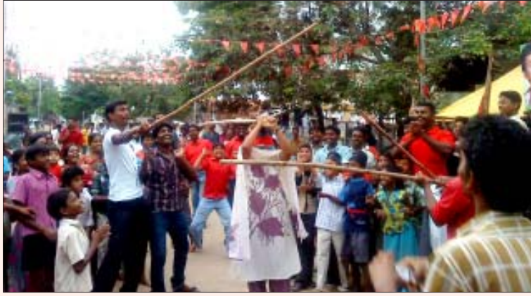
2-ஆம் பக்கத் தொடர்ச்சி

வெடித்து, தோழர் லெனின் படம் அச்சிடப்பட்ட வாழ்த்து அட்டையுடன் இனிப்புகள் வழங்கி செங்கொடியேற்றும் நிகழ்ச்சியைத் தொடர்ந்து, இரு சக்கர வாகனங்களில் முழக்கமிட்ட படியே முக்கிய வீதிகள் வழியாக வந்து தியாகத் தோழர் பீட்டர் இல்லத்திலும், பர்மா காலனி, கீழ்வாசல் ஆகிய இடங்களிலும் கொடியேற்றப்பட்டது. மாலையில் வடக்கு வாசல் சமுதாயக் கூடத்தில் முன்னணியாளர்கள் சிறப்புரையாற்றினர். இசைச் சித்திரம், மாவீரன் பகத்சிங் நாடகம் ஆகியவற்றோடு, பொதுவுடமை இயக்கத்தின் மூத்த தோழரும் லாவணி இசைக் கலைஞருமான தோழர் காதர் பாடிய பாடல்கள் நிகழ்ச்சிக்கு எழுச்சியூட்டின.