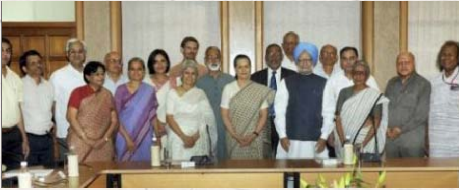
உணவுப் பாதுகாப்புச் சட்டத்தை உருவாக்கி வரும் தேசிய ஆலோசனை கவுன்சில் உறுப்பினர்களுடன் சோனியாவும் மன்மோகன் சிங்கும்: காங்கிரசின் இரட்டை வேடம்.

ஒழித்துக் கட்ட வேண்டும்; அல்லது அவற்றின் எண்ணிக்கையைக் கணிசமாகக் குறைக்கும் வண்ணம் வருமான வரம்பு நிர்ணயிக்க வேண்டும்” என்ற ஆலோசனையும் வழங்கப்பட்டுள்ளது. வெளித் தோற்றத்தில் பட்டினி கிடக்கும் ஏழைகளுக்கு ஆதரவாகப் பேசுவது போலத் தெரியும் இந்த உத்தரவு, உண்மையில் உணவு வழங்கல் கொள்கையில் உலக வங்கியின் கட்டளைகளை விரைவாக நடைமுறைக்குக் கொண்டு வரவேண்டும் என்ற கண்ணோட்டத்தின் அடிப்படையில்தான் வழங்கப்பட்டுள்ளது என்பதற்கு இந்த ஆலோசனையே சாட்சி. உச்ச நீதிமன்றத்தின் உத்தரவிலுள்ள இந்த ஆலோசனையை டாக்டர் மன்மோகன் சிங் புறக்கணிக்க மாட்டார் என்று அடித்துக் கூறலாம்.