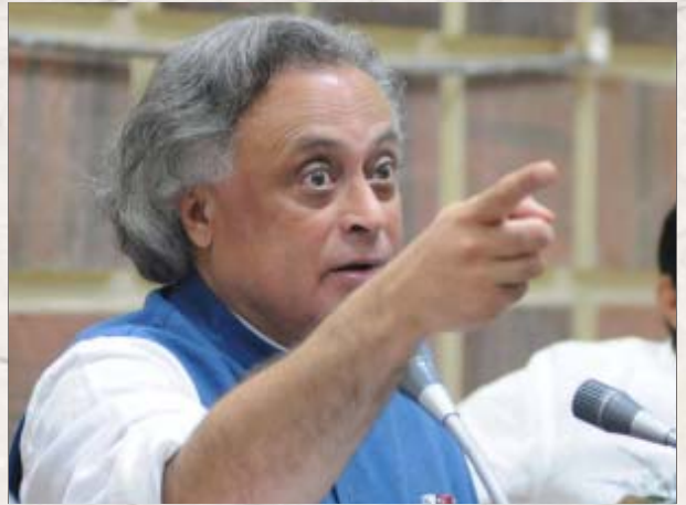
வேதாந்தா பாக்கைட்டை வெட்டி எடுப்பதற்குத் திடீர்த் தடை விதித்துள்ள சுற்றுப்புறச் சூழல் அமைச்சர் ஜெய்ராம் ரமேஷ்.

வேதாந்தாவுக்கு எதிரான வழக்கில் ஒரு மனுதாரராக சேர்ந்துகொள்வதற்குக் கூட அந்த மண்ணின் மைந்தர்களான பழங்குடியினருக்கு எவ்வித உரிமையும் இல்லை என்று கூறி பழங்குடி மக்களை அந்த வழக்கிலிருந்தே வெளியேற்றினார் உச்ச நீதிமன்றத்தின் தலைமை நீதிபதி கே.ஜி.பாலகிருஷ்ணன். அப்போது பழங்குடி மக்களின் பாரம்பரிய வாழ்விட உரிமை அரசியல் சட்டத்திலிருந்து எங்கே காணாமல் போயிருந்தது? இந்த வழக்கை விசாரித்த உச்ச நீதிமன்ற நீதிபதி கபாடியா, நியம்கிரியின் கோண்டு இன மக்களை, புல்லைத் தின்னும் பழங்குடிகள் என்று திமிர்த்தனமாக ஒரு கூட்டத்தில் பேசியபோதும், “நான் ஸ்டெர்லைட் நிறுவனத்தின் பங்குதாரர்” என்று நீதிமன்றத்தில் பகிரவ்