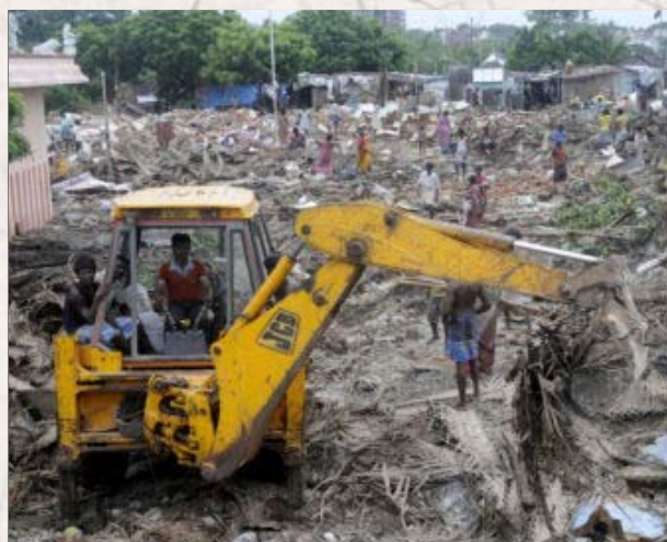
சென்னையில் அமைக்கப்பட்டு வரும் மெட்ரோ ரயில் திட்டத்திற்காக, சைதாப்பேட்டையில் அடையாறு கரையோரமிருந்த குடிசைகள் இடித்துத் தள்ளப்படுகின்றன.

“அரசு நிர்வாகத்தின் செயல்திறனை இவ்வாறு அதிகரிக்க வேண்டுமானால், அரசு நிர்வாகப் பணிகளில் அவுட் சோர்சிங் முறையை அறிமுகப்படுத்த வேண்டும். அரசு நிர்வாகத்தில் மட்டுமின்றி, கல்வி, சுகாதாரம் போன்ற துறைகளிலும், உள்கட்டுமானத் துறையிலும் தனியார் துறையுடன் கூட்டு அமைத்துக் கொண்டால் மட்டுமே இந்தக் கட்டுமானங்களை உருவாக்குவதற்கான மூலதனத்தை அரசாங்கத்தால் பெறமுடியும்” என்றும் வலியுறுத்துகிறது, அந்த அறிக்கை.