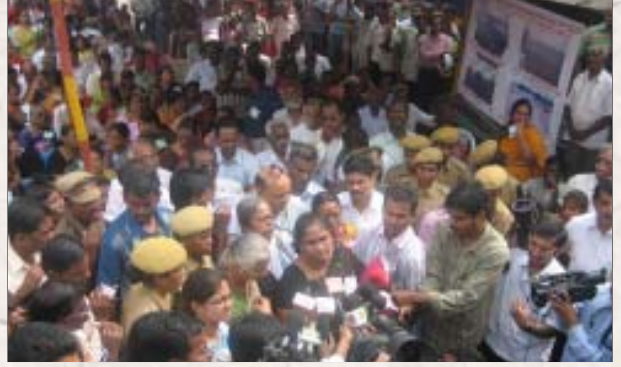
சென்னை மீனம்பாக்கம் விமான நிலையத்தை விரிவுபடுத்தும் திட்டத்தால் பாதிக்கப்படும் மக்கள், அத்திட்டத்தை எதிர்த்து நடத்திய ஆர்ப்பாட்டம். (கோப்பு படம்)

தனியார்மய, தாராளமய நடவடிக்கைகளுக்கு மக்கள் காட்டும் எதிர்ப்பைத் தேர்தலில் அறுவடை செய்வதற்காக ஓட்டுக்கட்சிகள் அவ்வப்போது நடத்தும் போராட்டங்கள் எதுவும் இந்தச் செல்வழியை மாற்றிவிட்ட போவதில்லை. ஸ்ரீபெரும்புதூர் விமானநிலைய விரிவாக்கம், மதுரவாயல் சாலைத் திட்டம் போன்றவற்றுக்கு விவசாயிகளும் குடிசைவாழ் மக்களும் எதிர்ப்பு தெரிவிப்பதனால், அவை தொடர்பாக தி.மு.க. அரசை எதிர்த்த ஆர்ப்பாட்டங்களை அ.தி.மு.க. நடத்தியிருக்கிறது.