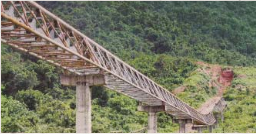
வேதாந்தா நிறுவனம் ஓரிசாவின் லாஞ்சிகர் வனப்பகுதியில் எவ்வித முன் அனுமதியும் பெறாமல், பாக்கைத் தாதுவை எடுத்துச் செல்வதற்காகக் கட்டியுள்ள “கன்வேயர் பெல்ட்”.

மூடி மறைக்க முடியாத அளவிற்கு வேதாந்தாவின் மோசடிகளும், காங்கிரசு அரசின் முறைகேடுகளும் அம்பலமாகிவிட்டன. வேதாந்தாவுக்கு ஆதரவாகத் தீர்ப்பு வழங்கிய உச்ச நீதிமன்ற நீதிபதிகளின் யோக்கியதையே சந்தி சிரித்துக் கொண்டிருக்கிறது. போதாக்குறைக்கு வேதாந்தா நிறுவனம் ‘கேய்ன்ஸ்’ என்னும் எரிசக்தித் துறை பன்னாட்டு நிறுவனத்தை வாங்கி, இந்தியாவின் எரிசக்தித் துறையையே தனது ஏகபோகத்தின் கீழ் கொண்டுவர விரும்பும் முகேஷ் அம்பானியோடு உரசியிருப்பதால், காங்கிரசு அமைச்சரவையில் நிறைந்திருக்கும் அம்பானி பக்தர்களுக்கும் நியம்கிரியின் பழங்குடி மக்கள் மீது அபிமானம் பிறந்து விட்டது. அனைத்துக்கும் மேலாக, பன்னாட்டு நிறுவனங்கள் மற்றும் தரகு முதலாளிகளுக்காக சிதம்பரம் நடத்திவரும் காட்டு வேட்டை, பழங்குடி மக்களை மென்மேலும் மாவோயிஸ்டுகளின் பக்கம் தள்ளிவிடுமோ என்ற அச்சமும் ஆளும் வர்க்கத்தைப் பிடித்தாட்டுகிறது.