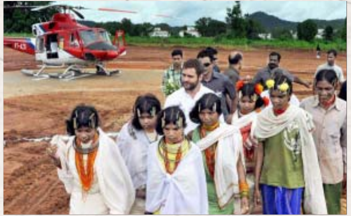
வேதாந்தா நிறுவனத்தின் பாக்கைட் சுரங்கத்திற்குத் தடை விதிக்கப்பட்ட பின், கோந்த இன மக்கள் வசிக்கும் பகுதிக்குத் திடீர் விஜயம் செய்த ராகுல் காந்தி.

கும் மூத்த சிப்பாய் மன்மோகன் சிங், “சுற்றுச் சூழல் சுற்றுச்சூழல் என்று பேசிக்கொண்டு, வறுமை ஒழிப்பு இலட்சியத்தை நாம் கைவிட்டு விட முடியாது” என்கிறார். வறுமையை ஒழிக்க வேண்டுமென்றால் பழங்குடி மக்களின் காடுகளையும் நிலங்களையும் பிடுங்கி பன்னாட்டு நிறுவனங்கள் -தரகு முதலாளிகளிடம் ஒப்படைக்க வேண்டும் என்பது மூத்த சிப்பாயின் கொள்கை. மூத்த சிப்பாய் பேசுவதைப் பற்றி இளைய சிப்பாய் பேச மறுக்கிறார்.