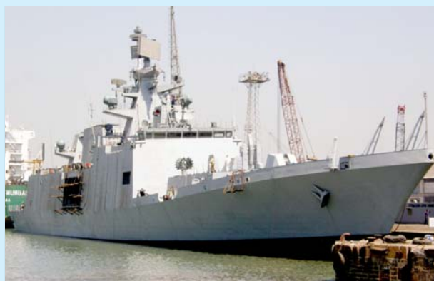
அமெரிக்காவின் அடியாள் வேலைக்குப் பிராந்திய மேலாதிக்க வல்லரசான இந்திய அர உருவாக்கியுள்ள அதிநவீன போர்க் கப்பல் ஐ.என்.எஸ்.ஷிவாலிக்.

தமது விரிவாக்க மேலாதிக்க நோக்கங்களை நிறைவேற்றிக் கொள்ளவும் பொருளாதார நலன்களைத் தக்கவைத்துக் கொள்ளவும் இந்தியத் தரகுப் பெருமுதலாளிகள்