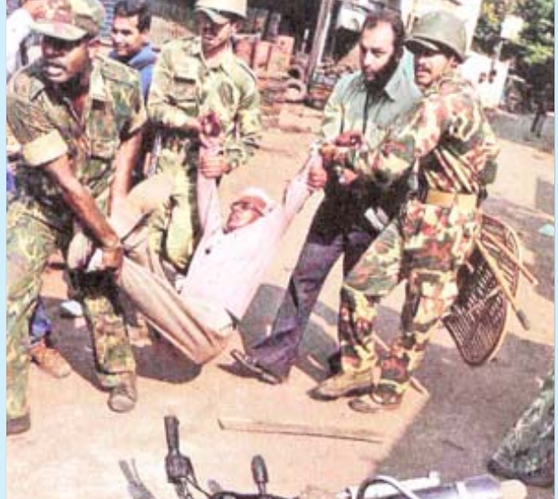
பழைய ஐதராபாத்திலுள்ள சித்தியாம்பர் பஜாரில் இந்து-மு லீம் மதவெறியர்களுக்கு இடையே நடந்த கல்லடிச் சண்டையில், தலையில் கல்லடிபட்ட முதியவரைத் தூக்கிச் செல்லும் அதிரடிப்படை போலீசார்.

இந்நிலையில், முஸ்லிம்களை தம் பின்னே மதரீதியாக அணிதிரட்டிக் கொள்ளவும், தனது ஓட்டு வங்கியைத் தக்கவைத்துக் கொள்ளவும் பொருத்தமான வாய்ப்பை எதிர்பார்த்து காத்திருந்தது, எம்.ஐ.எம். கடந்த