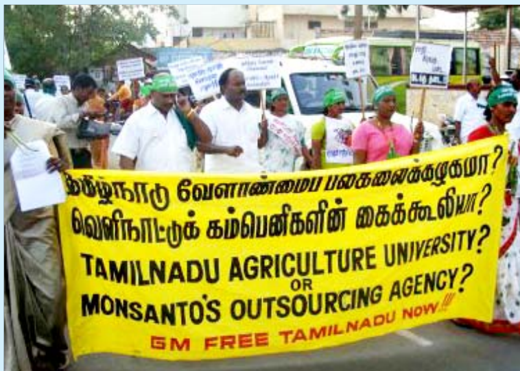
தமிழ்நாடு வேளாண் பல்கலைக்கழகம் மரபணு மாற்றம் செய்யப்பட்ட மக்காச்சோளத்தை அறிமுகப்படுத்துவதைக் கண்டித்து தமிழ்நாடு வணிகர் சங்கமும், விவசாய சங்கங்களும் இணைந்து கடந்த ஆண்டு கோவையில் நடத்திய ஊர்வலம். (கோப்புப் படம்).

இப்பல்கலைக்கழகம் போர்டு, ராக்பெல்லர் பவுண்டேசன் முதற்கொண்டு 45-க்கும் மேற்பட்ட பன்னாட்டு அமைப்புகளுடன் நெருங்கிய உறவு கொண்டுள்ளது. 2004 - 2005-இல் மட்டும் 45 ஆராய்ச்சிக்குப் பன்னாட்டு அமைப்புகளிடமும், 107 ஆராய்ச்சிக்குத் தனியார் ஏக போக முதலாளிகளிடமும் நிதி வாங்கியுள்ளது. (ஆதாரம்: 100-வது ஆண்டு மலர்). இவற்றில், அமெரிக்கா நிதி உதவி நிறுவனம் மட்டுமே சுமார் 8 கோடி ரூபாய்