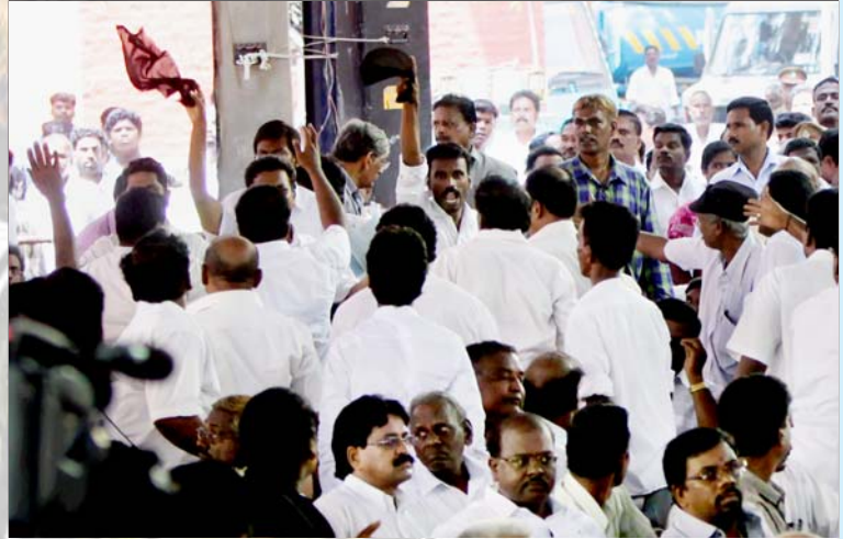
“குற்றவாளி போலீசைப் பாதுகாக்கும் கருணாநிதியே திரும்பிப் போ!” என்ற முழக்கத்துடன் கருப்புக் கொடி காட்டும் போராட்டத்தில் வழக்குரைஞர்கள்.

இக்கொலைவெறித் தாக்குதலைக் கண்டித்தும் தி.மு.க. ரவுடிகள் மீது நடவடிக்கை எடுக்கக் கோரியும் 27.4.10 அன்று பிற்பகலில் நீதிமன்ற வளாகத்தில் பெருந்திரளான வழக்குரைஞர்கள் ஆர்ப்பாட்டம் செய்தனர். இதைத் தொடர்ந்து, உயர்நீதி மன்றத்தில் வெறியாட்டம் போட்ட போலீசுக்கு அரணாக நிற்கும் தமிழக முதல்வருக்குக் கருப்புக் கொடி காட்டிய வழக்குரைஞர்கள் மீது, தி.மு.க. ரவுடிகளை ஏவி கொலைவெறித் தாக்குதல் நடத்தியதை எதிர்த்து, சென்னை உயர்நீதி மன்றம் எதிரே யுள்ள ஓய்.எம்.சி.ஏ. அரங்கில் 29.4.10 அன்று கண்டனக்