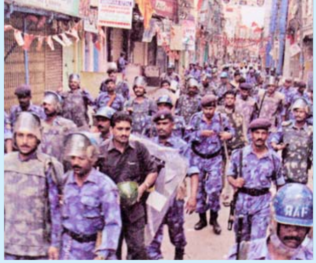
ஐதராபாத்திலுள்ள பேகம் பஜாரில் பல கடைகளும் வாகனங்களும் தீக்கிரையாக்கப்பட்ட பின், அப்பகுதியில் குவிக்கப்பட்டுள்ள அதிவிரைவு அதிரடிப் போலீசார்.

கள், பேரணிகள் என போட்டிபோட்டுக் கொண்டு அமர்க்களப்படுத்தின. ஐதராபாத் மாநகராட்சியில் ஒரு இடத்தை மட்டுமே கைப்பற்றியுள்ள பா.ஜ.கட்சி, மதக் கலவரத்தின் மூலம் எம்.ஐ.எம். கட்சியை முடக்கவும், முஸ்லிம்களை அச் சூழ்ந்தி தனது ஓட்டு வங்கியை விரிவுபடுத்திக் கொள்ளவும் திட்டமிட்டே இத்தகைய எதிர் நடவடிக்கைகளில் இறங்கியது. பச்சைக் கொடிகள்-பதாகைகளை கிழித்தெறிந்துவிட்டு காவிக் கொடிகளை இந்து வெறியர்கள் ஏற்றத் தொடங்கியதும், மதன்னா பேட்டையில் தகராறு மூண்டு, பின்னர் இரு மதங்களின் பெரியோர்களும் போலீஸ் சமரசம் பேசி பிரச்சினையைத் தீர்த்தனர். பின்னர், அனுமார் ஜெயந்தியை ஓட்டி இந்து வெறியர்கள் மீண்டும் பச்சைக் கொடிகளைக் கிழித்து காவிக் கொடியேற்றியதையொட்டி, மார்ச் 27 அன்று மூசா பௌவலி பகுதியில் தகராறு மூண்டு, அதிலிருந்து கலவரத் தாக்குதல் பரவத் தொடங்கியது.