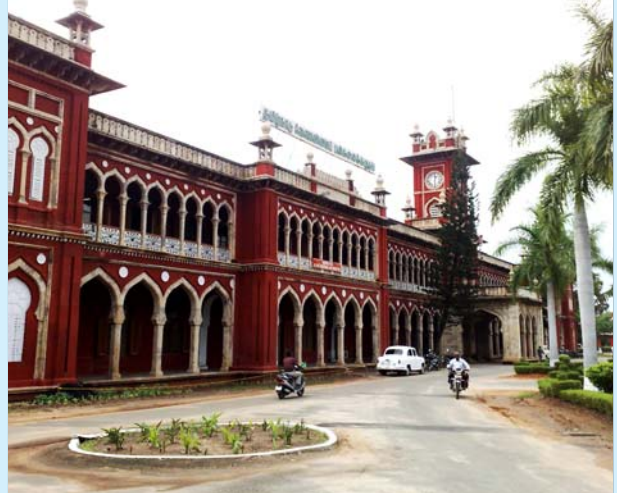
கோவையிலுள்ள தமிழ்நாடு வேளாண் அறிவியல் பல்கலைக்கழகம்: ஏகாதிபத்தியக் கைக்கூலி நிறுவனம்.

மறுபுறம், உற்பத்திப் பொருட்களைக் கொள்முதல் செய்வது என்ற பெயரில் சில்லறை வியாபார நிறுவனங்களுடன் இத்திட்டம் இணைக்கப்பட்டது. இதில் ரிலையன்ஸ் பிரிஷ், பாரதி, ஆதித்யா பிரிவா முதலான தரகுப்