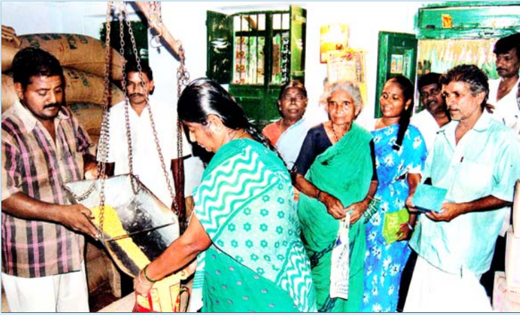
அனைவருக்குமான பொது விநியோக முறையைக் கொல்லைப்புற வழியாக நீக்கிவிட முயலுகிறது, தேசிய உணவுப் பாதுகாப்புச் சட்டம்.

கொண்டு வர வேண்டும் என்றும் இவர்கள் கோரி வருகின்றனர். ஆனால், மைய அரசோ இக்கலோரியின் அளவை 1,700 எனத் தீர்மானித்திருப்பதன் மூலம், பல்லாயிரக்கணக்கான மக்களை இச்சட்டத்தின் கீழ் வருவதில் இருந்து அப்புறப்படுத்திவிட்டது.