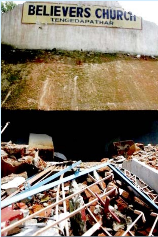
இந்துவெறி பாசிசப் பயங்கரம்: தரைமட்டமாக்கப்பட்ட கிறித்துவ தேவாலயம்.

விட்டார்' என்றே பதிவு செய்துள்ளனர். மேலும், சாட்சிகள் மிரட்டப்படுகிறார்கள் என்று முறையிடப்பட்டதை நீதிமன்றம் கண்டுகொள்ளவேயில்லை. பொடிமுண்டா கிராமத்தில் வழக்குகளைத் தொடர்ந்து முன்னெடுத்த கிருத்துவர்களைத் தாக்கி, அகதிகளாக அவலத்தில் உழன்ற அவர்களின் பிளாஸ்டிக் குடில்களை ஆர்.எஸ்.எஸ். கிரிமினல்கள் கிழித்தெறிந்துள்ளனர். அந்த ஊர் போலீ ஆய்வாளரோ ஆர்.எஸ்.எஸ்.க்காரர்கள் மீது எந்த வழக்கு போட்டாலும் அவர்கள் வெளியே வந்துவிடுகிறார்கள் என்று கூறி கையை விரிக்கிறார். இந்து வெறியர்கள் எதிர்பார்த்தபடியே பொடிமுண்டா கிராம வழக்குகள் நீதிமன்றத்தால் கைவிடப்பட்டன.