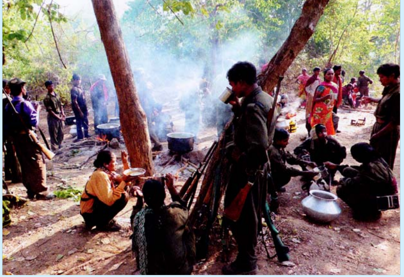
தண்டேவாடா காடுகளில் அமைந்துள்ள மாவோயிஸ்டு கட்சியின் மக்கள் கொரில்லா விடுதலைப் படையின் தற்காலிக முகாம்.

ஆண்டில் மட்டும் மாவோயிஸ்டுகளின் செல்வாக்குள்ளதாகக் கூறப்படும் பகுதிகளில் 589 சிவிலியன் மக்களை அரசுப் படைகள் கொன்று போட்டிருக்கின்றன; சிறுவர்களின் விரல்களை வெட்டிப் போட்டுள்ளனர்; பெண்ணின் மார்பகத்தை அறுத்து வீசியுள்ளனர்; இதைவிடக் கொடூரம் - காட்டுமிராண்டித்தனம் என்ன இருக்க முடியும்! சட்டிஸ்கரின் பஸ்தார் பிராந்தியத்தில் மட்டும் வீடுகளைச் சூறையாடியும், இடித்துத் தள்ளியும், தீயிட்டுக் கொளுத்தியும் 700 பழங்குடி கிராமங்களைச் சுடுகாடுகளாக்கி விட்டனர்.