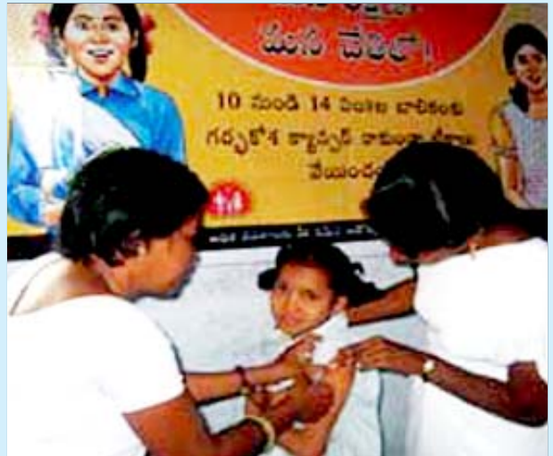
பரிசோதனை எலிகள்: இளஞ்சிறுமிக்கு போடப்படும் கருப்பை புற்றுநோய்த் தடுப்பூசி.

கம்மம் மாவட்டத்தில் பழங்குடி மாணவிகளுக்கான லெச்சுமிநகர் உறைவிடப் பள்ளி விடுதியில் தங்கிப் படித்து வந்த 278 மாணவிகளுக்கு இந்தத் தடுப்பூசி போடப்பட்டது. தடுப்பூசி போட்டுக்கொண்ட பழங்குடிச் சிறுமிகள் 3 பேர்கள், மருந்தின் பக்கவிளைவுக்குப் பலியாகியுள்ளனர். மிகவும் பின்தங்கிய மக்களிடையே