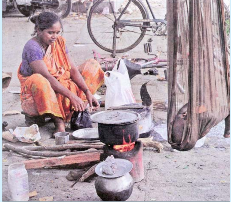
கிராமப்புறங்களில் இருந்து வேலை தேடி நகரத்திற்கு வந்து, நடைபாதையில் வசித்து வரும் கூலித் தொழிலாளர்களுக்கு நிரந்தர முகவரியில்லை என்ற காரணத்தைக் கூறி, குடும்ப அட்டைகள் வழங்க மறுத்து வருகிறது, அரசு.

இந்தியாவில் வசிக்கும் ஏழைக் குடும்பங்களின் எண்ணிக்கை 6.5 கோடியா, 8.5 கோடியா அல்லது அதற்