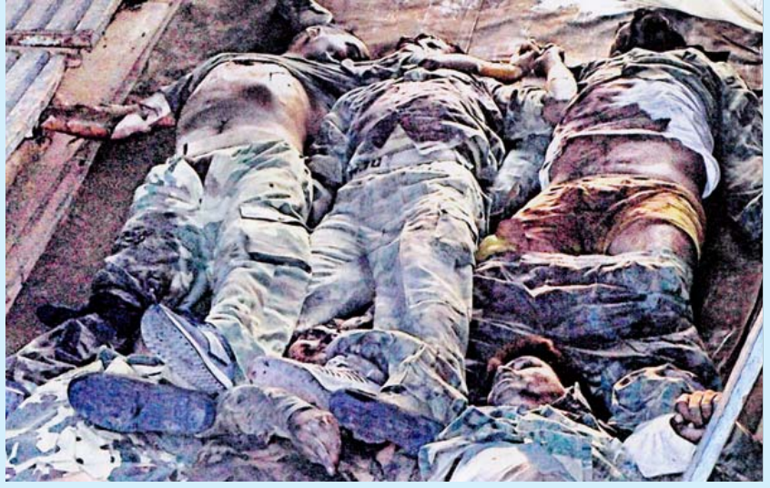
மாவோயிஸ்டுகள் சிந்தல்நாடு பகுதியில் நடத்திய தாக்குதலில் கொல்லப்பட்ட துணை இராணுவப்படை சிப்பாய்களின் சடலங்கள்.

தந்தாங்கிய படைகளுக்குச் சமமாக அவற்றைக் கட்டியெழுப்பவேண்டும்; ஆயுதந்தாங்கிய கலகக்காரர்கள் எப்போதும் தாக்குதல் நிலையில் இருக்கும் போது, இராணுவ அதிகாரிகளைக் கொண்டு, இராணுவத்தைப் போலவே துணை இராணுவப் படைகளைத் தயாரிக்க வேண்டியது அவசர அவசியமாகி விட்டது; கலகக்காரர்களை ஒடுக்குவதற்கு என்றே தனிப்பயிற்சி பெற்ற துணை இராணுவப் படைகளை உருவாக்க வேண்டும்” என்று ஆளும் வர்க்க அறிவுஜீவிகள் ஆட்சியாளர்களுக்கு உபதேசங்கள் செய்கின்றனர்.