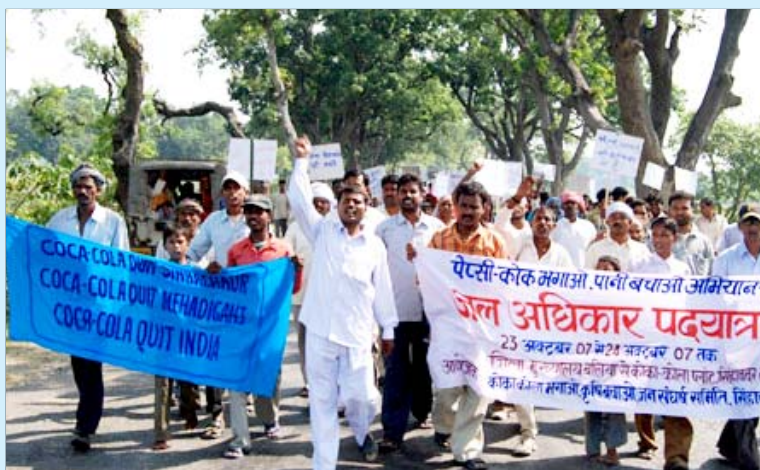
தங்களது நிலத்தையும், நீரையும் மாபடுத்தும் கோக்கை இந்தியாவில் இருந்தே துரத்தியடிக்கக் கோரி, உ.பி.யின் பாலியா மாவட்டத்திலுள்ள சின்ஹாசாவர் கிராம மக்கள் நடத்தும் ஆர்ப்பாட்ட போரணி. (கோப்பு படம்).

பிளாச்சிமடா மக்களின் போராட்டத்திற்குக் கிடைத்த இந்த வெற்றியைச் செயல்படுத்த வேண்டும் என்றால் கூட, கோக்கிற்கு எதிராக நடந்துவரும் இப்போராட்டத்தை இன்னும் தீவிரமாக நடத்த வேண்டியிருக்கும்.