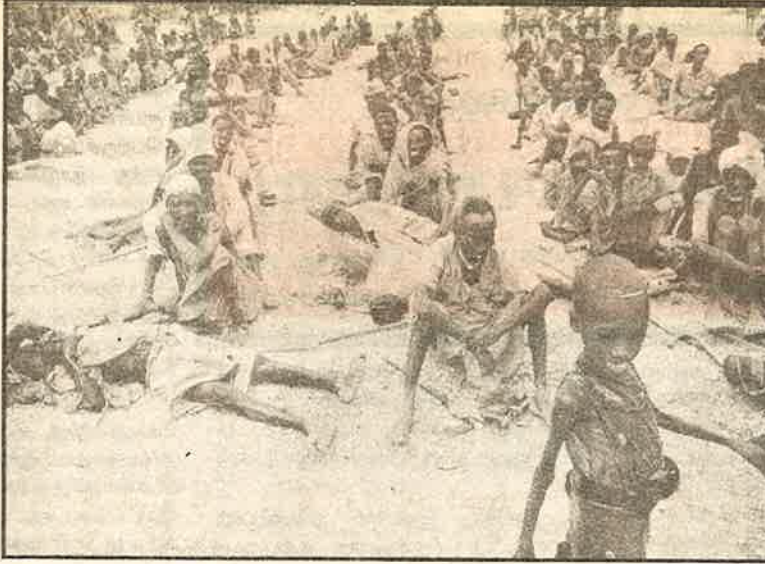
உணவுக்குத் தட்டேந்தும் சோமாலியா மக்கள்; சீரமைப்பு தந்த பேரழிவு

மெக்சிகோ நாட்டில் அரசின் கேடுகெட்ட சமூக - பொருளாதார கொள்கைகளை எதிர்த்து அந்நாட்டின் பூர்வகுடி சியாபஸ் இனமக்கள் இந்த ஆண்டின் தொடக்கத்தில் புரட்சிகர யுத்தத்தைத் தொடுத்தனர். இங்கு மட்டுமின்றி ஆப்பிரிக்காவிலுள்ள காரகஸ், துனிசியா, நைஜீரியா, மொராக்கா, மாலி