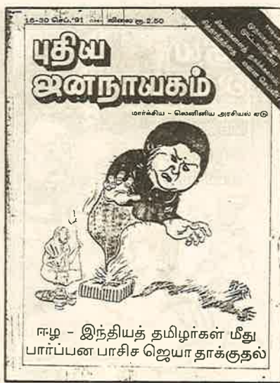
ஈழ - இந்தியத் தமிழர்கள் மீது பார்ப்பன பாசிச ஜெயா தாக்குதல்

"ஈராக் இப்போது நடத்தும் யுத்தம் எந்த வகையிலும் நீதியானது இல்லை என்பதால்தான் அமெரிக்கா, இஸ்ரேல் ஆகிய எதிரிகளின் குற்றங்களைச் சொல்லி தனது ஆக்கிரமிப்பை நியாயப்படுத்துகிறது. ஒரு தரப்பின் ஆக்கிரமிப்பு, ஆதிக்கக் குற்றங்கள் இன்னொரு தரப்பின் அதே தன்மையுடையவைகளை நியாயப்படுத்திவிட முடியாது. ஆகவே எந்தத் தரப்பிலும் நியாயமில்லாத ஆக்கிரமிப்பு - ஆதிக்க, நாடு பிடிக்கும் இந்த யுத்தத்தை அநீதியானது, கொடூரமான பேரழிவு விளைவிக்கக்கூடியது, பிற்போக்கானது, கொள்ளையடிப்பதற்கானது ஆகிய ஏகாதிபத்திய போர்களின் தன்மைகளைக் கொண்டது என்கிறோம். இத்தகு யுத்தங்களின் போது எத்தரப்பையும் ஆதரிக்க முடியாது; ஆதரிக்கவும் கூடாது. மாறாக, யுத்தங்களின் விளைவான அரசியல், பொருளாதார நெருக்கடிகளைப் பயன்படுத்திக் கொண்டு இரு தரப்பினது ஆளும் வர்க்கங்களையும் வீழ்த்தும் புரட்சிகர யுத்தத்தைத் தொடுக்க வேண்டும். இதுதான் அநீதியான யுத்தத்தை நீதியான யுத்தமாக மாற்றுவது என்றார் லெனின். போதிய பலமில்லை என்றால் அரசுக்குரிய யுத்தகால நெருக்கடிகளையும், மக்களது வெறுப்பையும் புரட்சியை முன்னேற்றுவதற்குப் பயன்படுத்த வேண்டும் என்கிறார் லெனின்." (ஆராமாண்டு, இதழ் எண்:8, 1-15 மார்ச் '91)