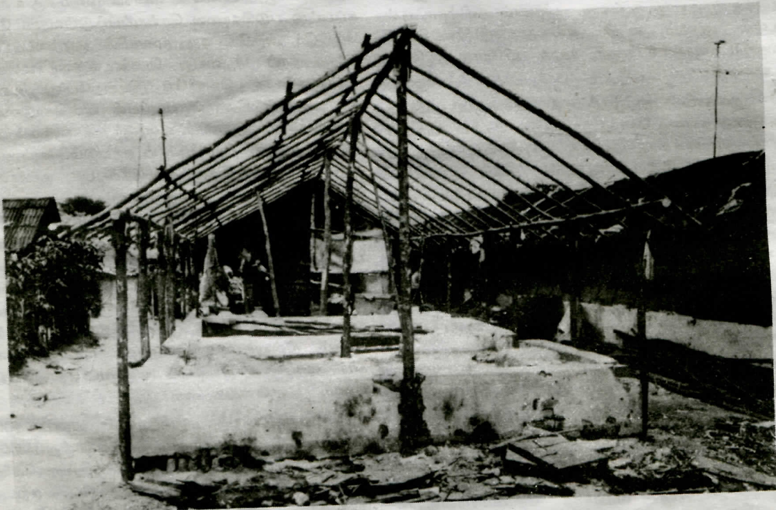
தமிழ்நாட்டில் தமிழீழ அகதிகளுக்கு மட்டுமல்ல, அவர்களின் வீட்டிற்கும் மழை, வெயிலிடம் இருந்து பாதுகாப்பு இல்லை.

* (EXIT) குடியகலவு என்ற வார்த்தைக்காக இச்சொல் பயன்படுத்தப்படுகிறது.