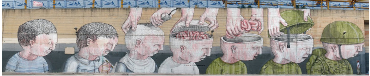
From the Draw The Line street art Festival.