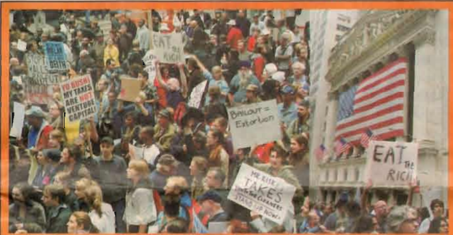
நியூயோர்க்கில் வோல் ஸ்ட்ரீட் எதிர்ப்பு ஆர்ப்பாட்டத்தில் பல்லாயிரக்கணக்கான அமெரிக்க மக்கள் தொடர்ந்து வீதப் போராட்டம் நடாத்தி வருகின்றனர்.