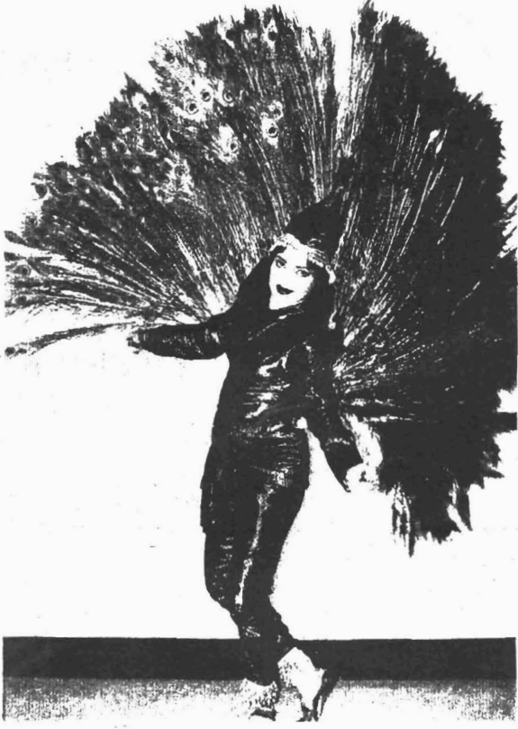
கேள்வி 1 - நடனம்-வகைகள்-தோற்றம்-வளர்ச்சி பற்றி விளக்கி கூற முடியுமா?

பதில் பாரத கலாசாரத்தின் சுமார் 200 ஆண்டு பழமையான நாட்டியக் கலைக்கு பரதர் என்னும் முனிவர் இலக்கணம் வகுத்துள்ளார். 'நாட்டிய சாஸ்திரம்' என்ற சமஸ்கிருத மொழி நூலை நமக்கு கிடைத்துள்ள, நாடகவியலைப் பற்றிய நூல்களில் உலகில் மிகத் தொன்மை வாய்ந்தது. எனினும் இந்த நூல் எழுதப்பட்ட காலத்திலேயே "கூத்து" என்ற பெயரில் முதிர்ச்சி பெற்ற ஒரு ஆடற் கலை மரபு பண்டைத் தமிழர் மத்தியில் நிலவியதற்கு சிலப்பதிகாரம் ஆதாரம் தருகிறது-இந்தக் "கூத்து" என்ற நடன மரபே கால ஒட்டத்தில் "சதிர்" போன்ற பல பெயர்களை எடுத்து, மாற்றமடைந்து, இறுதியில் கடந்த அரை நூற்றாண்டு காலமாக "பரத நாட்டியம்" என்ற பெயரில் புகழ் பரப்பி நிற்கிறது. ஆந்திர மாநிலத்தின் கூச்சப்பிடி, கேரள மாநிலத்தின் கதகளி, மோகினி ஆட்டம், ஒரிசா மாநிலத்தின் ஒடிஸி நடனம், வட இந்தியாவின் கதக் நடனம், மணிப்பூர் மாநிலத்தைச் சேர்ந்த மணிபுரி என்பனவும் பாரதத்தின் சாஸ்திரியே நடனங்கள் ஆகும்.