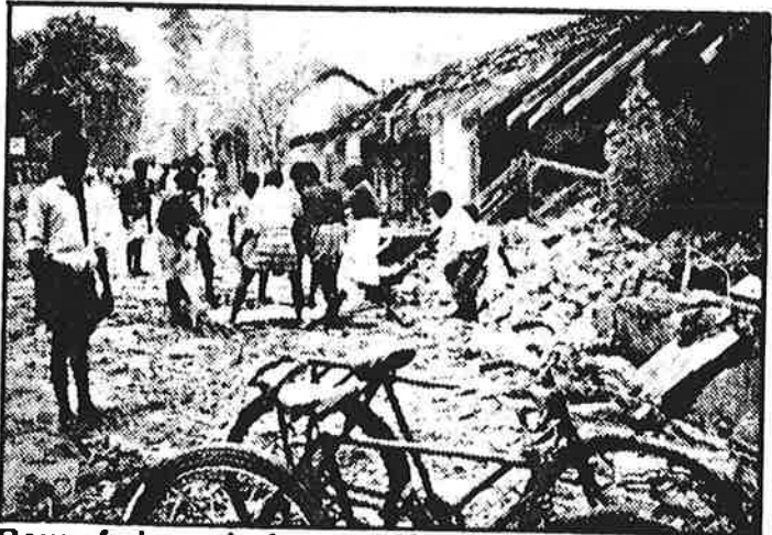
Row of shops in front of Manipay Mission Hospital after bombing of hospital on 7th August. Body being dragged out.

வடிக்கைகள் சில தமிழ் பேசு ம் மக்களுக்கு கிடைக்காத அமைந்தது. உணவு விவசாய கத்தில் சீரின்மை. உடல் வய த்தவற்றான அழிமதிப்பீற்றும் கிணைகள் விடுதலைப்புகளின் மீது மருத்துவமனை தோற்றுவித்த போது ம் தவிர்க்க முடியாதபடி உரு திப்புலிகளின் பன்னாள் அகதி நாட்டில் அகதியை கட்டியும் மக் களுக்கு விவசாயமளிக்கிறது.