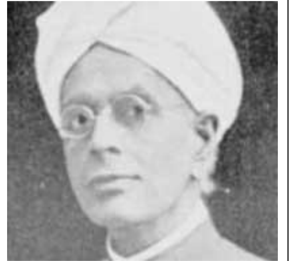
Sir Ponnambalam Ramanathan

எனவே அவர் “சுய உதவி” என்ற ஸ்மைல் எழுதிய நூலினையும், “ஒழுக்க விஞ்ஞானம்” என்னும் பிணைமிக்கின் நூலினையும் சுதேச