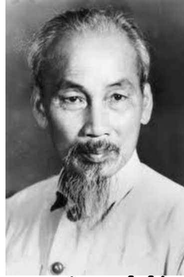
தோழர் ஹோ சி மின்