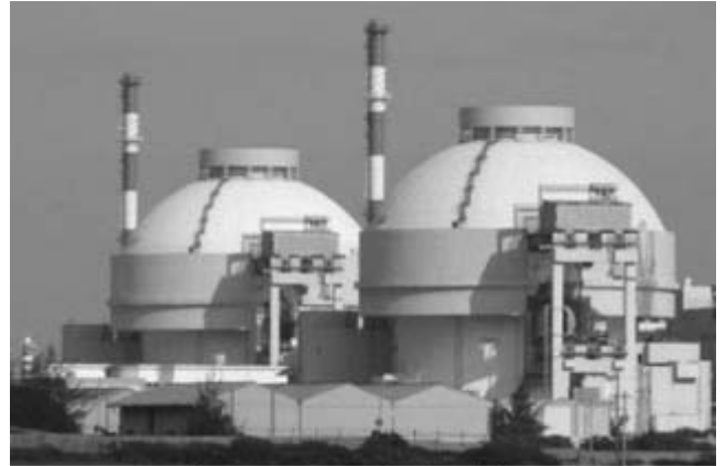
கூடங்குள அணுமின் நிலையம்

அணு உலைக்கு ஒரு கிலோமீட்டர் தூரத்தில் இருப்பது இடிந்தகரை. அடுத்த ஐந்து கிலோமீட்டர் சுற்றளவுக்குள் இருப்பவை கூடங்குளம், வைரவிக்ணு, செட்டிகுலம், ஸ்ரீரங்கநாதபுரம், பெருமணல், கூத்தப்புவி ஆகியவை. இந்தக் கிராமங்களில் எந்த ஒத்திகையும் நடாத்தப்படவில்லை.