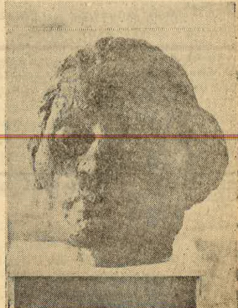
சிற்பம் : கலைஞர் . எஸ். தனபால்

ஊரை நீங்கித் தூரே வயல்வெளிகள் பரந்திருக்கின்றன. இடையிடையே பனங் கூடல்களும் திடல்களும் தனித்துக் கிடக்கின் றன. மாலை நேரங்களில் அம்மா அவ்விடங் களில் புல் செதுக்கிக் கொண்டுவரப்போவாள். சைக்கிள் ஓட்ட முடியாது அவ்விடங்களில். சீலன் சைக்கிளில் சாய்ந்தபடியே ரோட்டில் காத்து நிற்பான். அம்மா புல்லுக் கட்டுடன் திரும்பி வரும் நேரங்களை அவன் நன்கு அறி வான். அம்மாவின் உருவம் மிகத்தூரே மங் கலாக தெரியும் போதே ரோட்டை விட்டிறங்கி