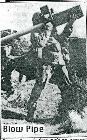
வீணா எதிர்ப்பு 'புயிளோ வாய்' ரக ஏவுகணை. நவீன யுத்தத்தில் ஏவுகணைத் தொழில்நுட்பம் முக்கிய பங்கு வகித்து வருகிறது. தொழிலாளர் விடுதலையாளி டாக்டர் வெணா அவர்கள் பிழைக்கிட்டு என்பவர்தான் ஏவுகணை யுகத்தின் ஆரம்பித்து வைத்தவர். இவரது ஏவுகணையின் தந்தை என்று சொல்லலாம்.

மெய்விலலை. அதற்கும் ஒரு காரணம் இருந்தது. "குட்டேசைக்குள் கூத்தல் தங்குதான் இருக்க வேண்டும். பாராபா வேறு இருக்க வேண்டும். மெல்ல அமுக்கிக் கொள்வதால் என்ன" என்று அந்த அதிகாரிக் குழு ஆசை வந்துவிட்டது. தனது காடியில் மெசைக்கு கீழே குட்டேசை பத்திரமாக வைத்துக் கொள்ளார். குட்டேசில் கைமாறவிட்டது விமானத்தில் ஏற்றப்பட்டவில்லை. சென்னை விமான நிலையத்துக்குள் வெடித்து விடப்போகிறது என்று தமிழ் நாடு இராணுவ உறுப்பினர்களுக்கு விளக்கிவிட்டது. பயனிகளை அழும்பு வந்த பார்வை யாளர்கள் போல நின்று அனைத்தையும் அவர்கள் கவனித்துக் கொண்டிருந்தார்கள். விமான நிலையத்தை விட்டு வெளியே ஓடி, பொதுத்தொலைபேசி ஒன்றில் இருந்து விமான நிலையத்தோடு தொடர்பு கொண்டனர்.