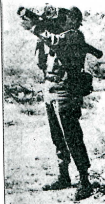
வீணா எதிர்ப்பு 'புயிள்கள்' ரக ஏவுகணை தரை-ஆகாய ஏவுகணையும் பயன்படுத்தப்பட்டுள்ளன. மோட்டாரில் இருந்து ஏவப்படும் ஷெல், பீரங்கியில் இருந்து ஏவப்படும் குண்டுகள் போன்றவை ஏவுகணை ரகத்தில் சேர்ந்தவையல்ல. அவை கரைக ஆயுத வகைகளைச் சேர்ந்தவையாகும்.