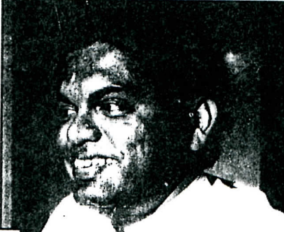
மனவாக்கில் இரத்தியுடைய துரிதங்களுக்குச் சேர்ந்தவரான இரு கடைகளுக்கும், மாவட்டத்தில் இரு கடைகளுக்கும் வரிசையிட்ட பதுகையையும் துரிதங்கள் தாக்கப்பட்டன. 7.12.84 அன்று இச்சம்பவங்கள் நடந்தன.

திரு. அத்துலத் முதலிய அவர்களின் அப்பாவி மக்களுக்கு எதிராக இனாதரத்தில் நடுத்திரிகள், கிடவாரும் வெவ்வேறு சூடிய முறையில் இனக் கொலைச் செயலியில் நல்ல மிக வல்லவராகியிருக்கிறார்.