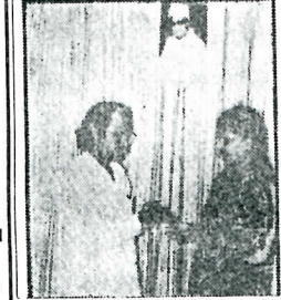
கூட்டணித் தகவல் மு. சாமிநாயக்கன் மாரியார் தனிவிட்டுப் பறிமுடிப்பு.