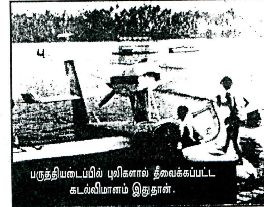
பகுதியைப்படி புலிகளால் தீவைக்கப்பட்ட கடல்விமானம் இதுதான்.

வட்டமேசை மாற்று தோல்வியை நிதலம் அகிம்சைப் போராட்டம் நடத்தப் போவதாகக் கருறிந்ததால் கட்சியின் செயலாளர் நாயகமாவிற்குத் அமிர்தலின் கடிமம் வட்டமேசை மாறாட்டில் கலவரை வலுவின்றி ஒத்திப்போட்டி கேட்டார். இந்தியாக்கறிந்த கொள்கைதலவாய் போசப்போராளர்கள் என்று சொன்னார் அமிர்தலின் கடிமம். ஆனால் இந்திய அரக கொள்கை எடுத்து வேறு விதமாக இருந்தது.