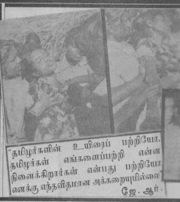
தமிழர்களின் உயிரிழப்பு பற்றியோ, தமிழர்கள் எங்களைப்பற்றி என்ன நினைக்கிறார்கள் என்பது பற்றியோ எனக்கு எந்தவிதமான அக்கறையுமில்லை ஜே. ஆர்.