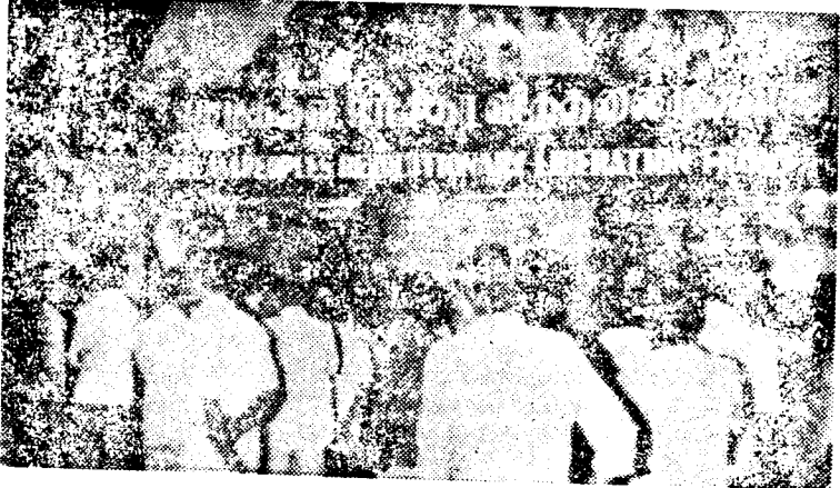
ஈழ மக்கள் புரட்சிகர விடுதலை முன்னணி கண்காட்சி மண்டபத்தில் மக்கள் கூடியிருக்கின்றார்கள்.

தமிழக மக்களுக்கு மிக இலகுவில் எளிதும் வண்ணம் இக்கண்காட்சி ஒழுங்கமைக்கப்பட்டுள்ளது. இக்கண்காட்சியை பார்வையிட்ட அரசியல் கட்சிபிரமுகர்களும் தமிழக மக்களும் ஈழப் போராட்டத்திற்கு தமது பங்களிப்பு ஆதரவு தொடர்ந்தும் உண்டு என உறுதி கூறிச் சென்றுள்ளனர். கண்காட்சி மண்டபத்தில் வைக்கப்பட்டிருக்கும் கருத்துக்களைப் பொறிக்கும் புத்தகத்தில் கருத்தாளமக்க பல குறியீடுகள் அழுத்தப்பட்டுள்ளன. டெரூபாலாஜோ ஈழவிடுதலை இயக்கங்கள் மத்தியில் ஐக்கியம் ஏற்பட வேண்டும் எனவும்; மிகத் திறம்பட அமைக்கப்பட்டுள்ள இக்கண்காட்சியை தமிழக மெங்கும் நடத்த வேண்டும்