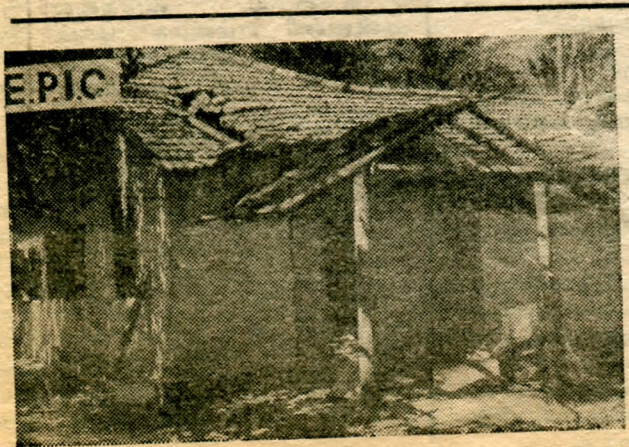
ஆக்கிரமிப்பு படைகளால் தீக்கிரையாக்கப்பட்ட ஈழமக்கள் குடியிருப்பில் ஒன்று.

ஈழ விடுதலை அமைப்புகளின் ஆதரவுடன் தமிழர் நல மருத்துவ அமைப்பு உருவாகியுள்ளது. ஈழப்பகுதிகளில் கொடிய நோய்கள் பரவி வருகின்றன. சிறீலங்கா வதைமுகாம்களில் ஒருவித தொற்று நோயைப் பரப்பும் ஊசி ஏற்றப்படுகிறது. வதைமுகாம்களால் மீண்டு வரும் ஈழத்தவரிடம் இந்த தொற்று நோய் ஏற்பட்டு மற்றவர்களுக்கும் பரவுகிறது. இதுதவிர இப்போது தமிழ் பகுதிகளுக்கு சிறந்த மருந்துகளை அனுப்புவதையும் ஆக்கிரமிப்பாளர்கள் நிறுத்தி வருகின்றனர். இவற்றால் தமது மருத்துவ தேவைக்கு எதிரியின் மருத்துவ அமைப்புகளை நம்பி இருக்காது ஈழமக்களுக்கு மருத்துவ சேவை வழங்க தமிழர் நலமருத்துவ அமைப்பு உருவாகியுள்ளது. எதிரியோடு போரிடும் ஈழப்போராளிகளுக்கு மருத்துவ உதவி வழங்கவும் மருத்துவ அமைப்பு ஒன்றின் தேவை எழுந்தது. எனவே ஈழவிடுதலை அமைப்புகளின் முயற்சியாலும் ஒன்றுபட்ட ஆதரவுடனும் தமிழர் நல மருத்துவ அமைப்பு தோன்றியுள்ளது. இந்த அமைப்பினர் உலகெங்கும் வாழும் தமிழரிடமும், ஈழப்போராட்ட ஆதரவுச் சக்திகளிடமும் மருத்துகளை சேகரித்து வருகிறார்கள். தமிழர் நல மருத்துவ அமைப்புக்கு தாராளமாக உதவுவதுமூலம் ஈழ மக்களினதும், போராளிகளதும் நலனுக்கு உதவுமாறு கேட்டுக்கொள்கிறோம். உதவி செய்ய விரும்புவோர் கீழ்க்கண்ட முகவரியுடன் தொடர்பு கொள்க.